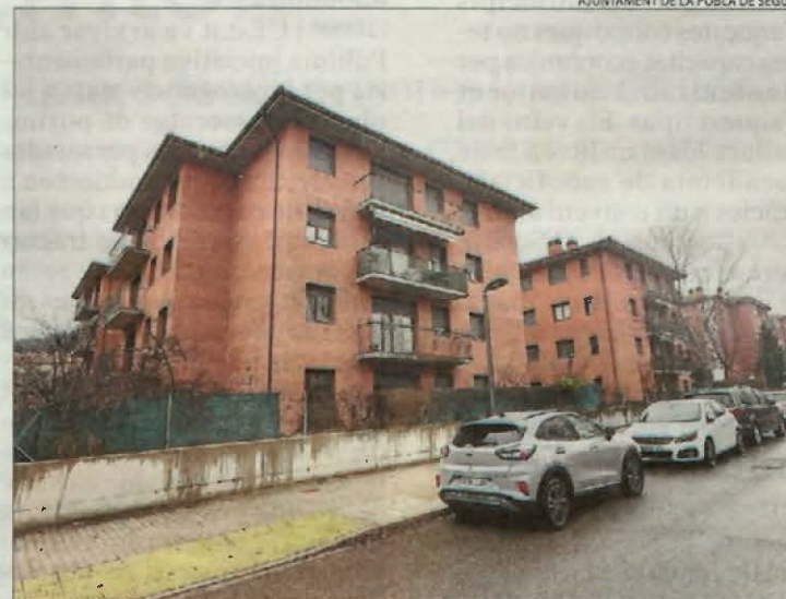
L'exterior dels blocs d'habitatges que va adquirir l'Incasòl.

Per la seua part, fonts de l'Incasòl van explicar que la demora en el procés es deu al fet que treballen perquè les adjudicacions es facin amb totes les garanties i van afegir que uns altres deu habitatges ja estan adjudicats i a l'espera de lliurar-ne les claus. Pel que fa a la resta, quatre estan pendents que la persona adjudicatària presenti la renúncia; tres s'han reservat per a la Taula d'Emergències; cinc estan a punt per oferir-se a les persones apuntades al registre i unes altres sis estan esperant resposta de confirmació. Paral·lelament,