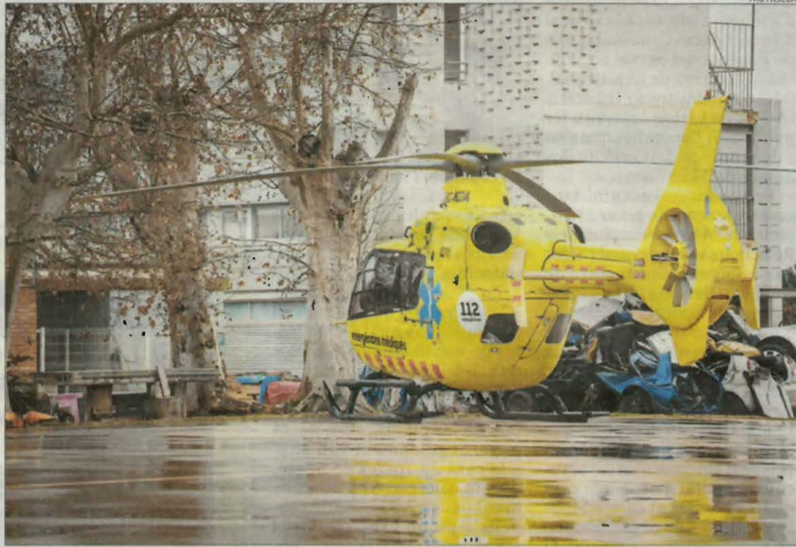
Un helicòpter del SEM traslladat al parc de bombers de Lleida el mes de febrer passat.

Aquesta celeritat es deu al fet que la contractació no es farà mitjançant un concurs públic, com és habitual, sinó a través d'un procediment negociat amb empreses del sector. Es tracta d'una opció prevista per la normativa en casos justificats per raó d'urgència. Aquesta sorgeix de constatar que Eliance "no està substituint els helicòpters