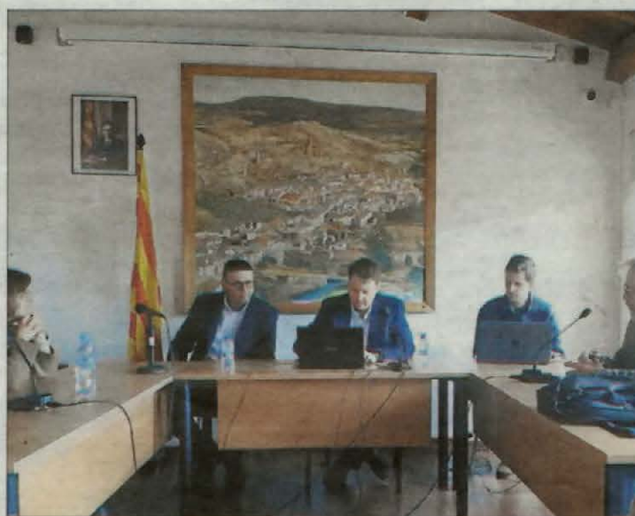
El segon ple d'ahir a Castelló de Farfanya.