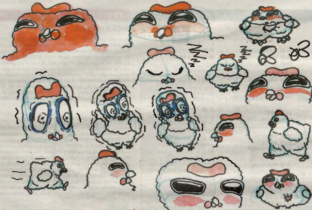
► Pirrin Piu Piu · Esbossos de disseny de personatge de Pirrin Piu Piu. Disseny del personatge de la protagonista. Tècnica: retoladors calibrats i aquarel·la sobre paper