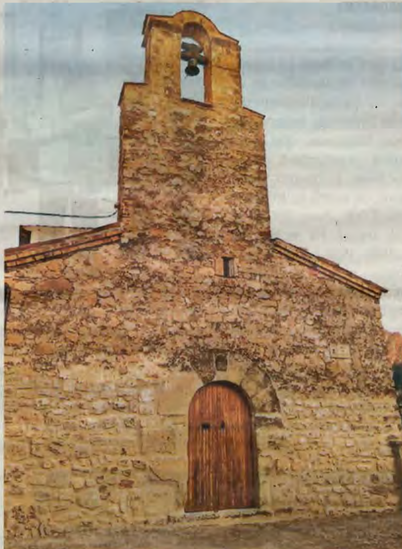
Imatge de l'església de Sant Joan Baptista de Cellers

Pel que respecta a l'església de Cellers, es tracta d'un temple en què les parets interiors estan decorades amb pintures al fresc obra de Josep Minquell.