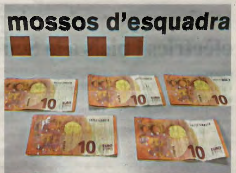
Bitllets falsos de 10 euros incautats

L'home va admetre que anava molt begut i drogat, però va negar que la forçés sexualment perquè "gairebé no podia aguantar-me dret".