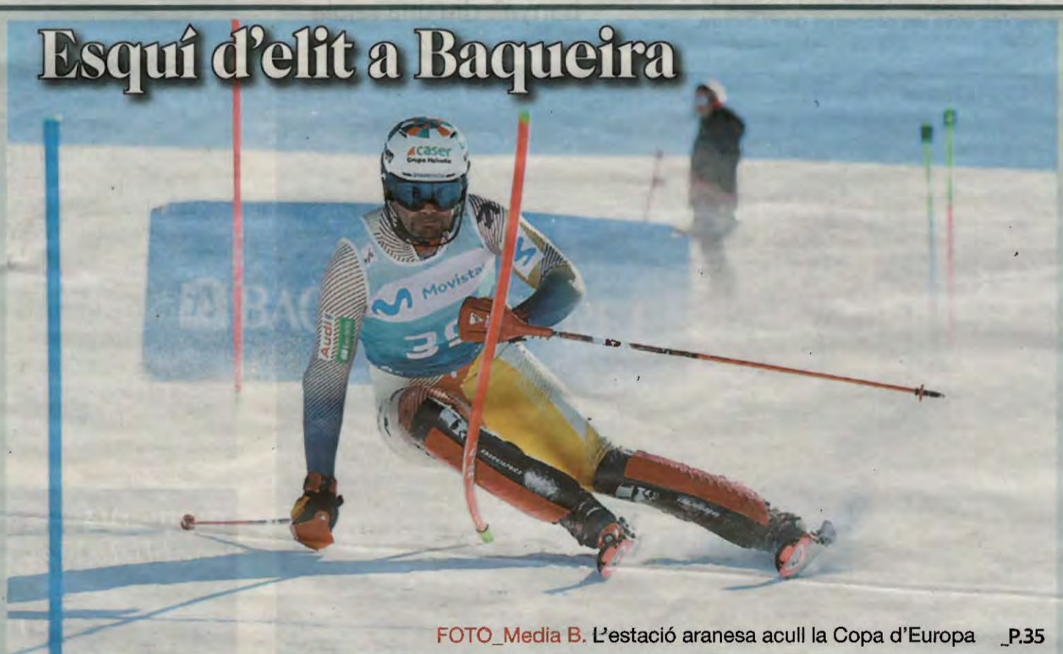
FOTO_Media B. L'estació aranesa acull la Copa d'Europa _P.35