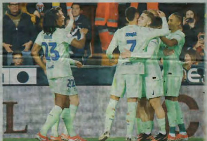
L'equip de Flick jugarà les semifinals