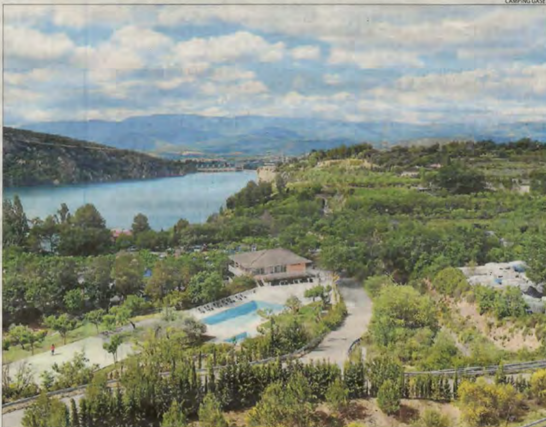
Imatge d'arxiu del càmping Gaset de Talarn, el pla urbanístic del qual s'ha aprovat aquest mes.

La Generalitat va anunciar al novembre que 16 càmpings catalans, la majoria al Pirineu, tenen més del 50% de la superfície en zones de flux preferent, les de més risc en cas de riudes, i va apuntar a la possibilitat d'expropiar i traslladar-ne alguns (com va avançar SEGRE el 13 de novembre). El sector, per la seua part, reclama altres solucions com implantar sistemes d'alarma a les capçaleres dels rius per alertar davant d'avingudes. La regularització de les àrees d'acampada s'està desenvolupant des de fa anys a través de plans urbanístics. Tanmateix, amb prou feines se n'han aprovat una dotzena, i només un en els dos últims anys (vegeu el desglossament).