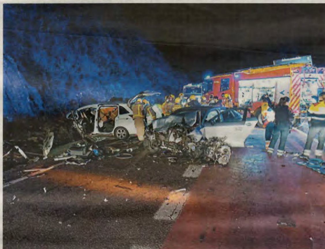
El xoc es va produir a la C-13 al tram del municipi de Vilanova de Meià

A les 17.56, els Bombers van informar d'una col·lisió entre dos turismes al quilòmetre 67,5 de la C-13, al terme municipal de Vilanova Meià. L'accident va obligar el servei de Trànsit a tallar la carretera a les 18.34. Aquesta va romandre almenys dues hores en aquest estat (al tancament d'aquesta edició, la circulació continuava tallada). Cinc persones es van veure involucrades en el succés, tres homes i dues dones. Segons el SEM,