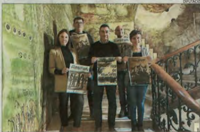
Presentació del certamen ahir a la Diputació.