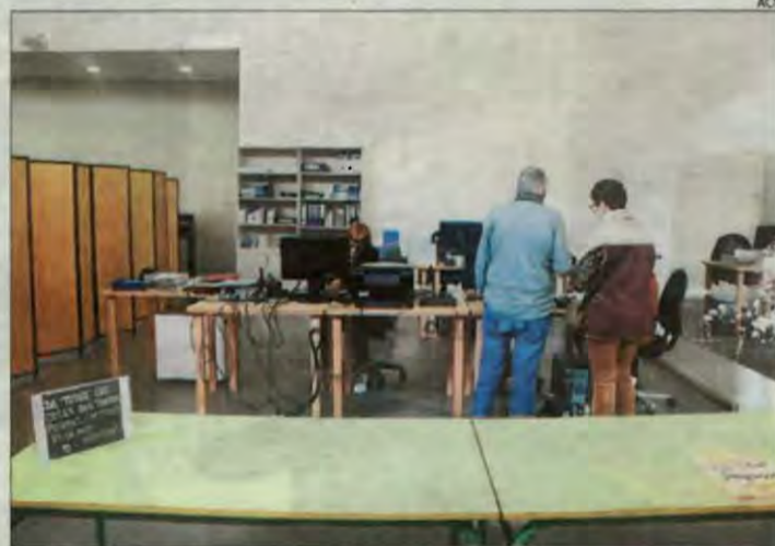
Les dependències s'han habilitat al centre cívic.