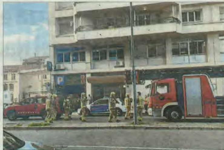
L'incendi es va declarar a primera hora de la tarda.