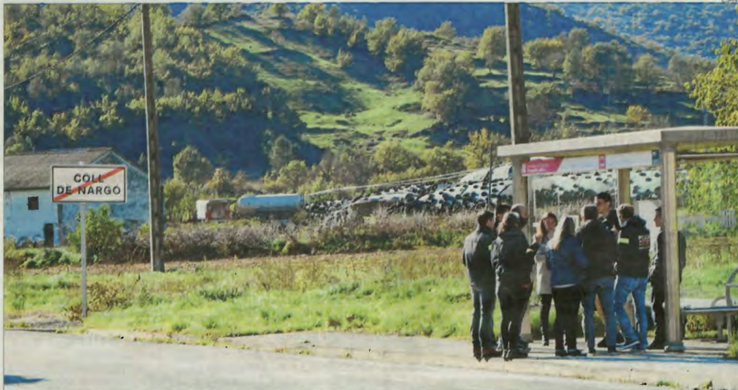
La comitiva judicial i policial ahir, durant la reconstrucció dels fets, a la parada de l'autobús.