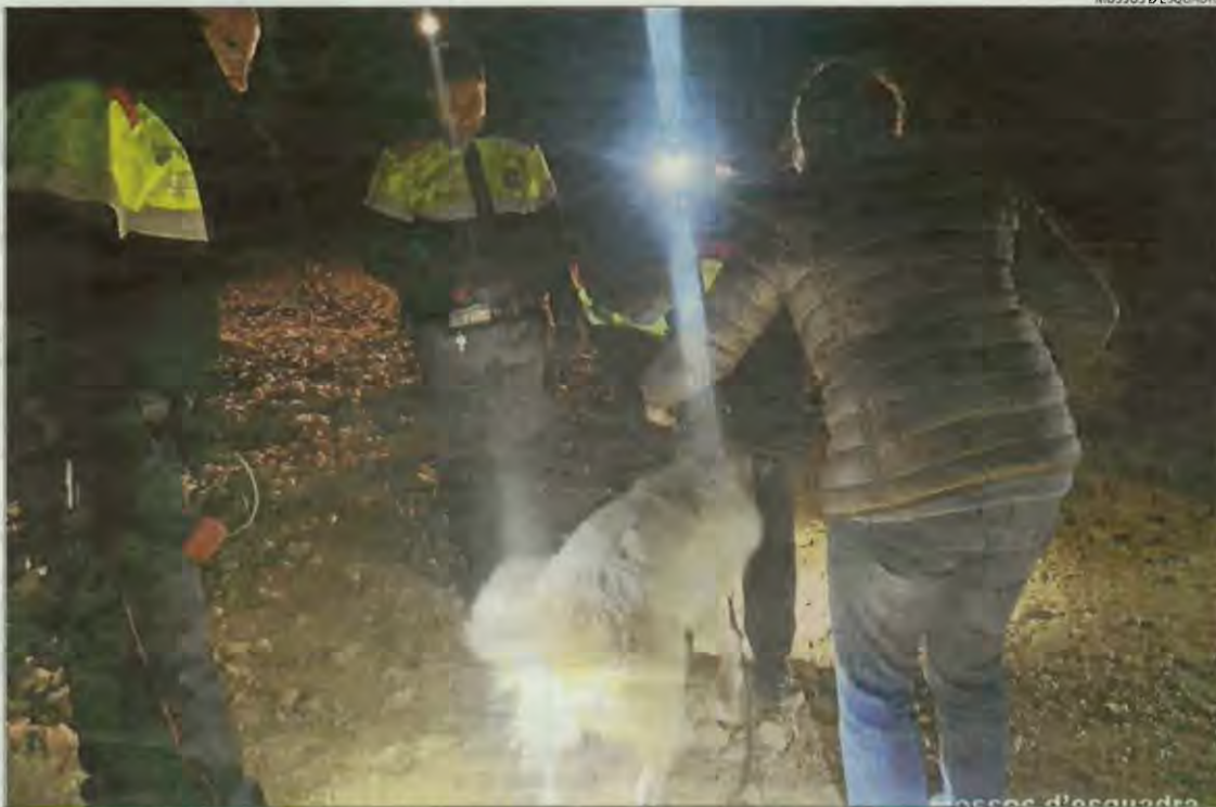
El gos va ser rescatat pels Mossos i els Bombers el novembre del 2021.

LLEIDA | El Jutjat Penal 1 de Lleida ha condemnat, per conformitat, a una pena de tres mesos de presó un veí de Tremp que li va robar el gos a la seua cunyada i el va tirar al pantà de Sant Antoni des d'una altura d'uns 12 metres. L'acusat va acceptar la pena, després d'un acord entre les parts, en una visita oral que es va celebrar dijous passat. Segons la sentència, a la qual ha tingut accés aquest diari, ha quedat provat que els fets van tenir lloc la tarda del 16 de novembre del 2021, quan el condemnat va accedir a la finca de la seua cunyada i es va emportar al seu gos, de raça mastí. Va pujar l'animal al seu vehicle, sense autorització de la propietària, i el va portar fins a les proximitats del pantà de Sant Antoni, en concret en una zona propera a les comportes de la presa de Talarn. Una vegada allà, "amb intenció palmària d'acabar amb la vida del gos", el va llançar des del penya-segat a l'aigua, des d'una altura d'uns 12 metres, per després abandonar el lloc "sense informar ningú de la localització de l'animal". La sentència considera provat que la intenció era "assegurar-se'n la mort per mitjà d'ofegament, de les lesions patides per la caiguda o de la hipotèrmia derivada del fet que l'aigua es trobava a una