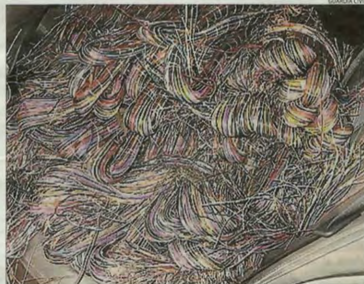
Cable telefònic decomissat a dos arrestats a la Cerdanya.

D'altra banda, la Guàrdia Civil de Lleida va detenir diumen-