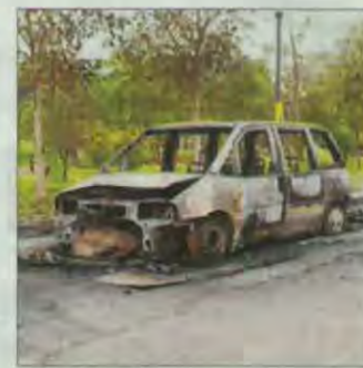
Imatge del cotxe.