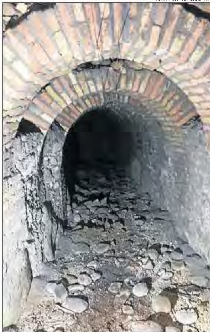
L'interior del refugi antiaeri de la plaça del Daldo.

Quant al refugi de sota de la plaça del Daldo, es tracta d'un corredor excavat al subsòl amb forma de lletra ele d'uns 42 metres de llarg i que compta amb una entrada i una sortida. Té un ample d'1,70 metres i 2,1 metres d'altura i el sostenen arcs d'obra de fàbrica.