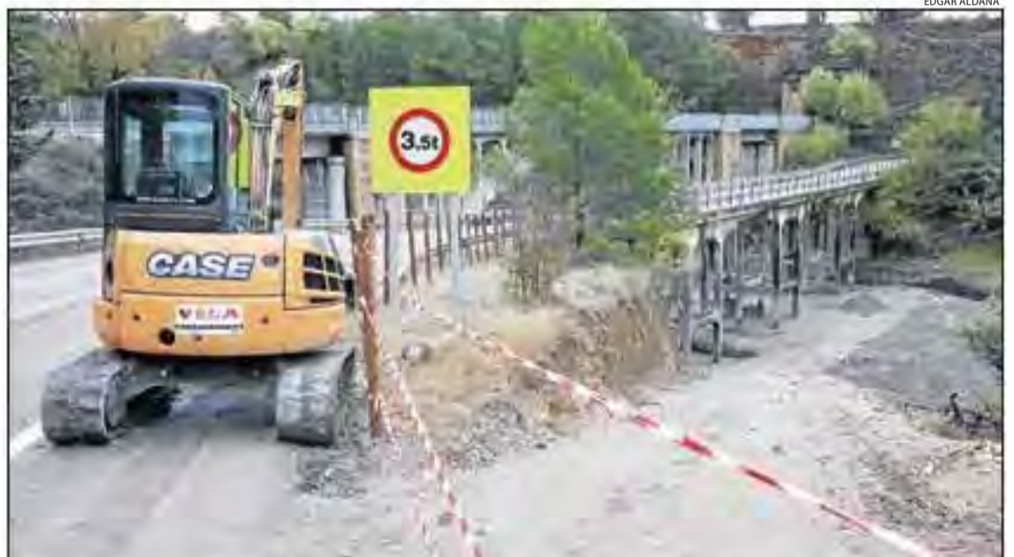
Maquinària treballant aquests dies al pont dels Palillos per restaurar-ne l'estructura.

Un senyal limita ara a 3,5 tones el pes dels vehicles que poden creuar-lo. Quan finalitzin els treballs podran fer-ho camions de fins a tretze tones. L'estructura forma part de la ruta cicloturística dels Llacs, que uneix Lleida amb la Pobla de Segur.