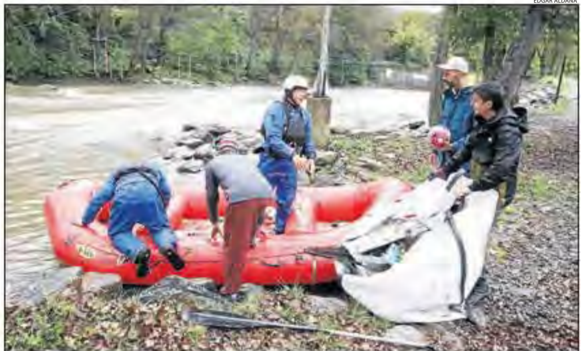
Alguns dels voluntaris que ahir van participar en la neteja del curs organitzada per IniciativaRius.

Així mateix, al llarg dels anys s'han fet actuacions dins del tram natural i no canalitzat de la Pallaresa al seu pas per Sort i s'ha comprovat que les variacions estacionals de cabal, les activitats nàutiques, tant al camp de regates com a l'estadi