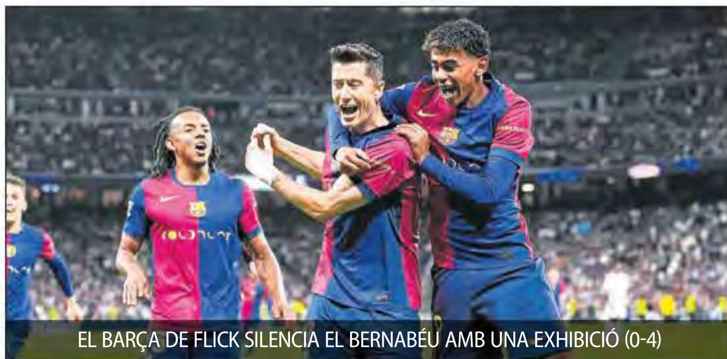
EL BARÇA DE FLICK SILENCIA EL BERNABÉU AMB UNA EXHIBICIÓ (0-4)