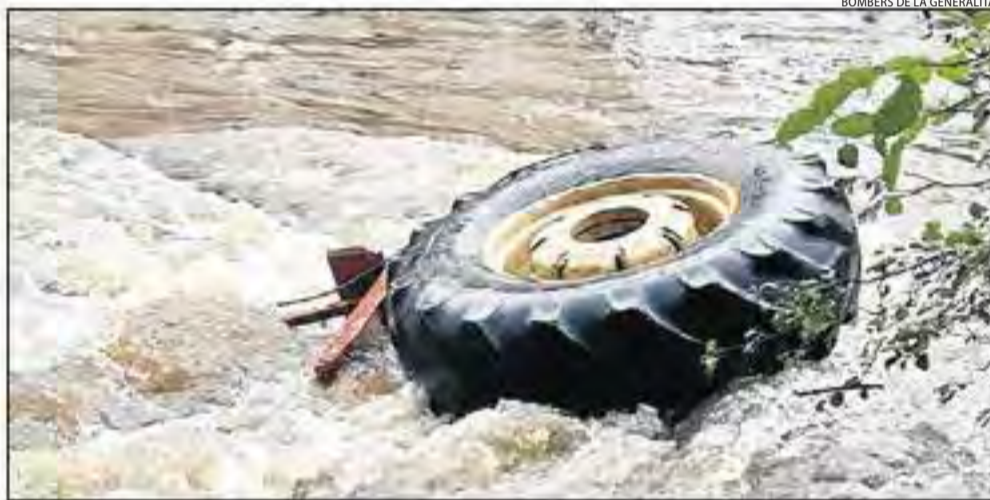
El tractorista es va subjectar a la roda per no ser arrossegat pel corrent.

Precipitacions || Les fortes pluges deixen 50,3 litres a la Seu d'Urgell i 50,2 a Organyà