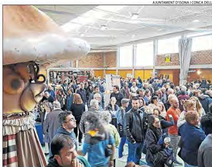
Els actes principals es van traslladar al pavelló per la pluja.