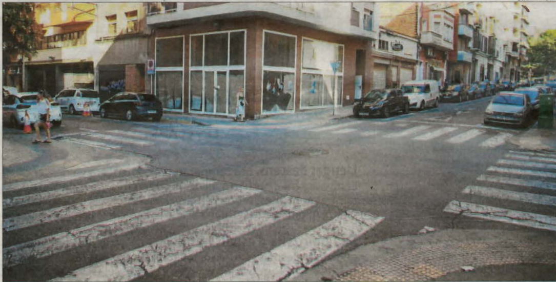
Encreuament entre els carrers Alfred Perenya i Pallars de Lleida ciutat.

La Guàrdia Urbana va arrestar sis persones durant la matinada passada a la capital. Dos d'ells van ser per violència de gènere, mentre que uns altres dos van cometre un delictes contra la salut pública per possessió de drogues. Així mateix, els dos últims detinguts van atemptar contra un agent de l'autoritat.