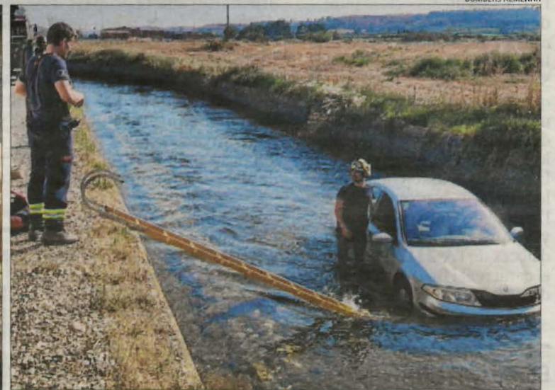
Imatge del vehicle a l'interior del canal i de l'escala que van utilitzar els Bombers per rescatar el conductor, que va resultar il·lès.