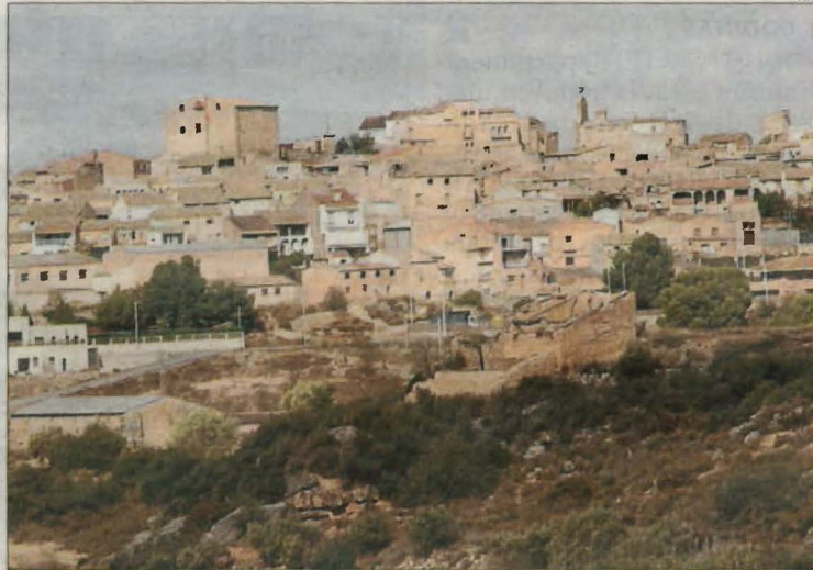
Els fets haurien passat diumenge passat a Torrebesses.

ques lleidatanes com a autors de delictes sexuals. Segons les dades publicades per l'INE, que especifiquen el tipus de delictes per províncies, el 2022 es va registrar la xifra més alta d'adolescents amb condemna per delictes contra la llibertat sexual en els últims cinc anys i