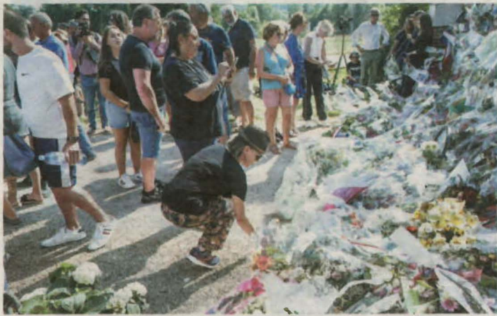
Seguidors deixen flors per homenatjar-lo