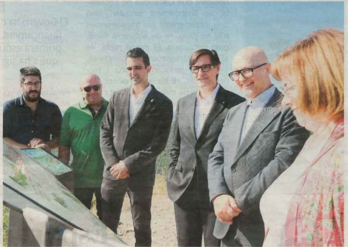
Illa durant la seva visita a Castell de Mur amb Miquel López

Més tard es va dur a terme una visita pel municipi, on van aprofitar que aquest cap de setmana la ciutat alberga el Mostremp, el festival de cinema rural. Així doncs, es va fer una visita en una de les activitats programades per explicar a Salvador Illa en què consistia el festival. Des de l'Ajuntament de Tremp es va valorar la