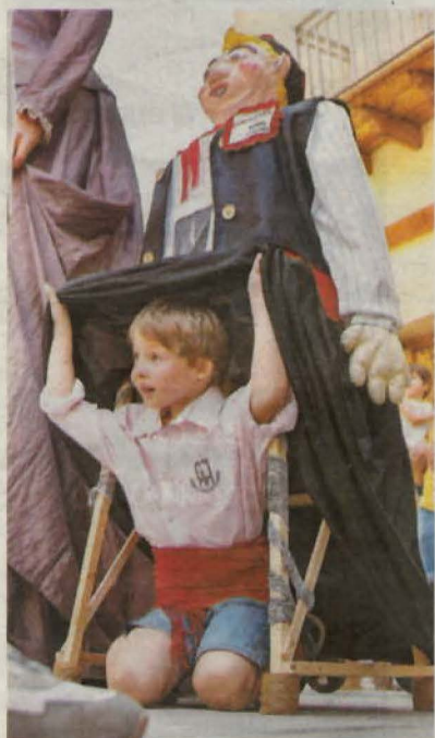
Un nen fa de portador d'un gegant a les festes de Juneda