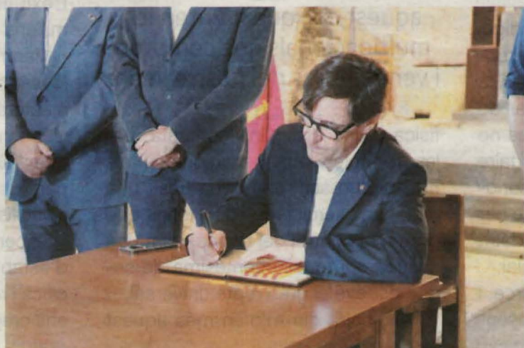
El president va signar el llibre d'honor durant la visita al Castell de Mur

visita com "una oportunitat" per conèixer l'estat actual de les infraestructures, com és el cas del reg de la conca de Tremp, així com per poder conversar amb els membres de la Comunitat de Regants de Tremp. El President va firmar també els dos llibres d'honor dels dos municipis.