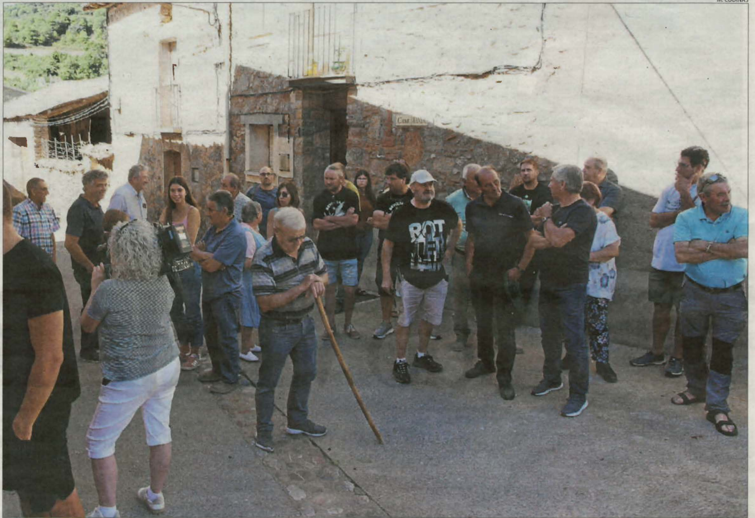
Mig centenar de ramaders es va manifestar ahir a Hortonedada contra els atacs dels cànids.

Fa més d’un segle que la família de Costa porta a pasturar les ovelles a la serra de Boumort