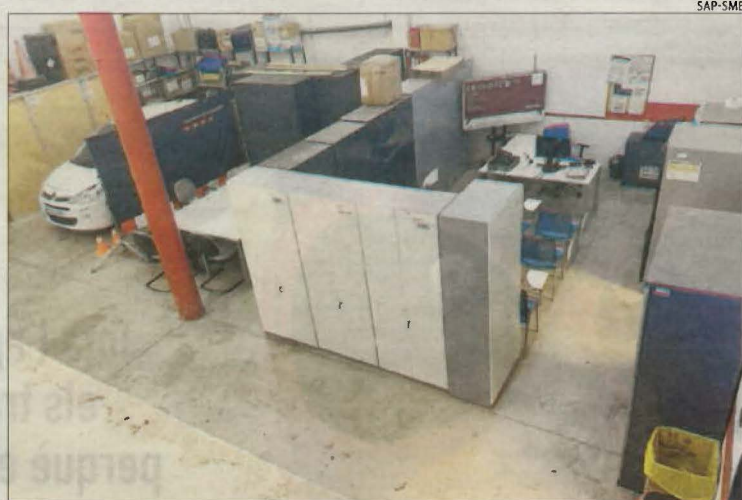
El magatzem fa de sala de reunions, segons els sindicats.

| LES BORGES BLANQUES | Els sindicats SAP i SME de Mossos d'Esquadra van reclamar ahir l'ampliació "urgent" de la comissaria de les Borges Blanques. En un comunicat, denuncien que l'equipament requereix una important reforma perquè els agents han de conviure diàriament amb una situació laboral "patètica, d'autèntica mediocritat, sense les condicions ambientals i de salubritat necessàries". Per pal·liar aquesta situació i donar una solució ràpida a la problemàtica, els sindicats han demanat de nou que s'instal·lin tres nous mòduls per ampliar l'espai, assegurant que ja estaven previstos inicialment, malgrat que finalment no es van materialitzar. En concret, els sindicats detallen que el magatzem de la comissaria