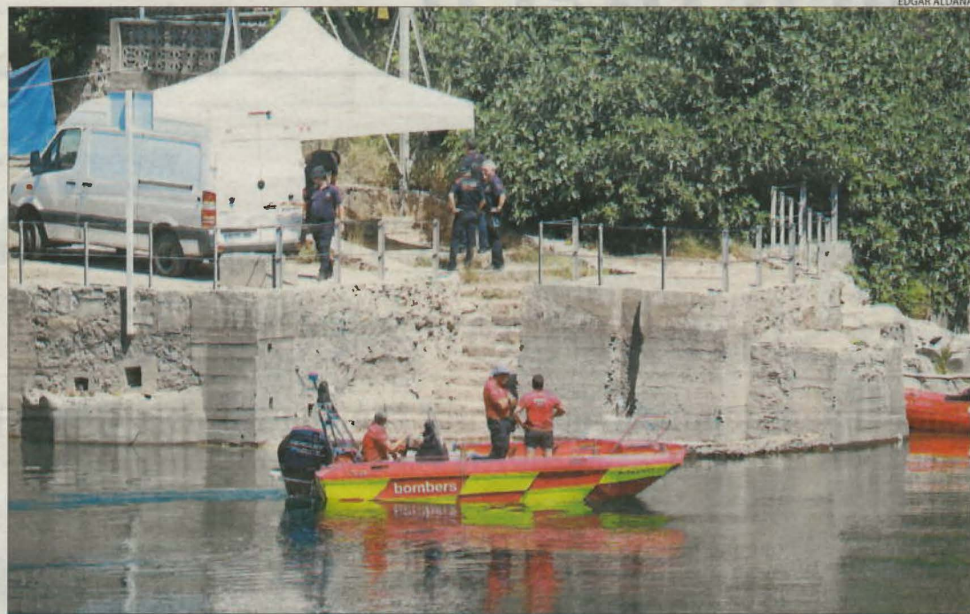
Imatge de dilluns dels especialistes dels Mossos i dels Bombers.