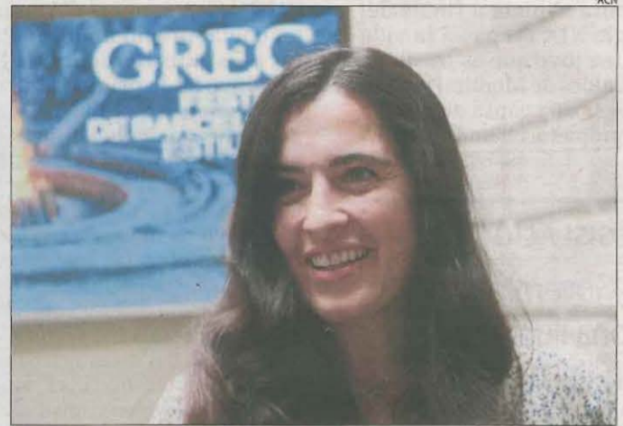
La cantant Sílvia Pérez Cruz, ahir a Barcelona.