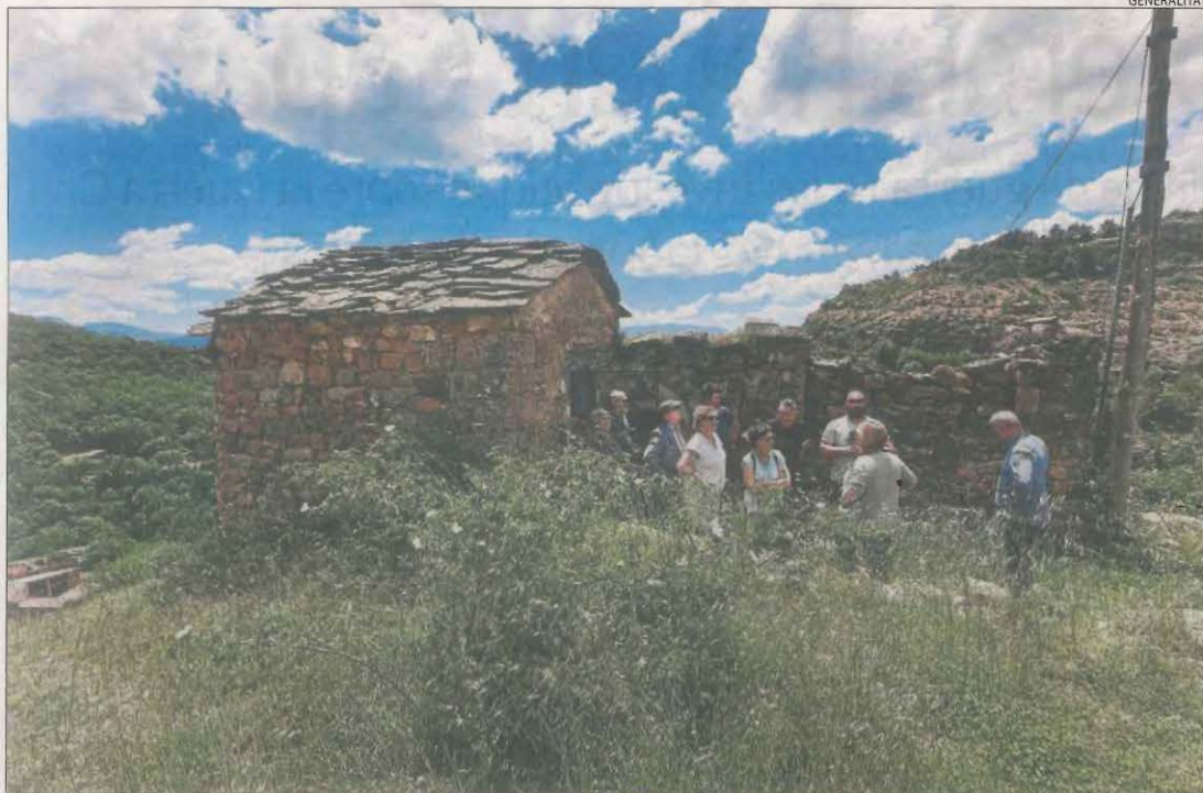
Visita tècnica a la zona rocosa on es troba l'ermita de la Mare de Déu del Castell de Rivert.