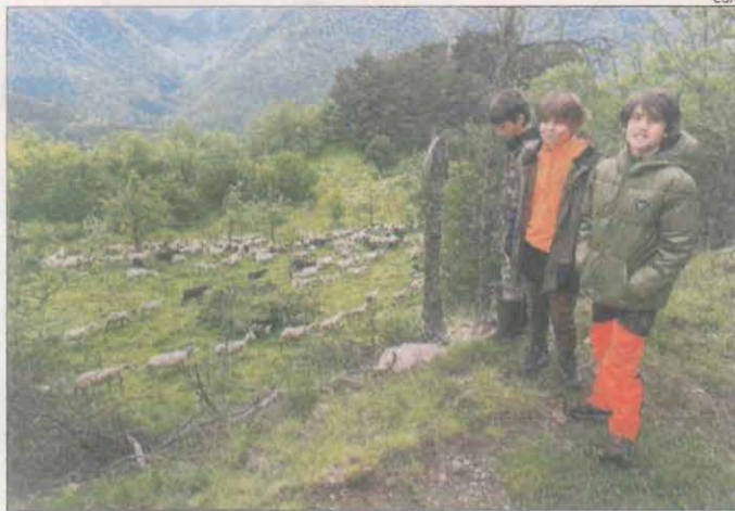
Nens davant una agrupació d'ovelles i cabres a Vilamòs.