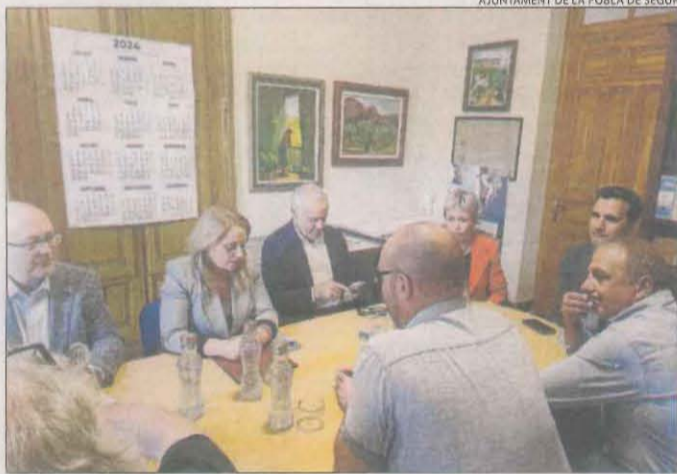
La consellera, en visita a la Pobla de Segur.