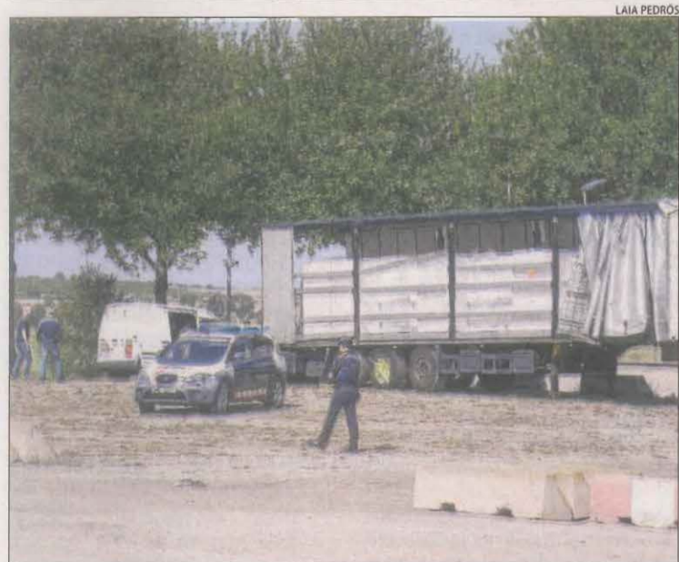
El dia que els Mossos van localitzar el carregament de droga.

BAIX PALLARS | Els GRAE dels Bombers de la Generalitat van rescatar ahir a la tarda un excursionista ferit a Baix Pallars. A les 17.35 hores van ser alertats d'una persona que s'havia lesionat i no podia seguir la ruta al barranc de l'Infern, a Collegats. Davant d'aquesta situació, al tractar-se d'un lloc de molt difícil accés, van activar l'helicòpter amb els especialistes en rescats i un metge del SEM. Els rescatadors van baixar amb la grua de l'aeronau. Després de fer-li una primera atenció in situ, el van pujar fins a l'helicòpter i, posteriorment, el van portar fins a l'hospital del Pallars de Tremp.