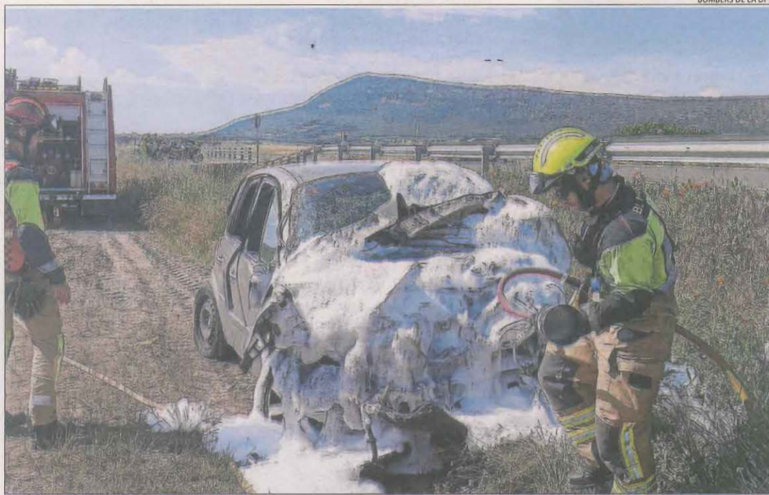
Vista del vehicle accidentat ahir a la carretera N-230 al terme municipal de Benavarri.

Es tracta del segon accident mortal en aquesta carretera que comunica Lleida amb Aran i França passant per la Llitera i la Ribagorça oscenques en menys de 24 hores i a una distància de tan sols 9 quilòmetres, ja que dilluns al migdia va morir un veí del Pont de Suert de 71 anys en una altra sortida de via a l'al-