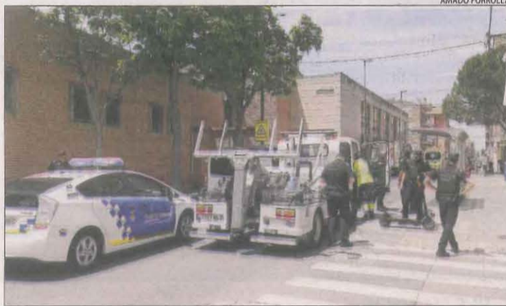
Agents de la Urbana, ahir en l'accident del Secà, a Lleida.

tura de Baells, a la comarca de la Llitera, a la Franja. En l'accident també va resultar ferida de gravetat la dona del conductor, ambdós molt coneguts a la capital de l'Alta Ribagorça.