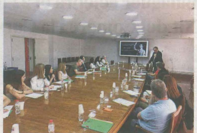
Imatge de la jornada celebrada ahir

L'objectiu de la taula és fer front al repte de l'accés a l'habitatge a l'Alt Pirineu i Aran a partir de la coordinació i la cooperació entre agents del territori.