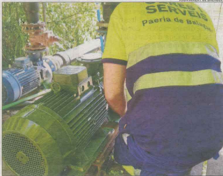
Un operari municipal treballa amb una de les bombes avariades.

El tall, ratificat de facto pel jutjat de guàrdia de Balaguer al rebutjar les mesures cautelars per reprendre el subministrament que havia plantejat la Paeria, va obligar el consistori a recuperar el proveïment al-