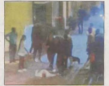
La baralla, ja al carrer.