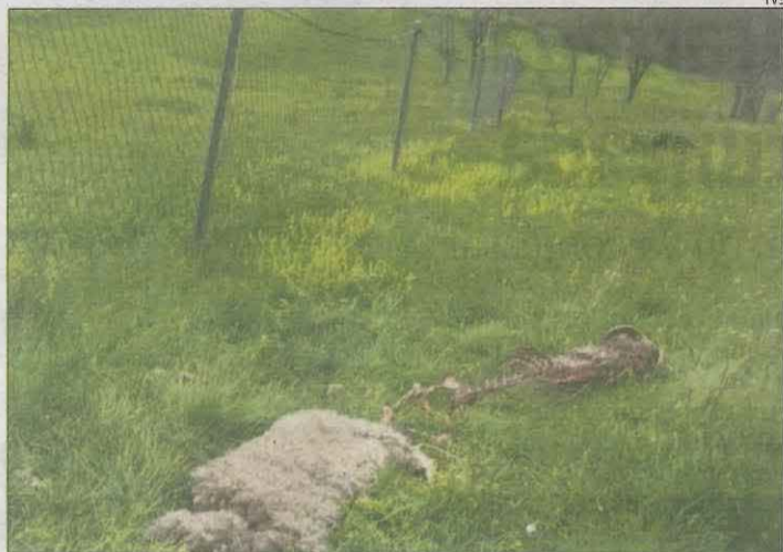
L'os va saltar un camp clos electrificat d'1,5 metres.