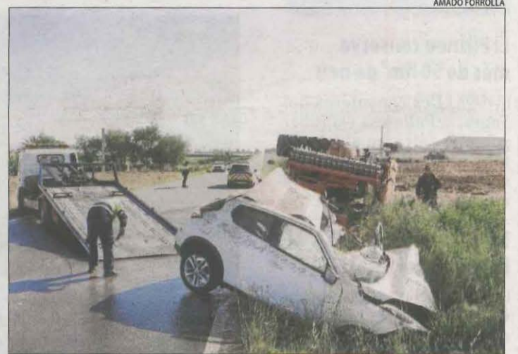
Imatge del cotxe i del tractor, que va acabar bolcant.