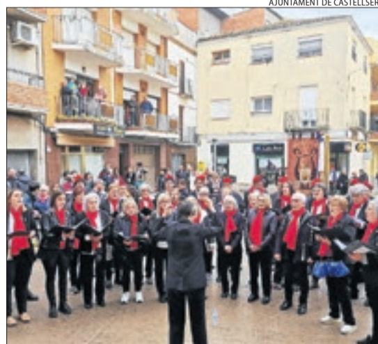
A Castellersà, amb la Coral Flors d'Urgell.