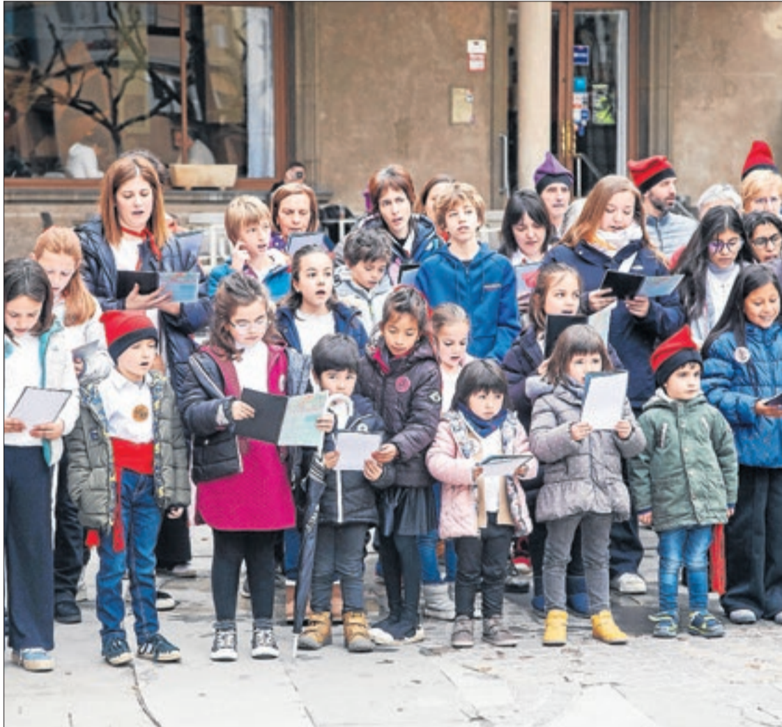
La Coral Infantil Nova Cervera, durant l'actuació a la capital de la Segarra.