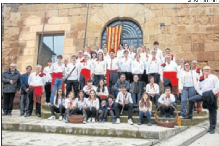
Ponts és una de les localitats fidels a la tradició.

43. A Cervera, va estar organitzada per la Coral Infantil Nova Cervera. La Massa Coral Els Cantaires de Juneda també va sortir al carrer. A Salàs de Pallars, on fa més de 120 anys que se celebren, hi va haver un nombrós públic. També n'hi va haver a Guissona, Artesa de Segre, Ponts i Organyà, entre altres localitats.