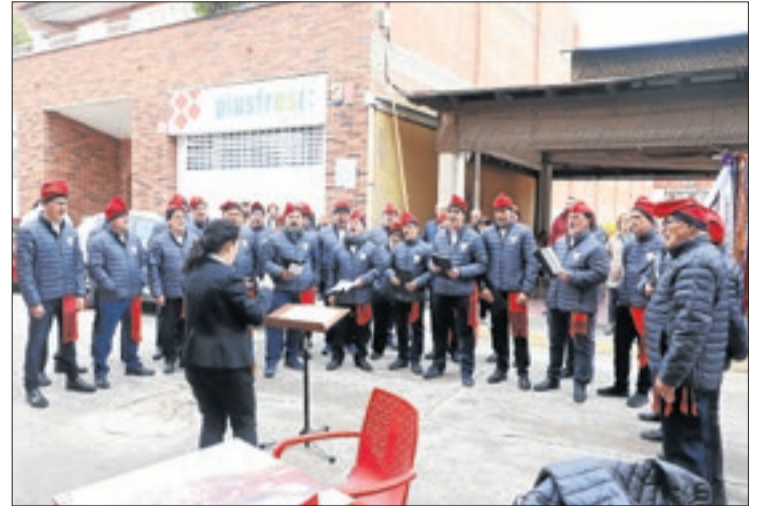
La Massa Coral Els Cantaires de Juneda.