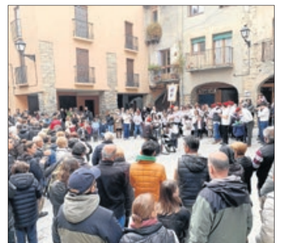
Nombrós públic a Salàs de Pallars.