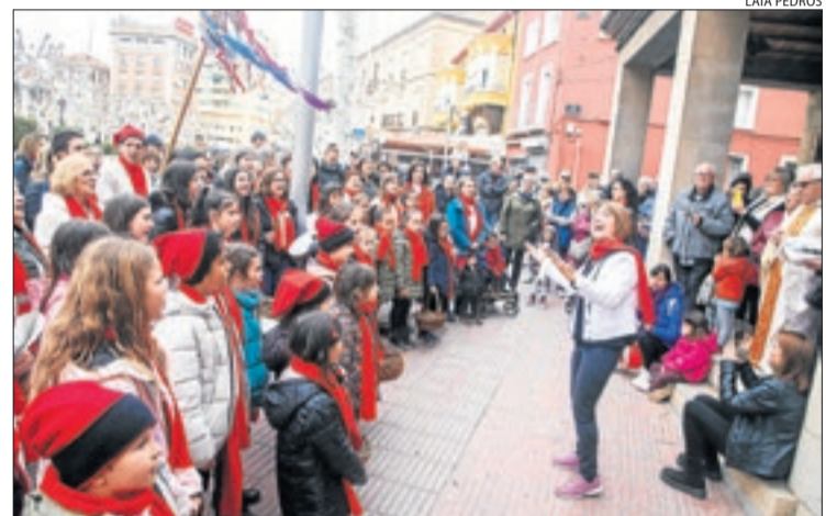
A Tàrrrega són a càrrec de la Coral Infantil Mestre Güell.