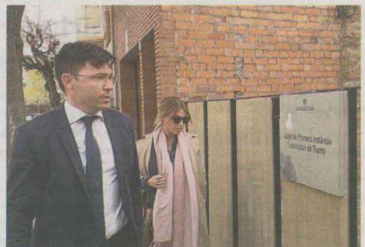
L'acusació particular entrant dilluns als jutjats

en les seves. Dues d'elles van manifestar que els seus familiars eren diabètics i que no els hi van donar la medicació corresponent ni tampoc aliments tot i ser dependents. Divendres declararan més familiars i el dilluns 15 estarà previst que ho facin treballadors.