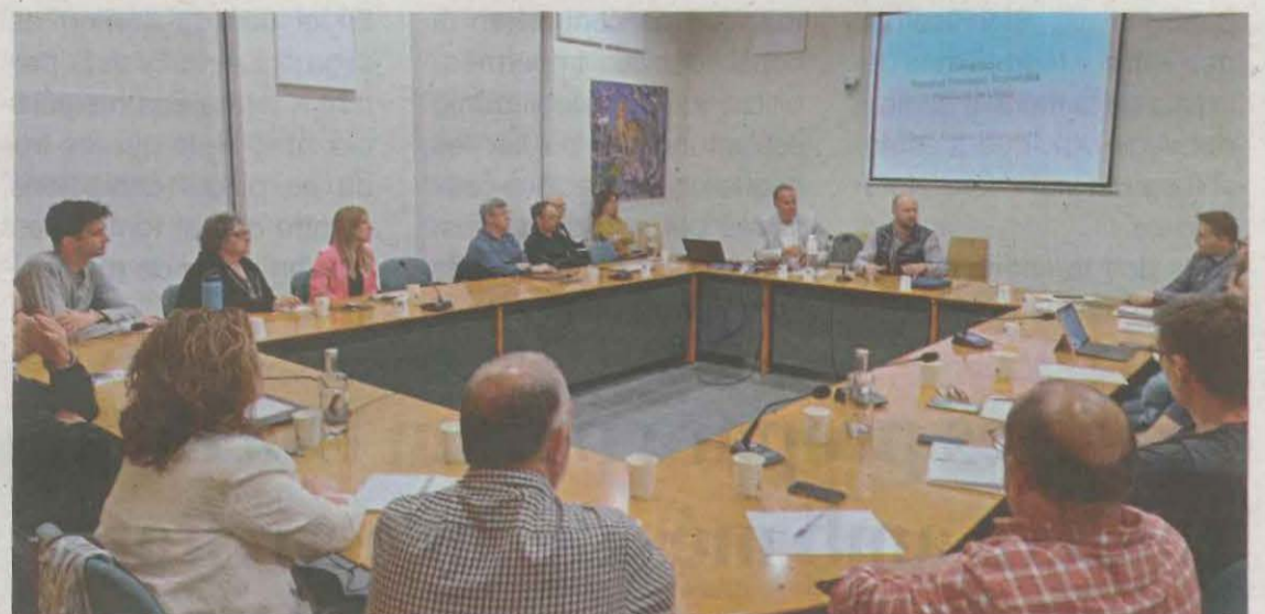
Trobada del Consell d'Alcaldies celebrat al Consell Comarcal del Jussà

Plaja va afegir que, sense pressupostos, la partida per al curs vinent serà de 50