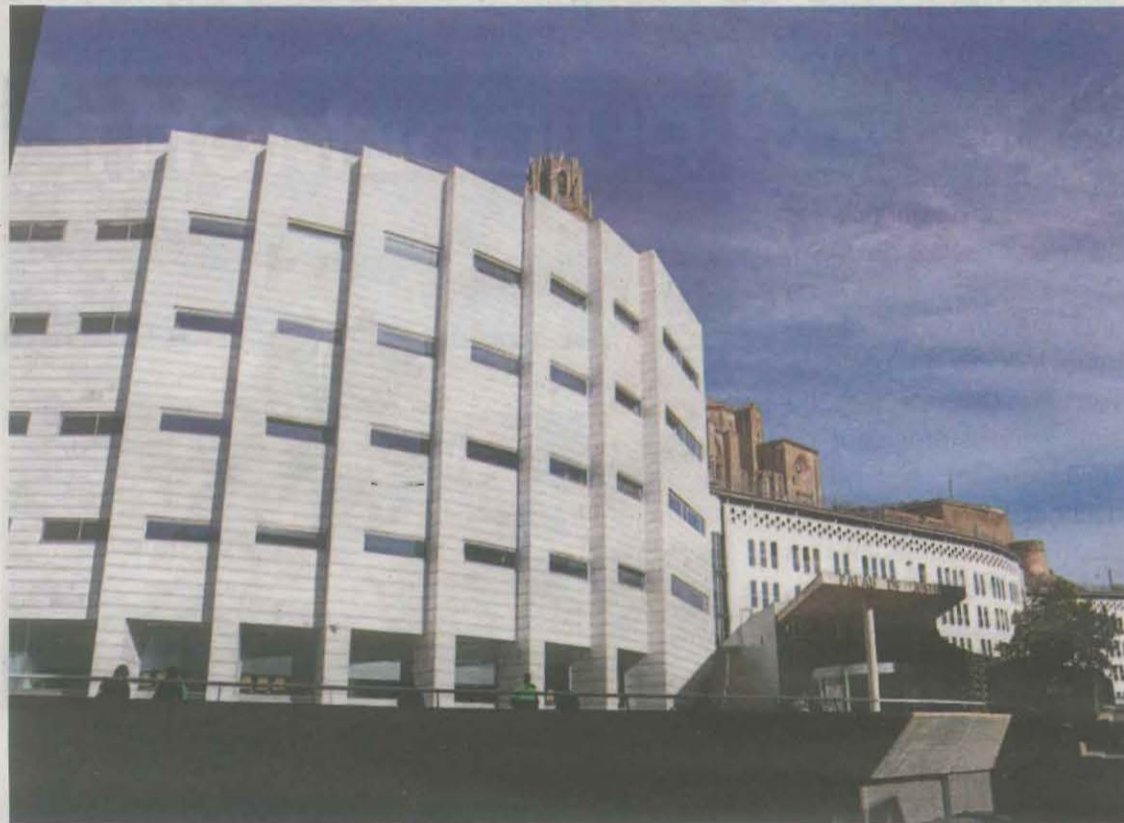
L'Audiència Provincial de Lleida acollirà el judici el dijous dia 18

Segons el ministeri públic, cap a les 21.00 hores del 3 de març de 2021, els dos dels acusats, juntament amb una tercera persona que no ha estat identificada, van quedar amb la víctima (un home) en un punt del Pla d'Urgell i després de discutir la van fer pujar contra la seva voluntat a un vehicle, propietat de la dona acusada, i van anar a un magatzem de les Garrigues. Allà la van lligar