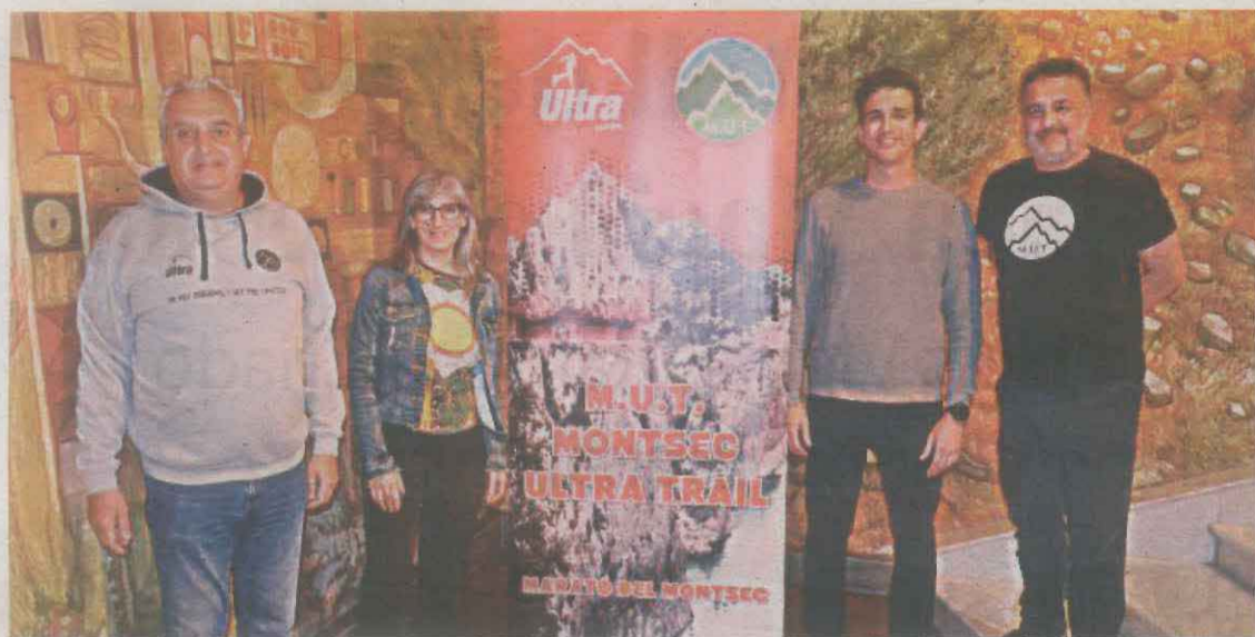
Presentació de la prova atlètica de muntanya