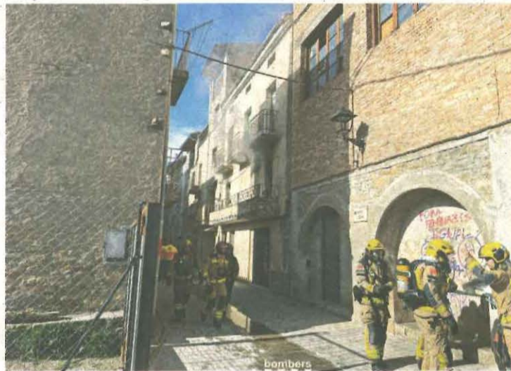
Moment en què els serveis d'emergències es trobaven a l'exterior de la casa unifamiliar

Pel que fa als fets, a les 9.11 hores emergències van rebre l'avís d'un foc en una casa unifamiliar situada al Carrer d'Oran de la capital del Pallars Jussà. Ràpidament, es van mobilitzar un total de set dotacions terrestres dels Bombers: una