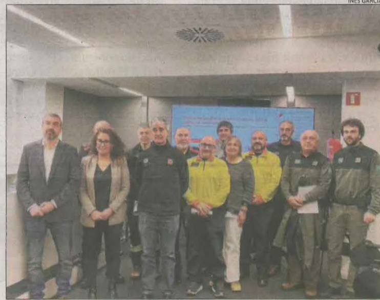
Acte de presentació de les dades del 112 a Lleida.

La majoria de trucades es van registrar per Sant Joan, Cap d'Any i el temporal de finals de juny