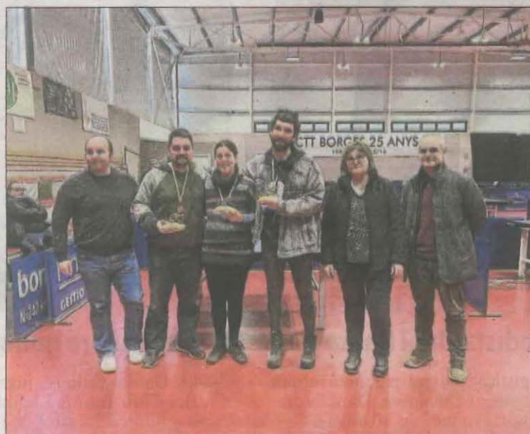
A la imatge, l'acte de l'entrega de premis.