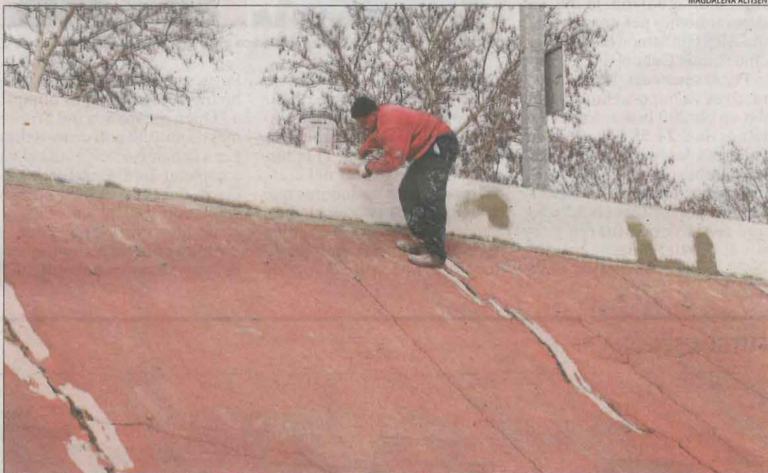
El mur interior s'està pintant amb una primera capa abans d'aplicar la definitiva de color mostassa.