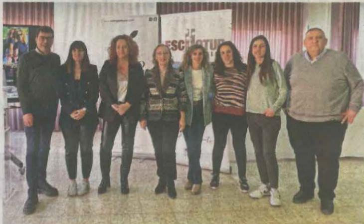
La campanya es va presentar ahir a l'Escola d'Hoteleria i Turisme de Lleida