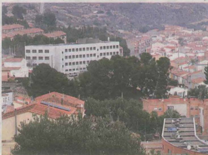
Vista panoràmica del poble de Mequinensa, que es troba a la comarca del Baix Cinca

La moció també reclamava al Govern d'Aragó agilitzar els tràmits per a la seva obertura i ampliar l'oferta educativa de Formació Professional per formar persones en àrees