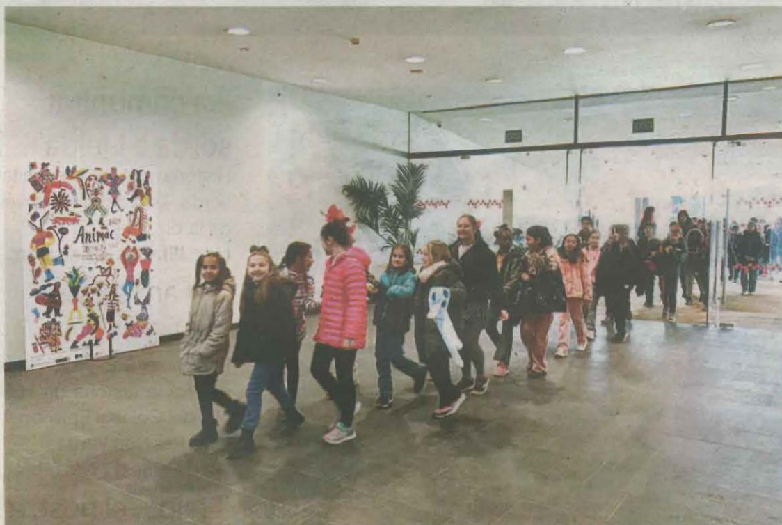
Els primers grups d'alumnes lleidatans arribant a la Llotja