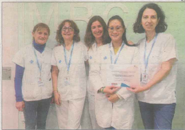
L'equip de la unitat de l'hospital Arnau de Vilanova.