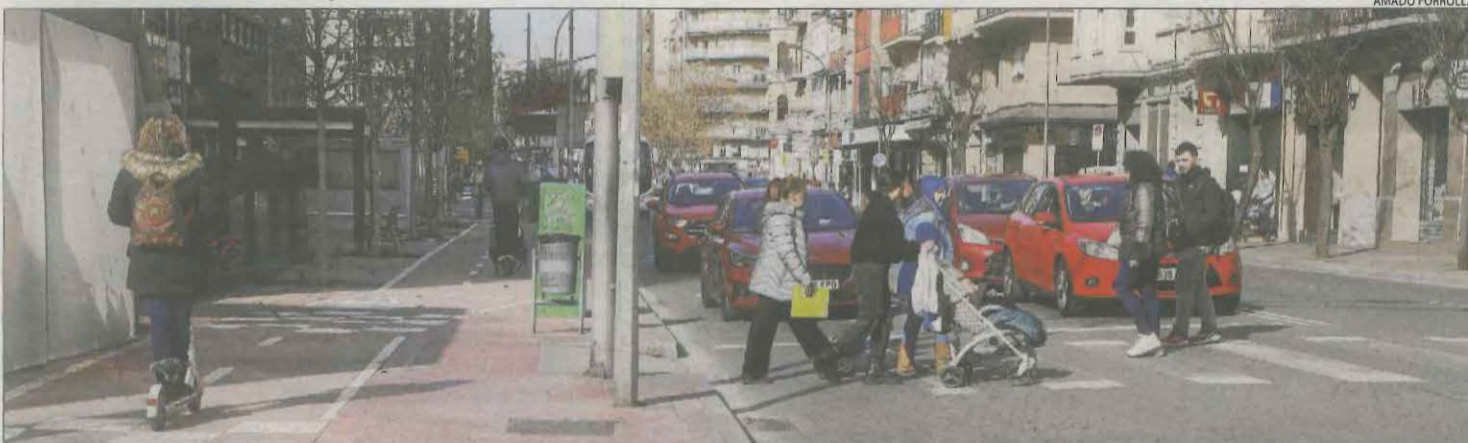
EL 50% DE LLEIDATANS ES DESPLACEN PER LA CIUTAT A PEU, EN BICI O PATINET