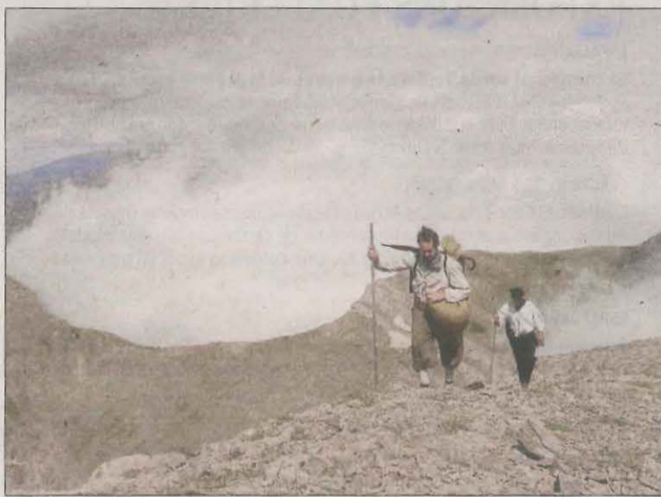
Una de les escenes del film, en l'ascens al Cadí, a l'Alt Urgell.