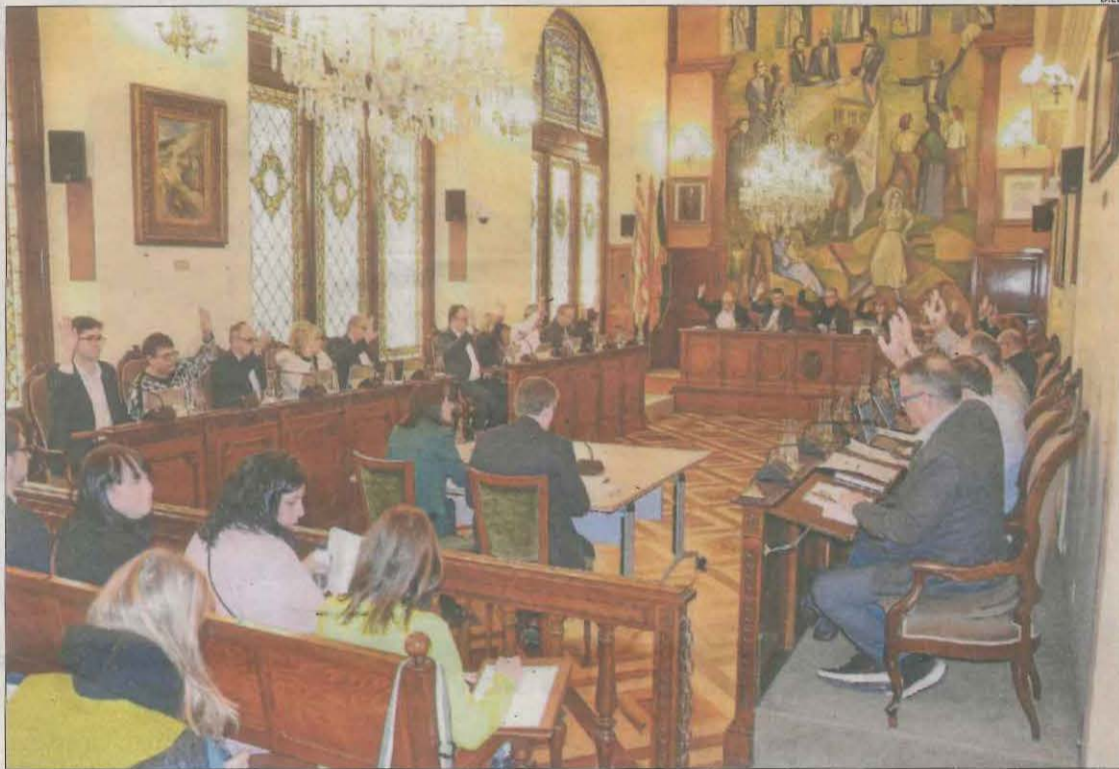
El pla de cooperació i la moció sobre contractes menors es van aprovar per unanimitat.

Amb el mateix objectiu d'agilitzar els processos públics, encara que a través d'una moció, el ple va aprovar una moció d'Ara Pacte Local perquè el Parlament impulsi una modificació legal que possibiliti que els contractes menors que firmen els ajuntaments, ara limitats a 15.000 euros i 40.000 euros a l'any (segons si són per a serveis o obres), puguin allargar-se per