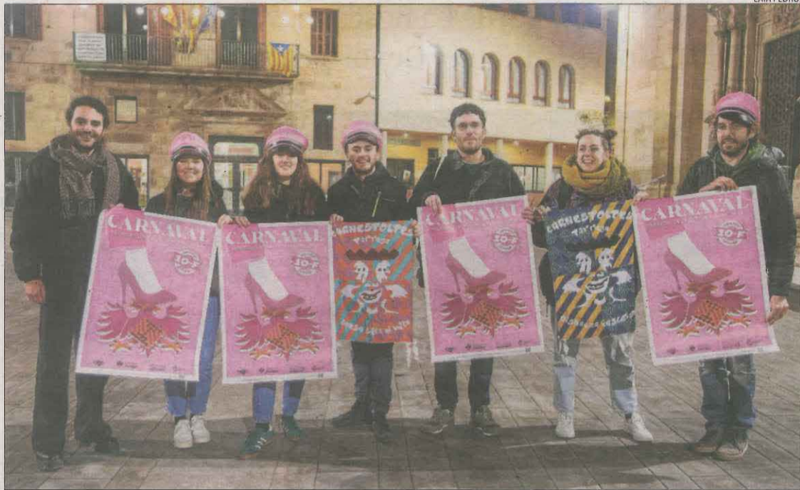
Presentació dels actes del Carnaval a Tàrrega ahir a la plaça Major.

L'apartat infantil estarà liderat un any més per Cruma i protagonitzat per quart any consecutiu per la Toltes. Entre