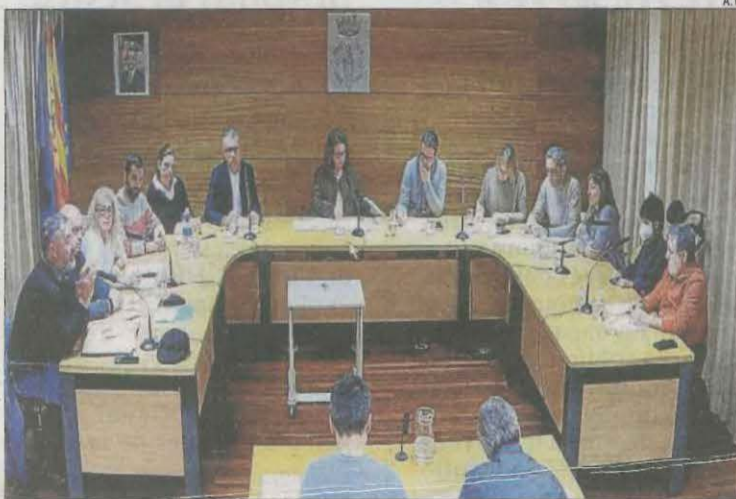
imatge del ple d'ahir de Tremp.

que actuaran en les captacions de vuit pobles del municipi. Romero va apuntar que demanaran un crèdit d'uns 292.000 euros per finançar aquesta úl-