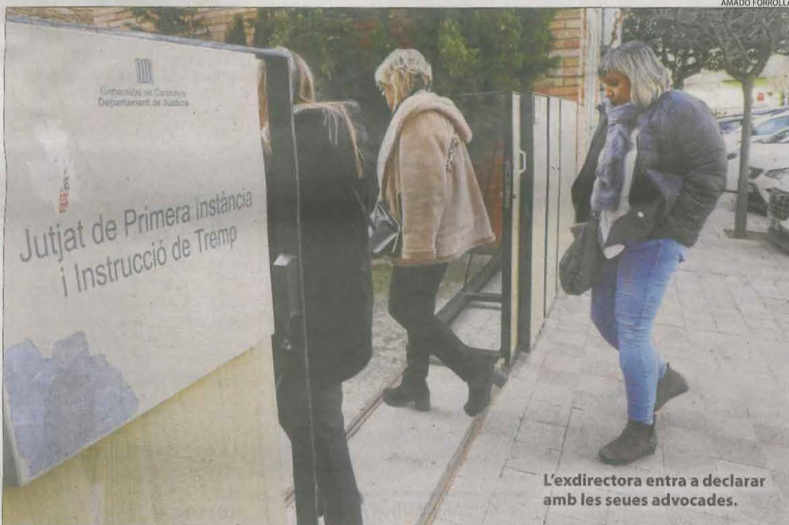
L'exdirectora entra a declarar amb les seues advocades.

Les tres regidores d'ERC i l'únic edil de l'Aliança Catalana de Sílvia Orriols a Ribera d'Ondara negocien una moció de censura per desbancar l'actual alcalde socialista, que governa en minoria.