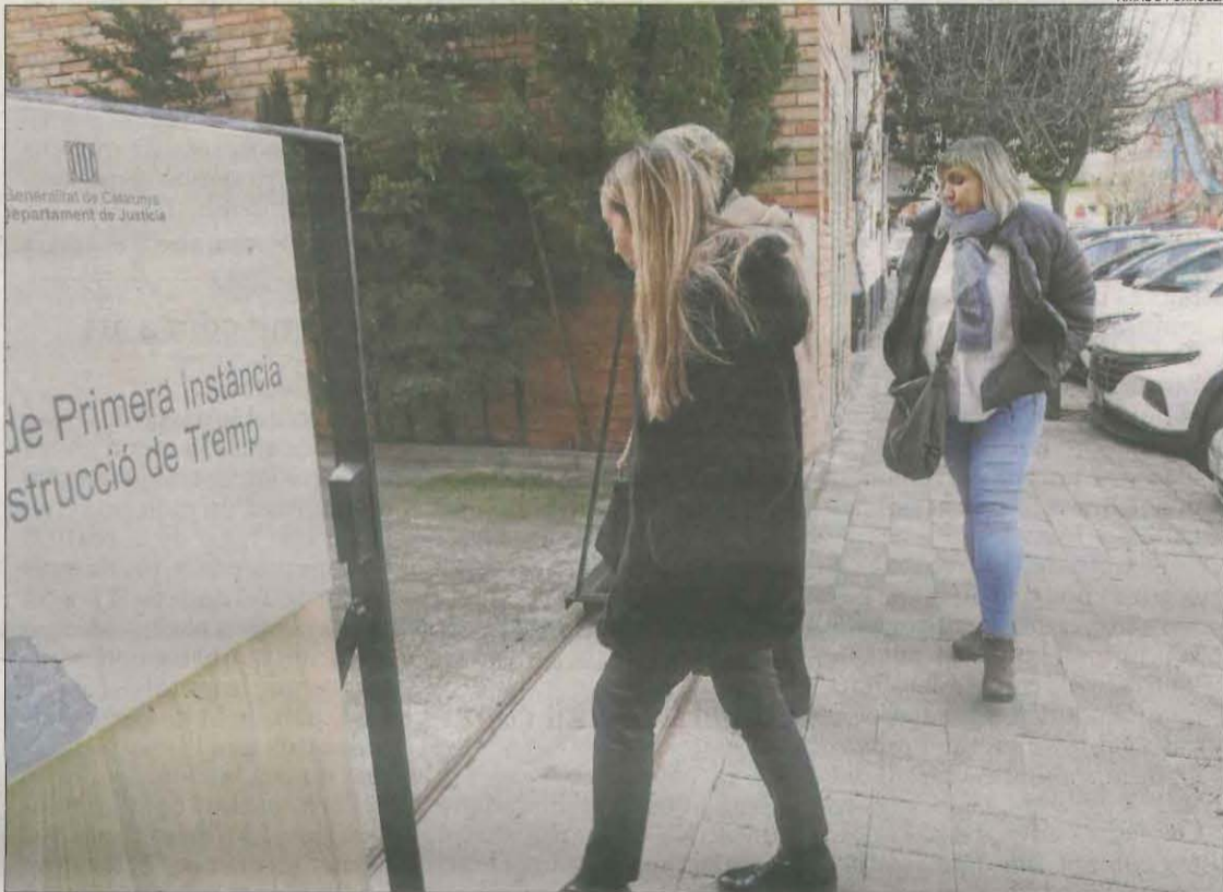
L'exdirectora, darrere de les seues lletrades, va declarar ahir per primer cop davant del jutjat de Tremp.