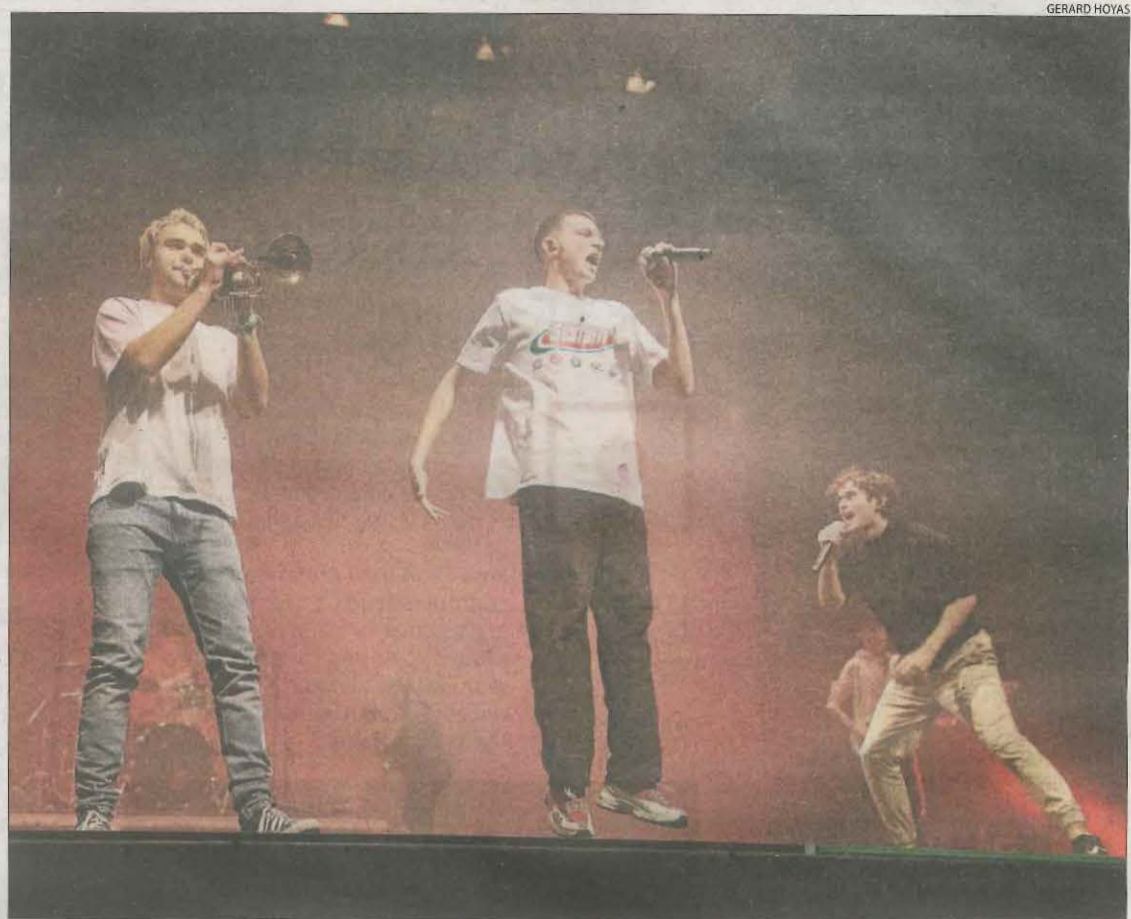
El grup Sexenni va nèixer el 2019 i està format per sis joves. A la foto, actuant a Lleida.