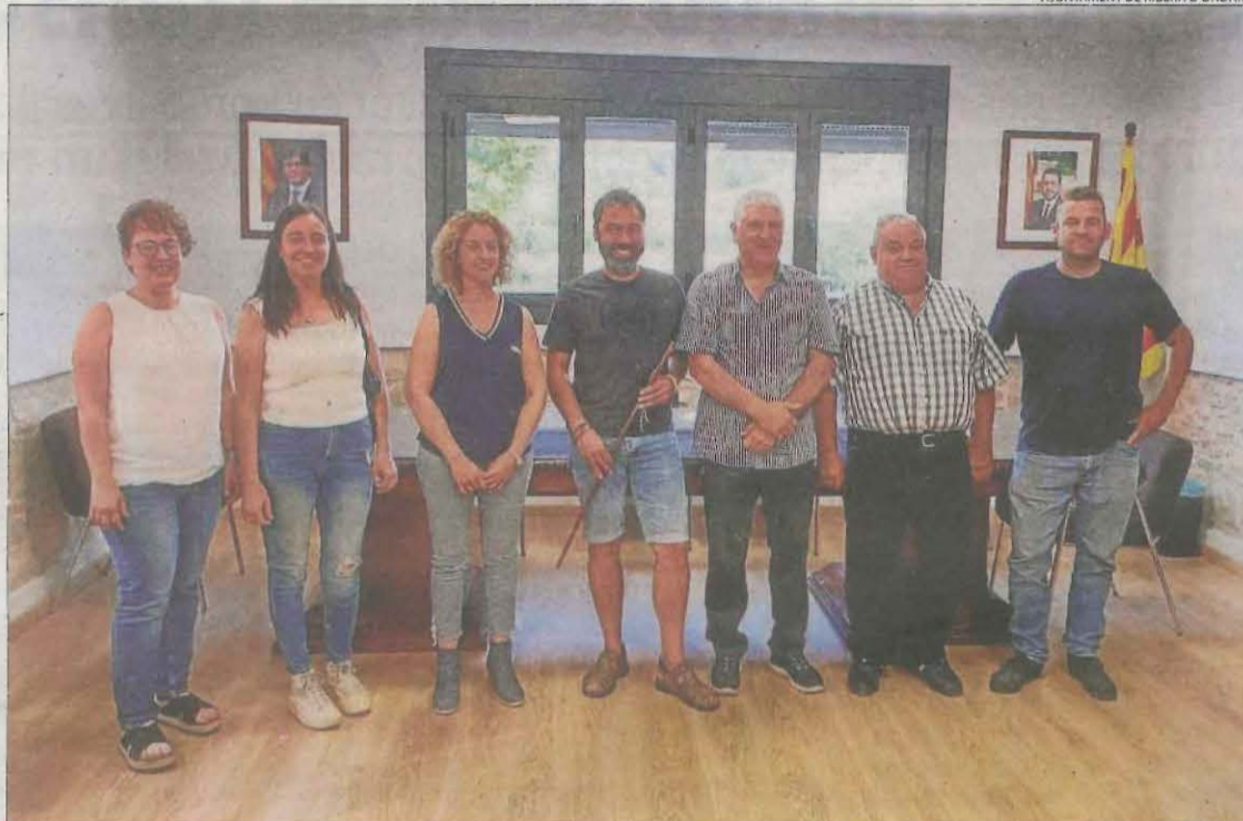
El consistori de Ribera d'Ondara, on els socialistes governen ara en minoria.