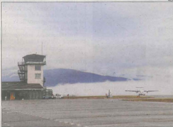
L'arribada del primer avió de Palma a la Seu divendres passat.

Les mateixes fonts van assenyalar que aquests últims necessiten una màquina diferent, encara que "no és necessària" per als trajectes actuals de Madrid i Palma, per la qual cosa es desconeix la causa per la qual l'aparell no tenia prou