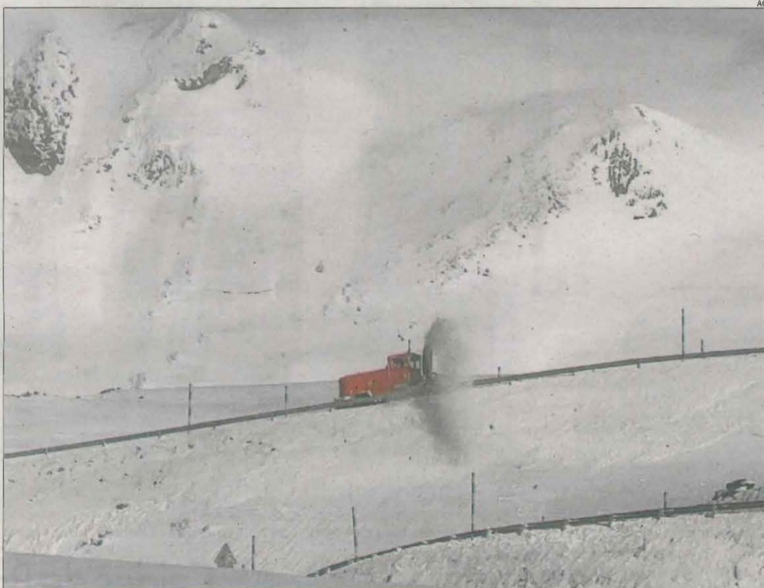
Una màquina llavanou treballant ahir al port de la Bonaigua.

Per a demà es preveuen nevades en cotes superiors als set-cents metres i que podrien arribar a la Segarra i a la Noguera. Protecció Civil té activada la prealerta del pla Neucat. També s'esperen més precipitacions al pla de Lleida.