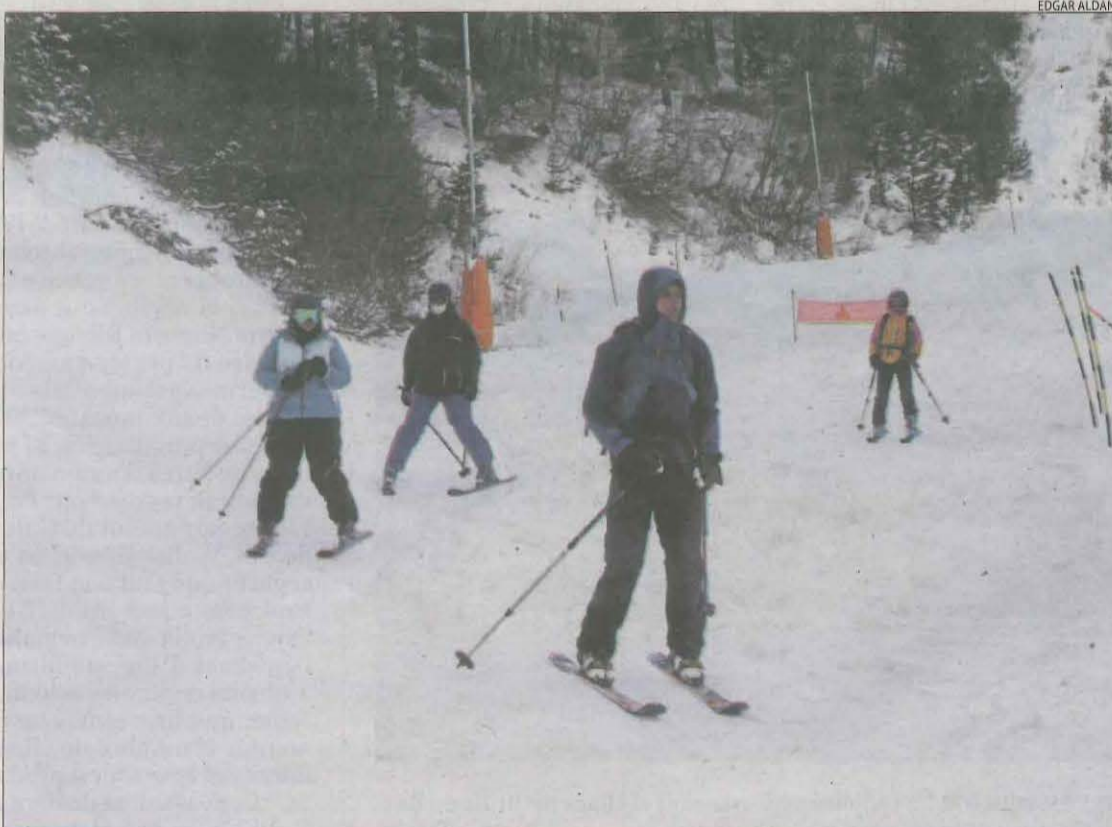
Imatge d'esquiadors a Espot diumenge.