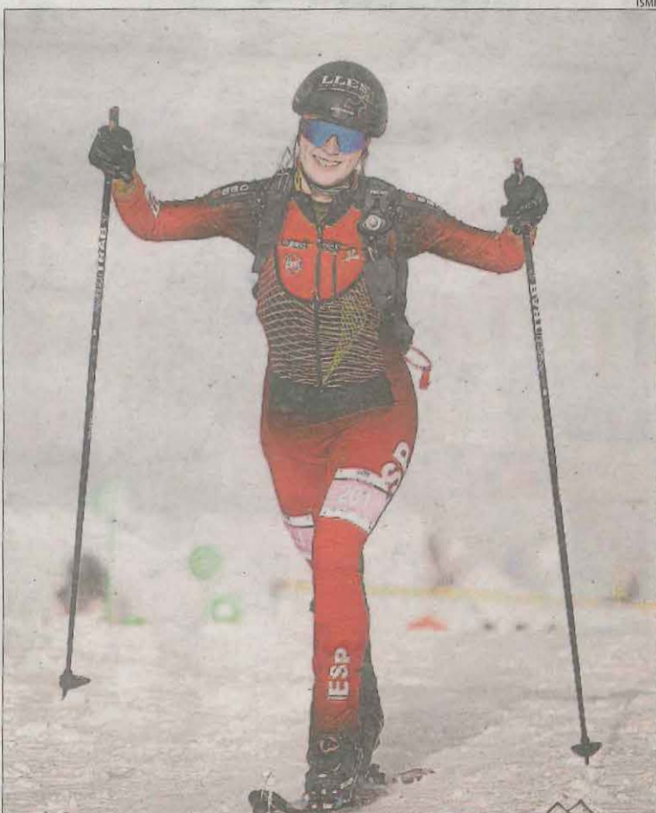
L'esquiadora de Lles va gaudir durant tot el recorregut.