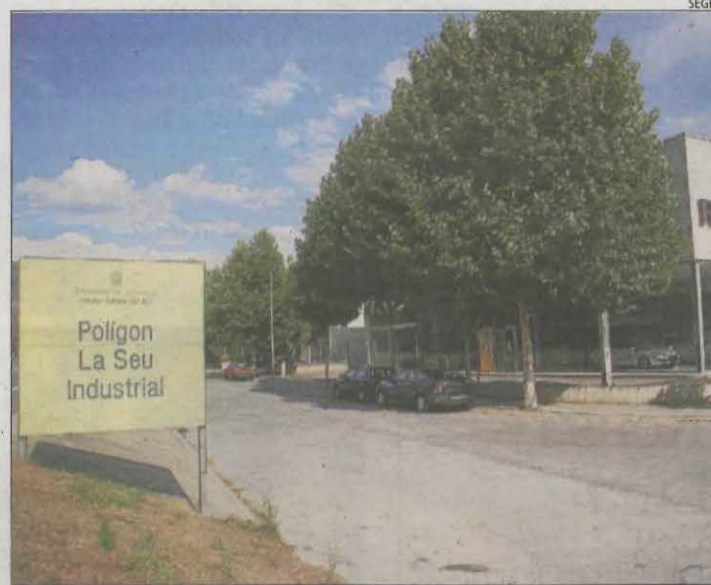
Imatge d'arxiu del polígon La Seu.