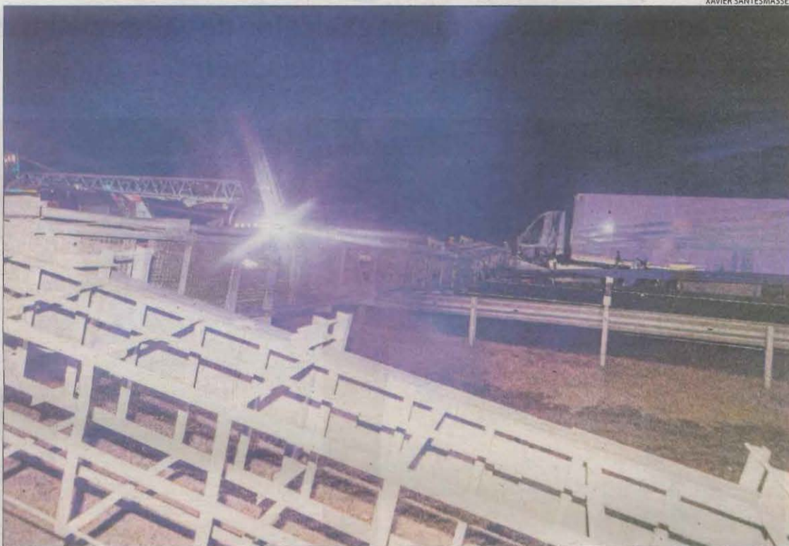
L'estructura metàl·lica va caure sobre la carretera després de xocar el camió, al fons de la imatge.

El conductor va quedar atrapat a la cabina i va haver de ser rescatat pels Bombers