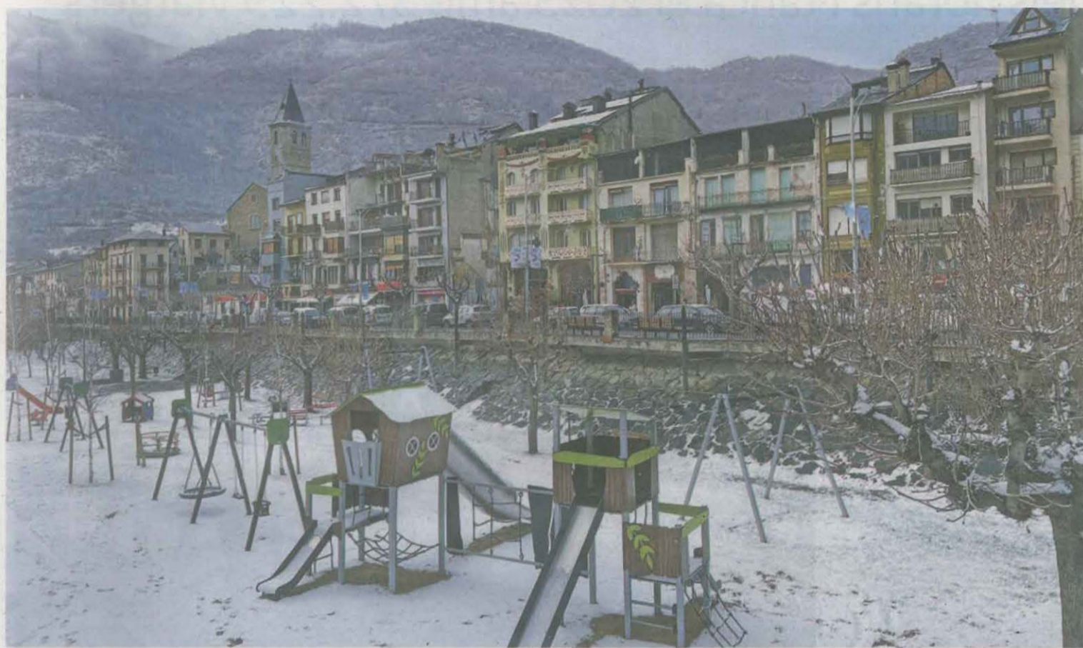
El Parc del Riu de Sort emblanquinat ahir al migdia

Els gruixos van ser escassos als dos Pallars i a l'Alt Urgell i no es van registrar problemes greus per circular per les carreteres