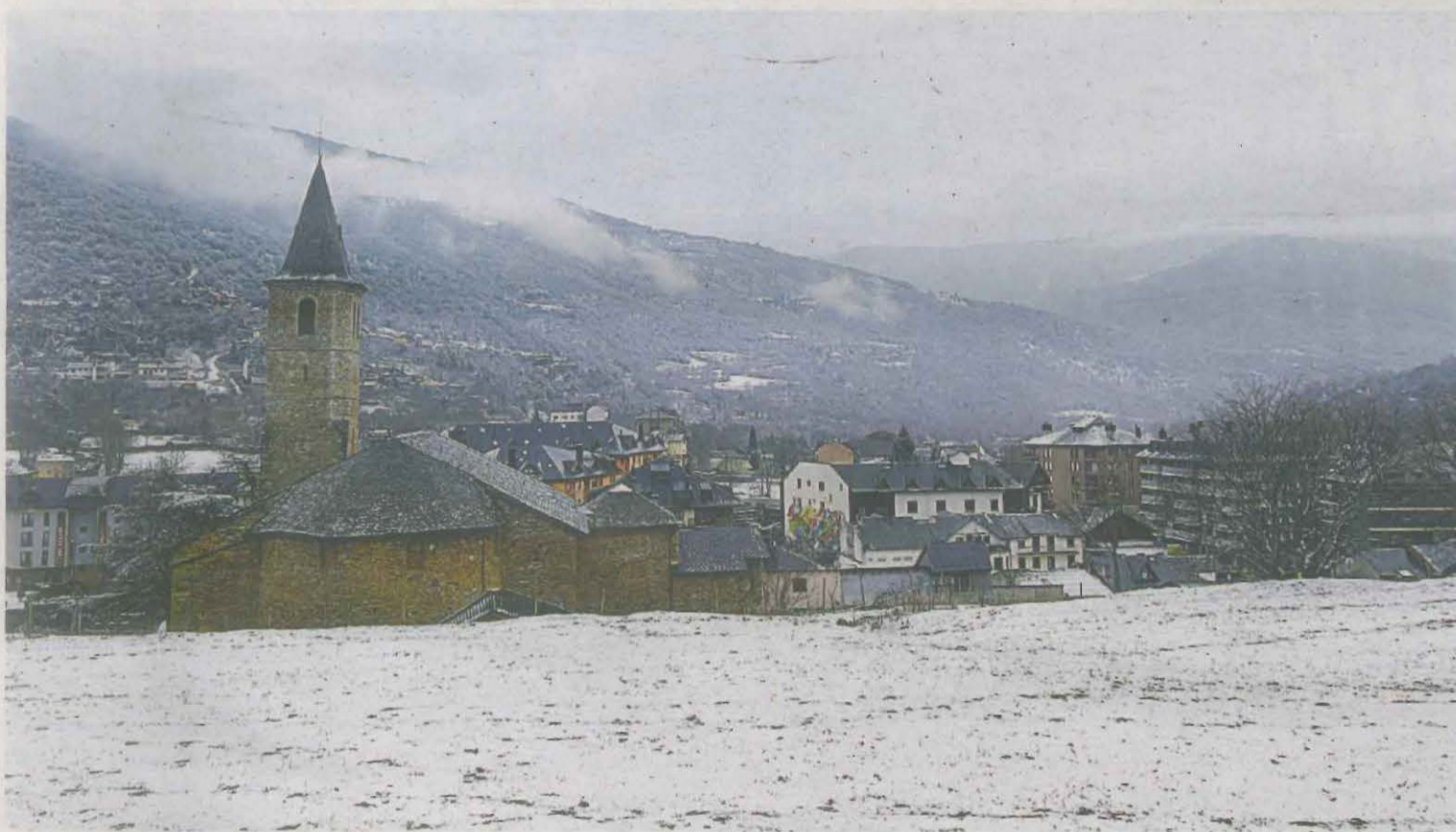
Una panoràmica de Sort, la capital del Pallars Sobirà, emblanquinada ahir per la neu

Les de l'Alt Urgell es van veure superades per l'Uni Girona (52-68), que agafa un clar avantatge per a la tornada dels vuitens de l'Eurocup. _P.23