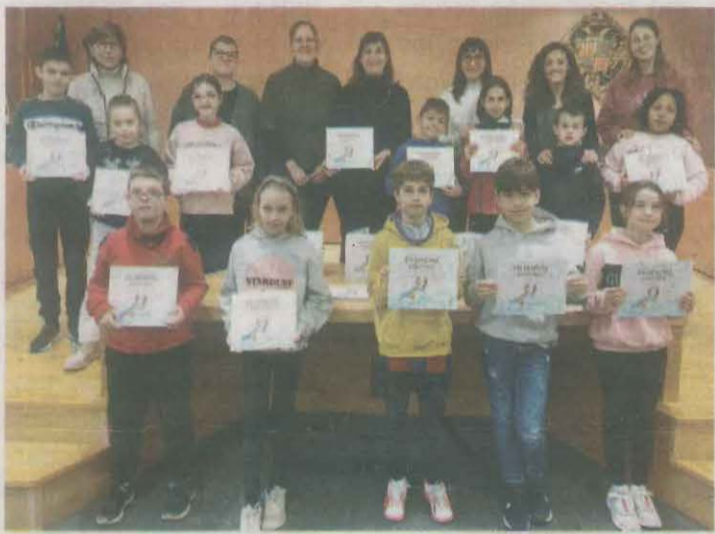
FOTO_Aj. Tàrrega Acte de lliurament del conte a alumnes de centres escolars de Tàrrega

ments de la comarca. El Consell Comarcal destaca entre les actuacions del projecte, la substitució de 2.910 punts d'enllumenat públic a tecnologia LED amb una previsió d'estalvi energètic del 50% en consum (kwh) en un total de 17 municipis.