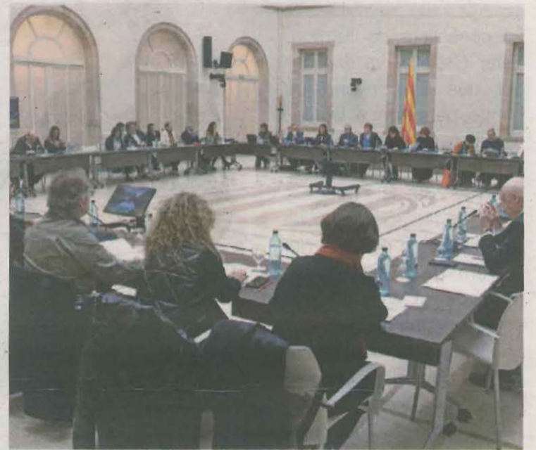
Reunió del plenari, ahir al Parlament

Pel que fa a altres capitals de la demarcació de Lleida, l'estudi mostra una millora dels nivells de segregació la majoria de municipis. En aquest sentit, la ciutat de Mollerussa passa del 20 al 17%; Cervera del 19 al 7%; Balaguer del 17 al 10%; Tàrrega del 18 al 4%; la Seu d'Urgell del 19 al 12% i Solsona del 14 al 10%. Per contra, a les Borges Blanques ha augmen-