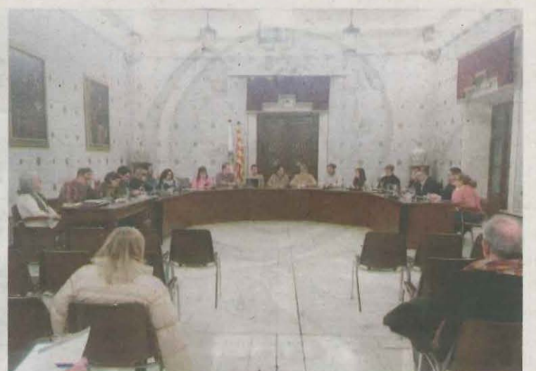
Un moment de la celebració del ple de pressupostos de l'Ajuntament de la Seu

Tot i l'evolució favorable que mostra l'estudi a la ciutat de Lleida, la capital del Segrià es troba entre els trenta municipis de més de 5.000 habitants amb nivells de segregació més elevats a primària.