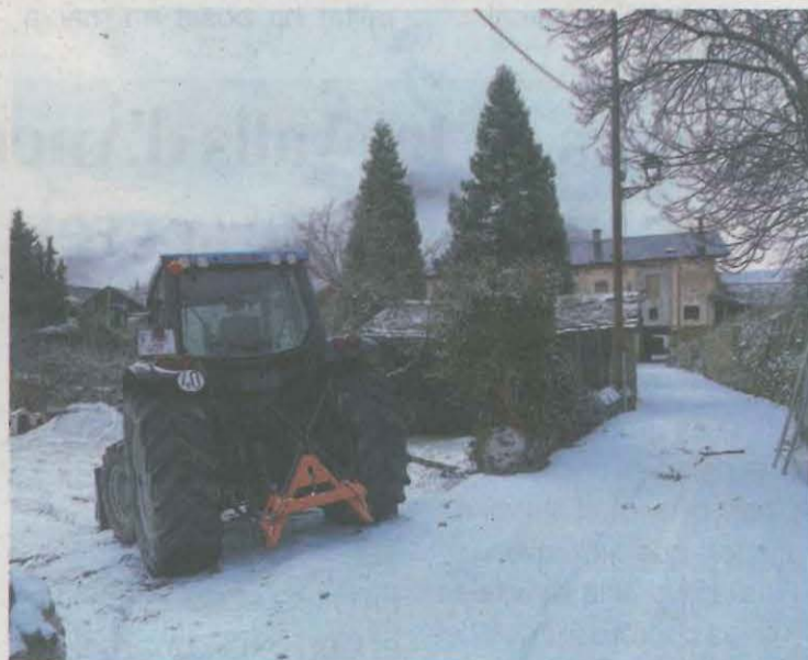
Un tractor presideix un carrer d'un poble del municipi de Sort, al Pallars Sobirà, nevat