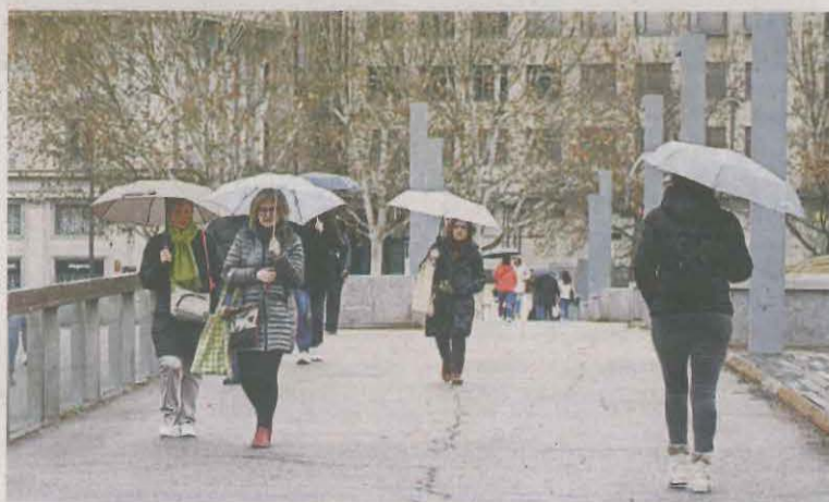
Els paraigües es van obrir ahir a Lleida

llars Jussà o l'Alt Urgell, si bé amb gruixos petits i sense problemes a les carreteres. A la Plana, va arribar la pluja amb quantitats que van ser poc abundants. P.13