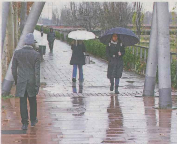
La pluja va aparèixer a la ciutat de Lleida, on es van acumular poc més de 5 mm

Per avui, el Servei Meteorològic de Catalunya (Meteocat) preveu alguns núvols amb pluja sobretot a les comarques del nord-est i la cota de neu se situarà als 800 metres.