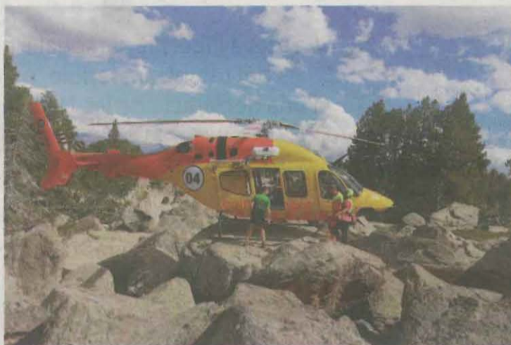
Un helicòpter dels Bombers de la Generalitat durant un rescat realitzat al Pirineu

■ Els rescats van augmentar un 14,14% en un sol any