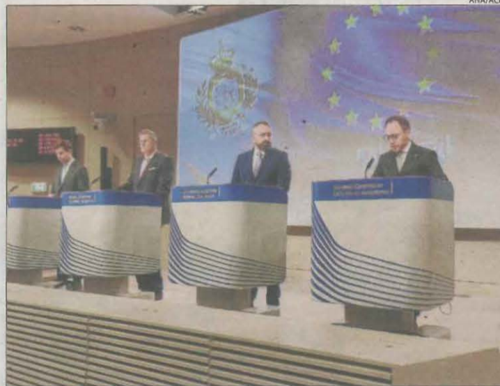
Xavier Espot (dreta) en roda de premsa ahir a Brussel·les.

| ANDORRA LA VELLA | Andorra ha conclòs la negociació de l'acord d'associació amb la UE, i els andorrans hauran de ratificar-lo a les urnes a finals de l'any que ve. Així ho van anunciar ahir el Govern del Principat i la Comissió Europea en una roda de premsa conjunta a Brussel·les. Una vegada pactat el contingut de l'acord, ambdós parts redactaran el document final que es votarà en un referèndum vinculant. El cap de Govern andorrà, Xavier Espot, va avançar que l'Executiu que presideix treballarà des del gener per aconseguir un "sí rotund" (vegeu el desglossament). L'associació amb la UE implicarà participar gradualment al mercat comunitari, una vegada Andorra superi una auditoria en qüestions com la lluita contra el blanqueig de capitals, educació i polítiques socials. El sector financer tindrà 15 anys per adaptar-se a la normativa comunitària, mentre que el de les telecomunicacions disposarà de 7 anys per eliminar el roaming. Els andorrans tindran cobertura sanitària a la UE i el sistema migratori se simplificarà amb tres categories (treballadors actius, passius i temporers) i percentatges mínims de personal comunitari, segons va publicar el Diari d'Andorra .