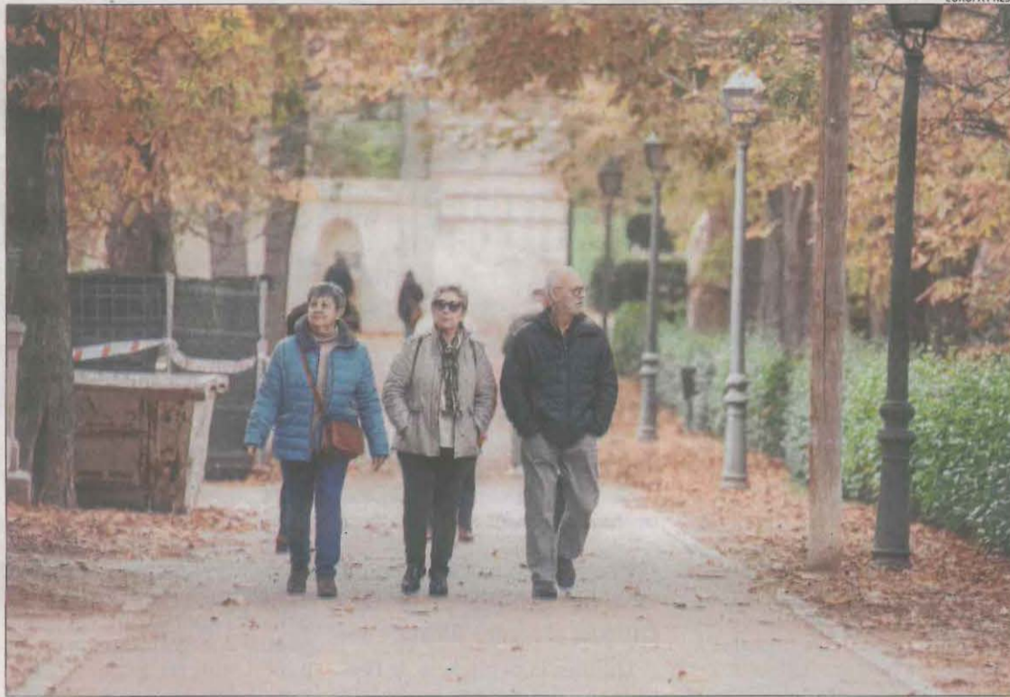
Unes persones en edat de jubilació passegen per un parc en una típica imatge tardoral.

La segona pota de la reforma de pensions, aprovada al març d'aquest any i centrada en l'obtenció d'ingressos per garantir la sostenibilitat del sistema, contemplava millores també a les pensions mínimes contributives. En concret, la norma estableix que aquestes experimentaran, des del 2024 i fins al 2027, una pujada progressiva superior a l'IPC per assegurar que al final de l'esmentat període no siguin inferiors al llindar de la pobresa calculat per a una llar composta per dos adults. La inflació mitjana del període de desembre del 2022-novembre del 2023 es va situar, a falta de confirmar-se la dada avançada, en un 3,8%, per la qual cosa tota pujada que superi aquest percentatge anirà pel camí marcat per la reforma. Serà precisament en aquest percentatge, el del 3,8%, en el qual pujaran les pensions contributives l'any que ve, en funció de la reforma que es va aprovar