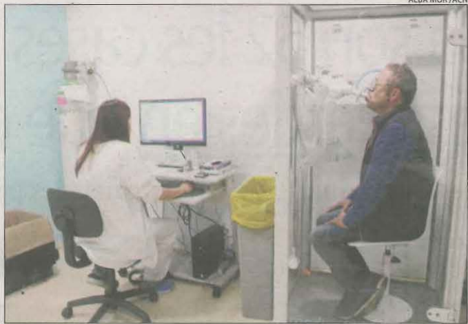
Un pacient sotmetent-se a una prova a la nova consulta.