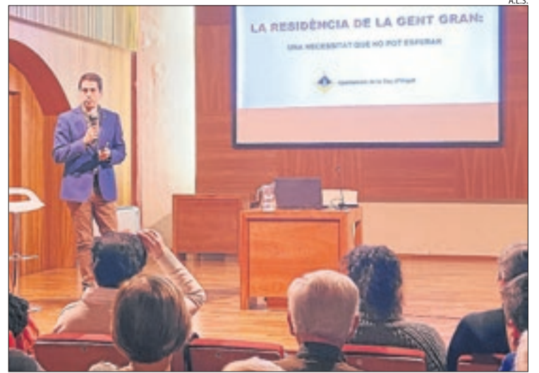
L'ajuntament va presentar ahir l'avantprojecte als veïns.

Caser d'Oliana unes altres 93. La de la Seu tindrà també dotze pisos assistits i quaranta places de centre de dia, que comptarà amb tres sales polivalents i una sala de descans per a 40 usuaris. Hi haurà un pàrquing amb 23 places i el cost s'acostarà als 14 milions.