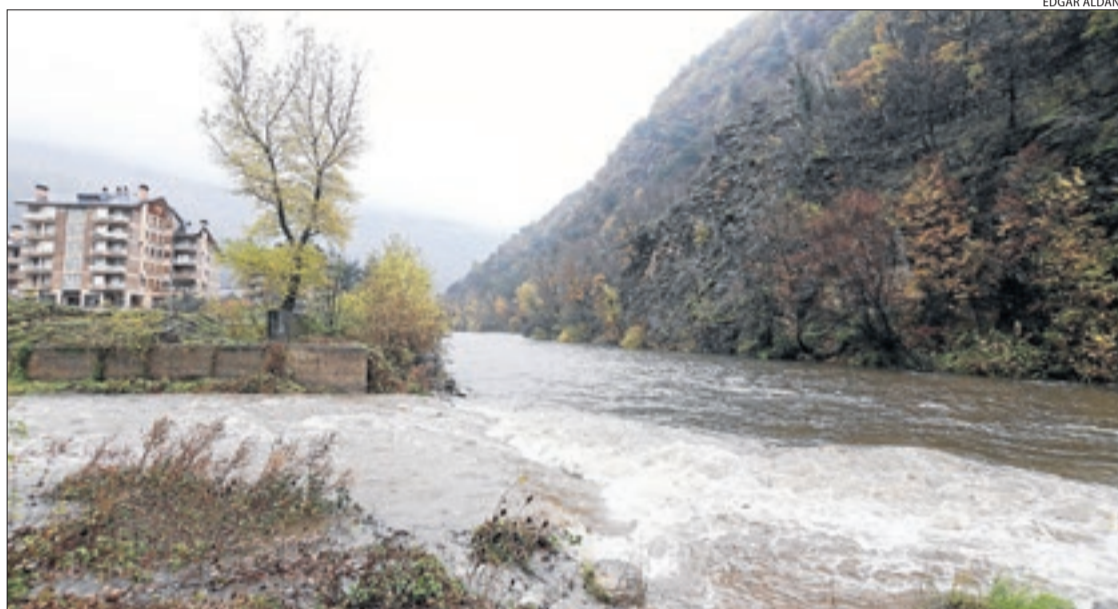
El torrent de Sant Antoni desembocant a la Noguera Pallaresa a Rialp.

d'avui, igual com les temperatures, de manera que les pistes d'esquí podran recuperar grui-xos perduts.