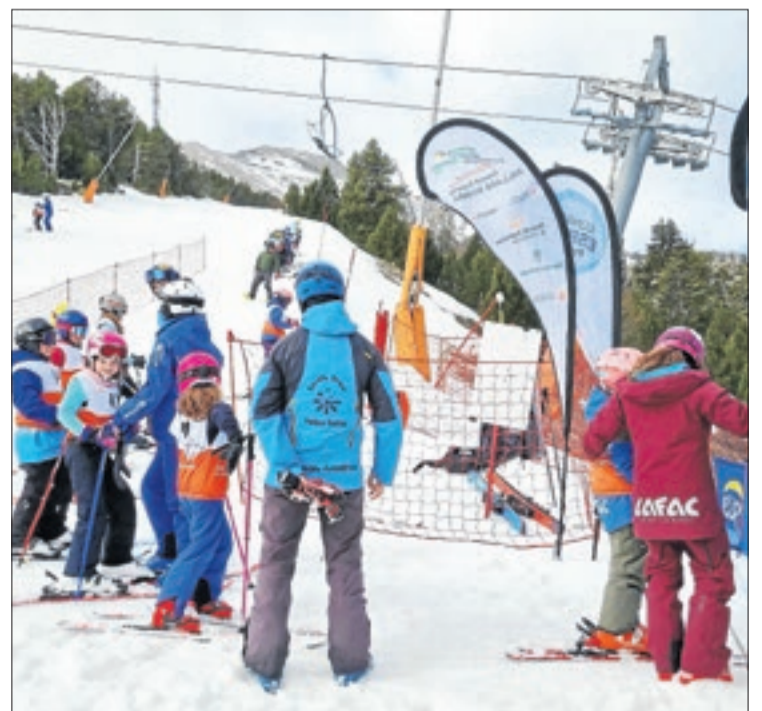
CONSELL ESPORTIU PALLARS JUSSÀ

Estades nàutiques a l'estiu i esports de neu a l'hivern destaquen al seu calendari