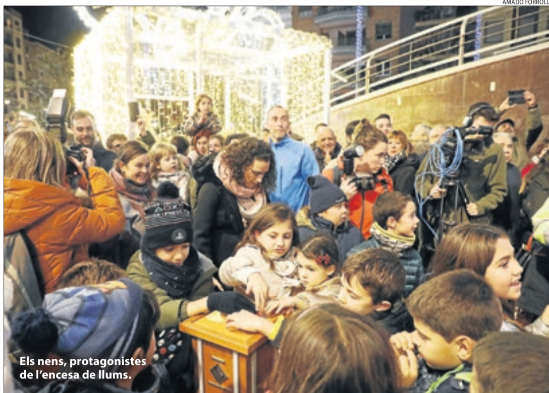
Els nens, protagonistes de l'encesa de llums.