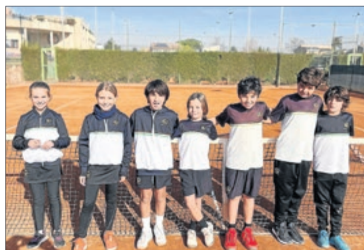
L'equip A del CT Lleida, guanyador del grup Ronald McDonald.

Tornant a la Festa de Cloenda, aquesta se celebra cada final