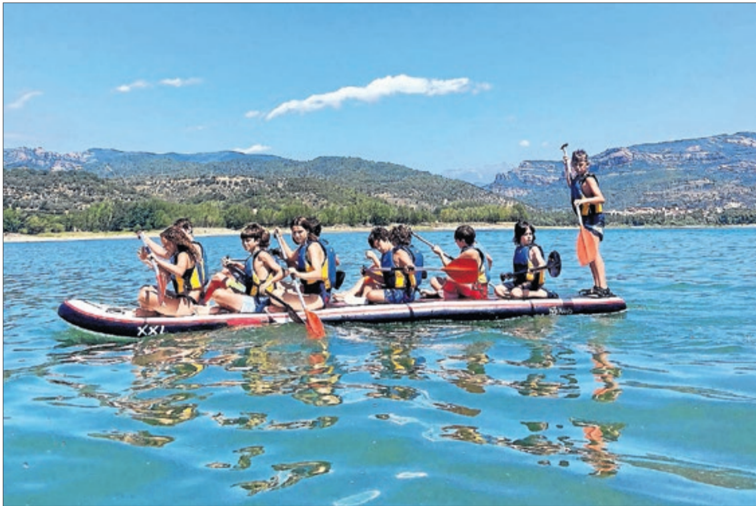
CONSELL ESPORTIU PALLARS JUSSÀ

Les estades nàutiques de l'estiu a l'embassament de Sant Antoni són una de les activitats més singulars d'aquest consell.