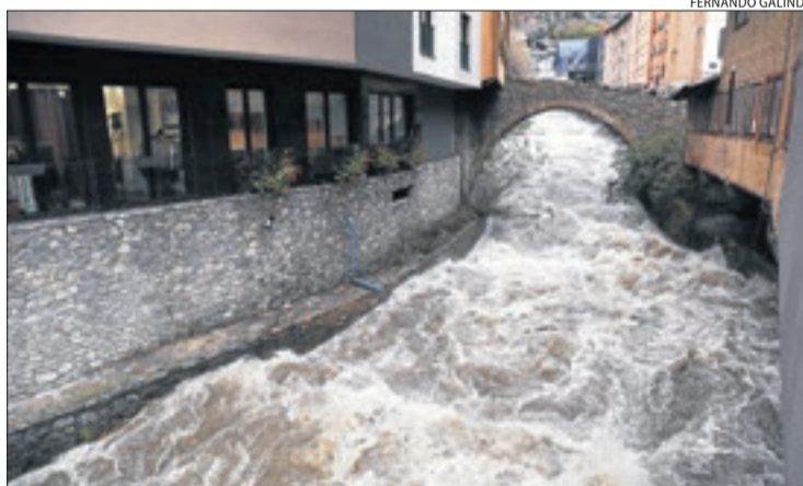
El riu Valira al seu pas per Andorra.