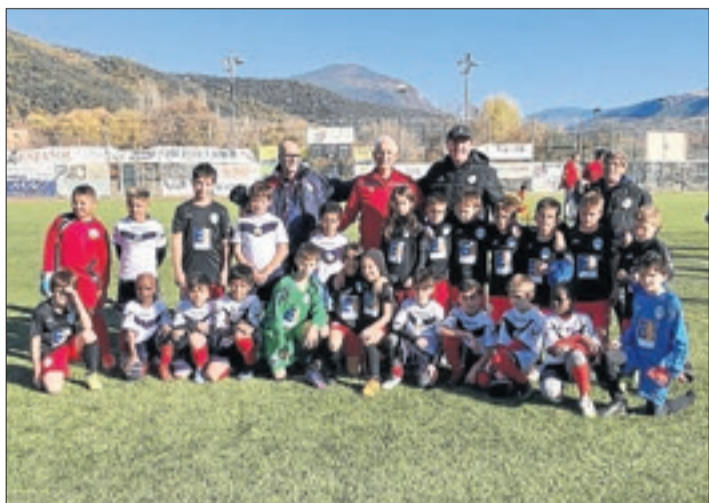
Alguns dels equips participants.

La notícia de la Campanya 'Animar no és corregir', a Lleida TV