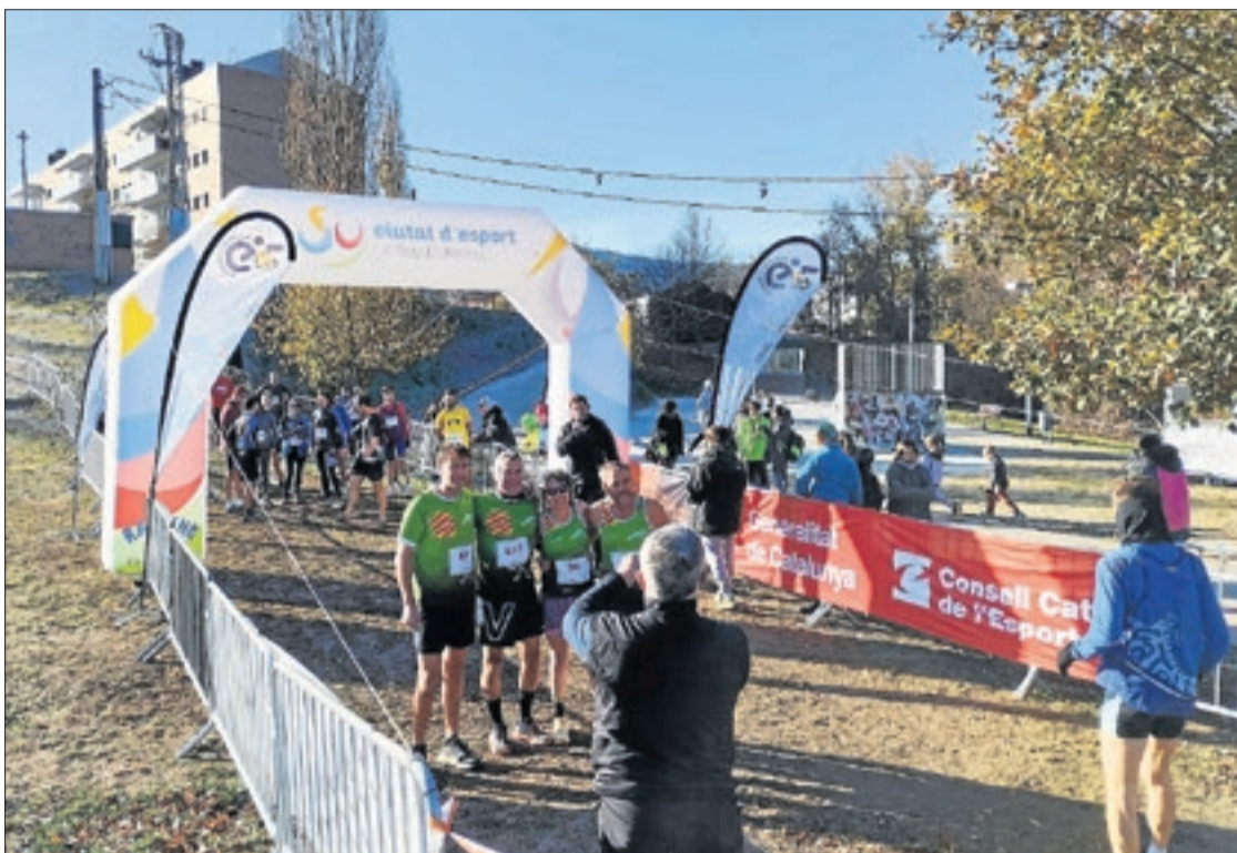
La cursa era per a totes les edats, des dels nens més petits fins a adults.

Els clubs que van participar amb equips de diferents categories van ser el Lleida Handbol Club, ACLE Guissona, CEACA Tàrrega, Handbol Alcarràs i Escola del Carme. ■