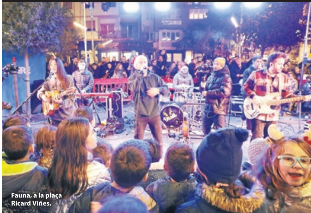
Fauna, a la plaça Ricard Viñes.

Màping i encesa de llums als carrers de la ciutat i estrena de la nadala del grup SEGRE a càrrec de Fauna