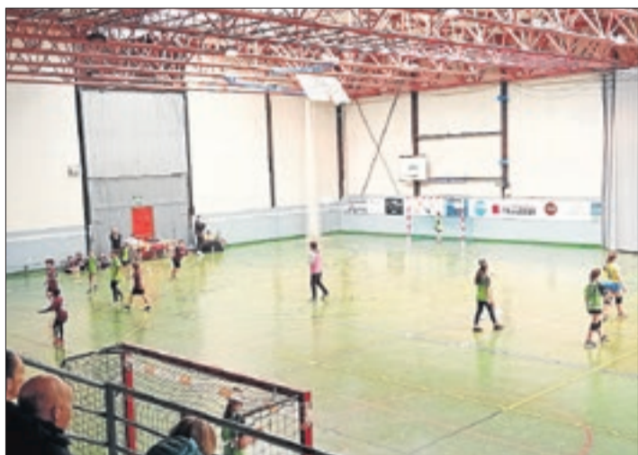
Una imatge dels partits a Tàrrega.

Durant aquests mesos es planificarà el calendari amb totes les jornades possibles fins a dates de final de curs escolar, que serà a finals de juny. La coordinació correspon al CE Pallars Sobirà i col·laboren els consells esportius del Pallars Jussà, Alt Urgell, Alta Ribagorça i la Val d'Aran. ■