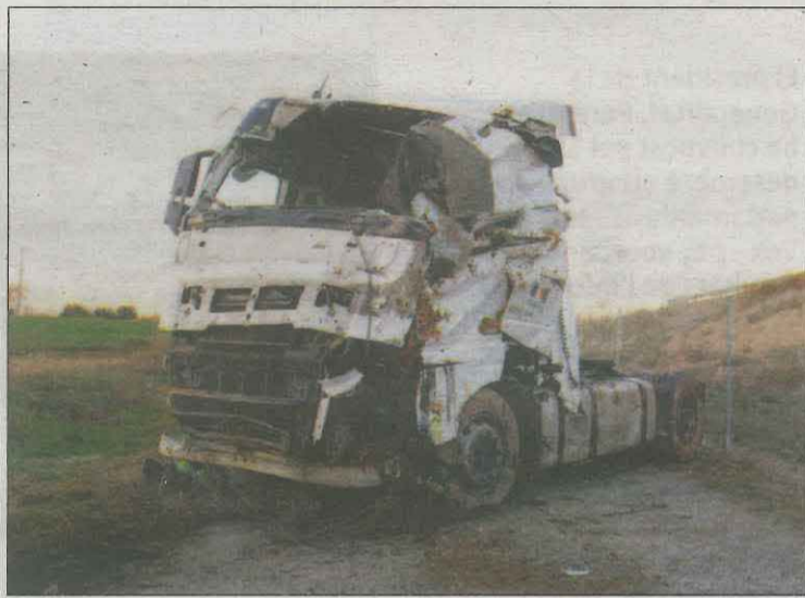
Estat en què va quedar el camió accidentat

Des de Trànsit també van indicar que aquest 2023 respecte al 2019, any de referència per al compliment dels objectius de reducció de la sinistralitat del Pla de Seguretat Viària 2020 - 2023, s'està registrant una reducció del 17% pel que fa a les víctimes mortals a les carreteres catalanes