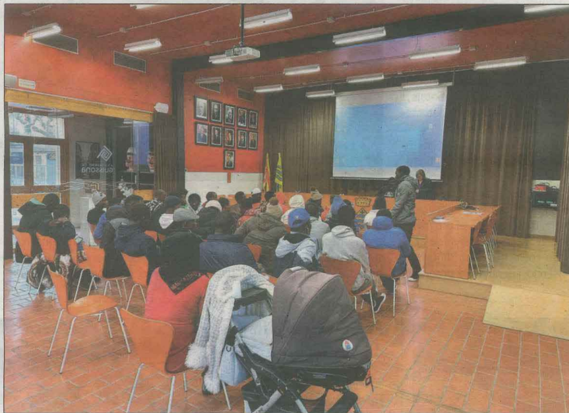
Desenes de senegalesos a l'Ajuntament de Guissona durant una de les trobades