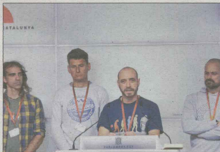
Representants dels GRAF Lleida, dimecres al Parlament

A més a més, també consideren que el tancament de la seu, acabaria "desmantellant" la presència sobre el territori de l'àrea GRAF. Cal recordar que els efectius de la unitat afectats pel tancament es van desplaçar dimecres al Parlament per demanar al Govern que ajorni el tancament, que està previst el 31 de desembre. Els representants van argumentar que la decisió no respon a criteris operatius.