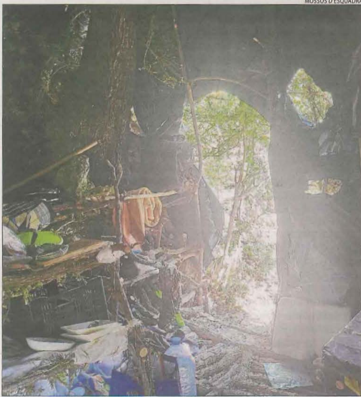
Els 'jardineros' vivien en cabanes que ells mateixos es construïen.

La segona fase s'ha desenvolupat al llarg d'aquest estiu i va acabar el 27 d'octubre passat amb la troballa d'una plantació a Senterada en la qual van decomissar unes 3.000 plantes, 2.000 de seques i 1.000 més en