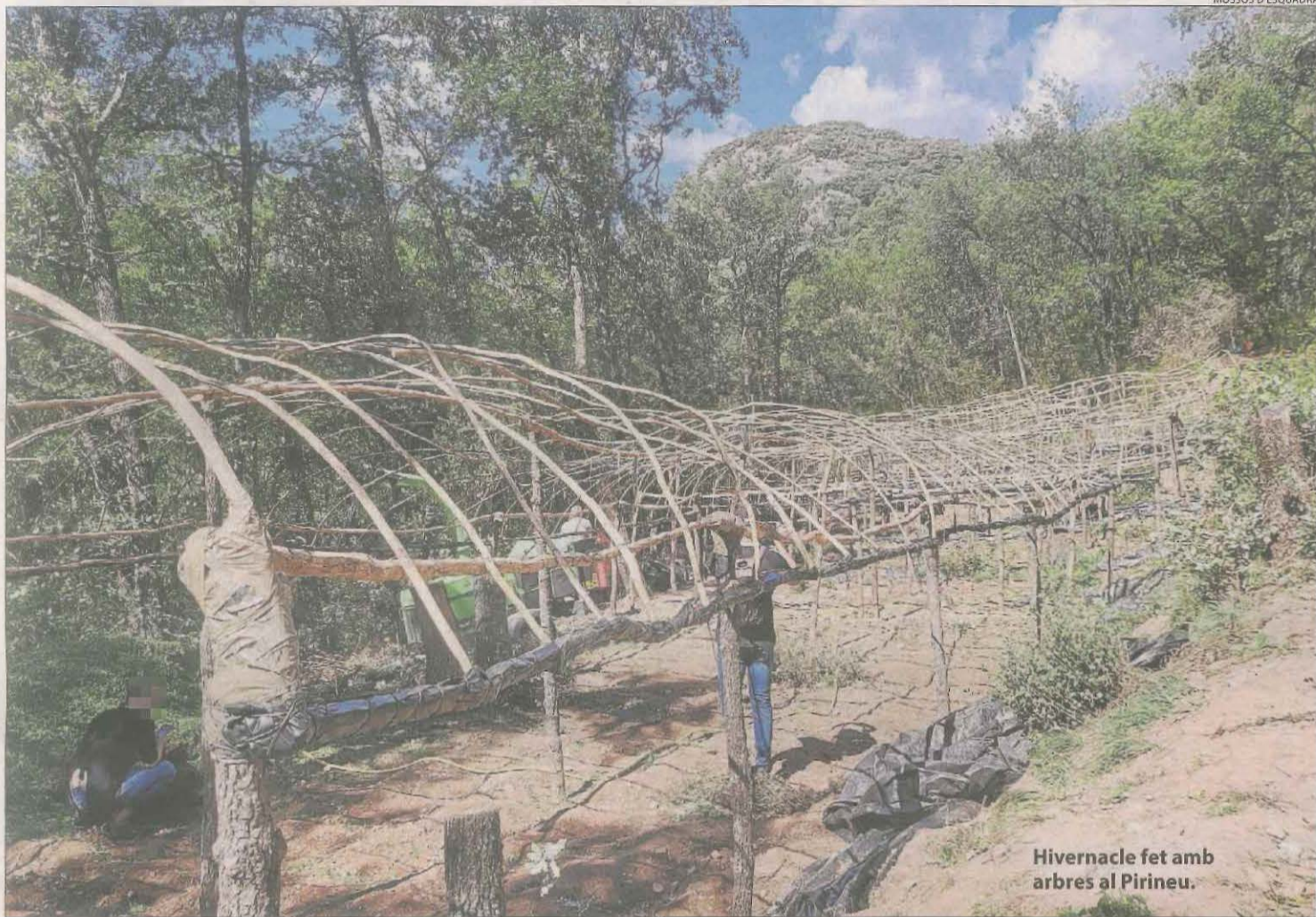
Hivernacle fet amb arbres al Pirineu.