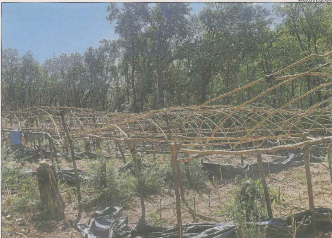
Un dels hivernacles, que bastien amb la fusta dels arbres que tallaven.