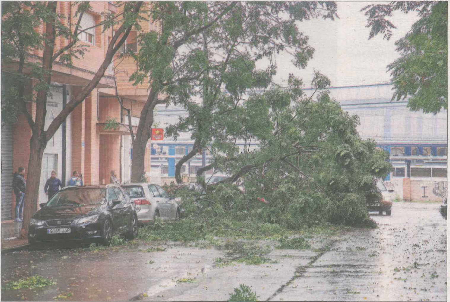
L'arbre que va caure ahir al carrer Jeroni Pujades de Lleida ciutat.

La borrasca Ciarán també va implicar un descens de les temperatures. En aquest sentit, a Boí els termòmetres van arribar a marcar 7 graus sota zero. Aquest va ser també el registre més gèlid de la jornada a tot Catalunya. El van seguir Salòria, amb -6,3 graus; el port de la Bonaigua, amb -5,9; Sas-seuva, a la Val d'Aran, amb -5,7; Certascan, al Pallars Sobirà, i Espot, amb -5,6; i Lac Redon, amb -5,5. A les comarques del pla, les temperatures també van descendir. Per exemple, a Cervera la mínima es va situar en 7,1 graus i a Tàrrrega va ser de 8,1. Per un altre costat, a Lleida ciutat, Mollerussa i les Borges Blanques les temperatures més baixes van rondar els 9 graus.