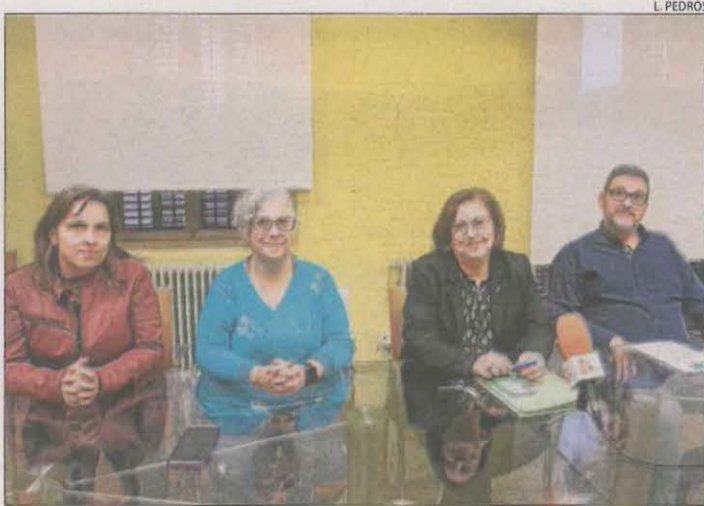
Imatge de quatre edils de Junts per Tàrrrega.