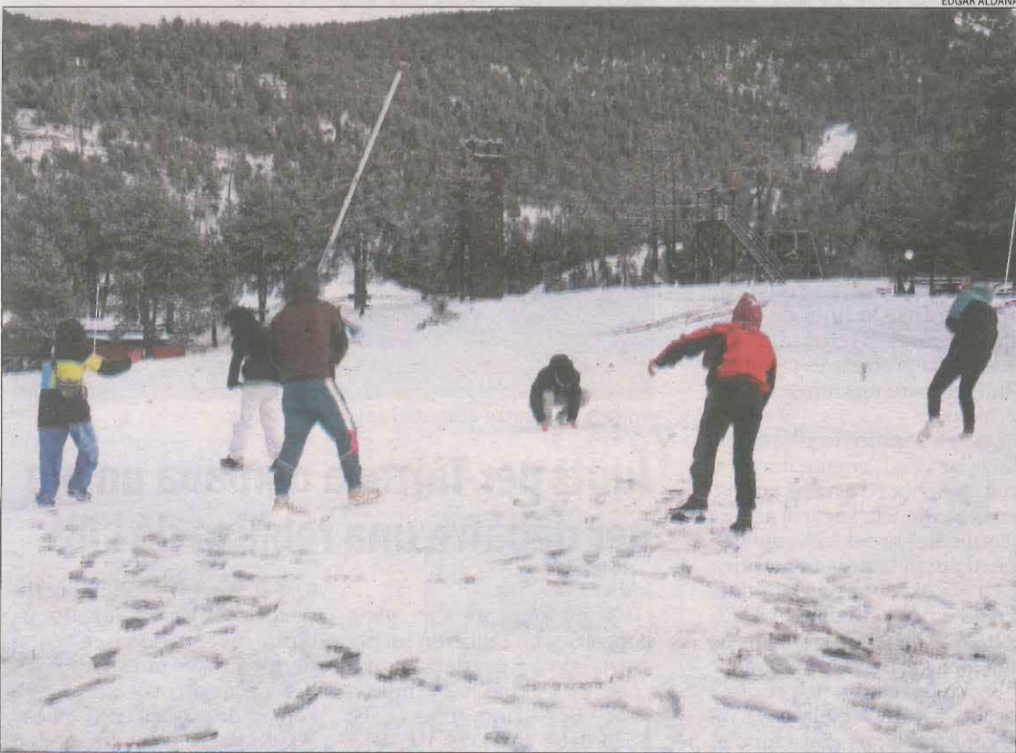
Joves jugant amb la neu ahir a la tarda a Port Ainé.