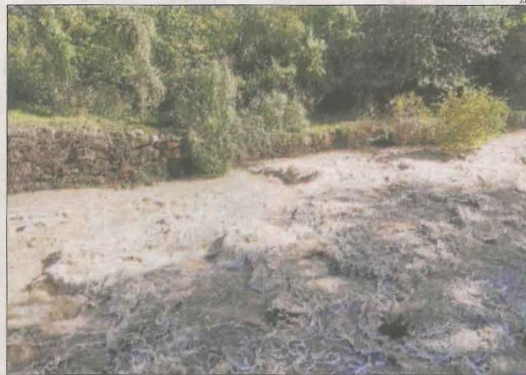
El Flamisell va créixer després de les fortes pluges a la Vall Fosca.