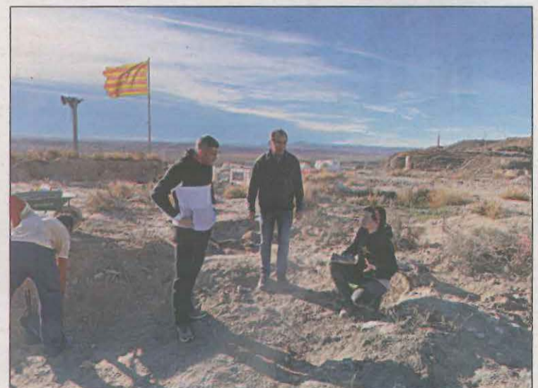
Els arqueòlegs ja han iniciat els treballs d'excavació

Cal recordar que al desembre, Alcoletge iniciarà un projecte d'intervenció arqueològica a les fortificacions bèl·liques del Front del Segre al Tossal de la Nora. Aquesta actuació compta amb una subvenció de la Diputació de Lleida i l'Institut d'Estudis Ilerdencs (IEI).