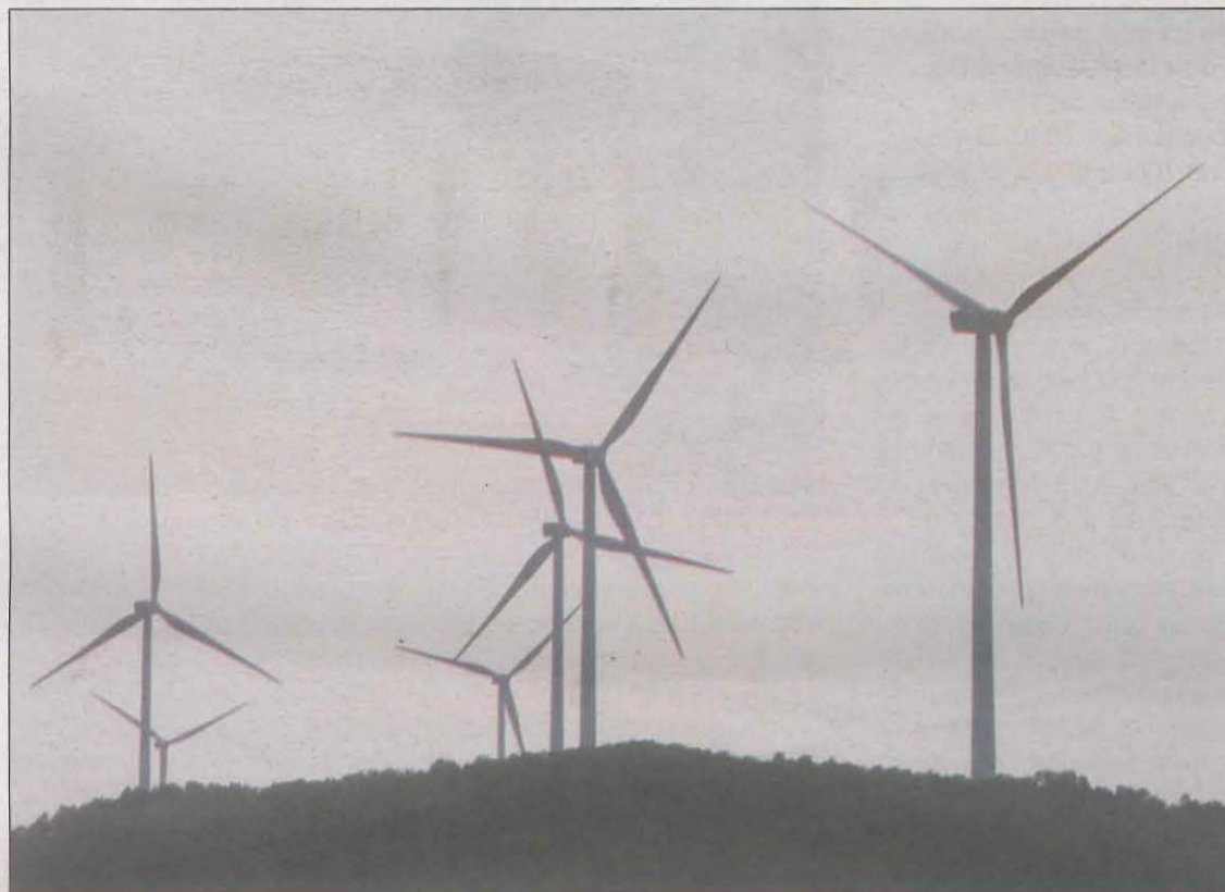
Aerogeneradors d'energia eòlica al municipi de la Granadella, a la comarca de les Garrigues

A Lleida, a falta de confirmació oficial, es preveuen protestes al Pallars, al Segrià i la Segarra. Els membres de SOS Vall del Corb assistiran a Belltall, a la província de Tarragona, va explicar Vives, que també va apuntar que els veïns de Nalec i Ciutadilla, on hi ha previst dos macroprojectes de plantes solars que sumen 197 hectàrees, també pujaran a Belltall. Des de la plataforma asseguren que el model de transició energètica que preveuen els governs vulneren "greument" els drets de la ciutadania i afirmen que aquest es ba-