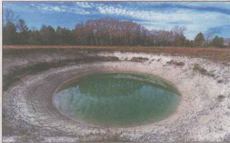
L'estany de gran de Basturs, al Pallars Jussà

Mir assegura que calen unes "condicions úniques" per a la formació d'un dom. Fa falta una font d'aigua subterrània que surti en un punt on les característiques