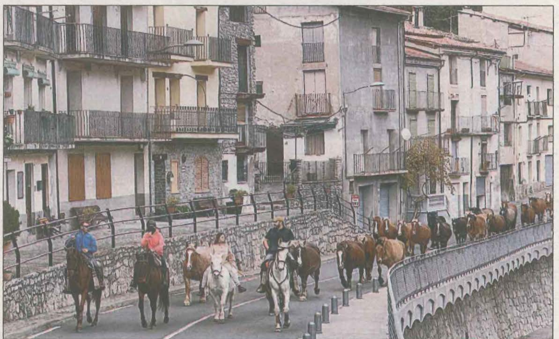
Un grup de cavalls travessant ahir els carrers de Gerri de la Sal, al Pallars Sobirà

parades de decoració nadalenca, productes artesans del territori i activitats que amenitzaran la jornada. El dia 1 de desembre també s'inaugurarà la pista de patinatge, que estarà oberta fins al 7 de gener. El 22 de desembre, els més petits podran participar en un taller per fer arribar la seva carta als Reixos i l'endemà es farà el tradicional Caga-soca.