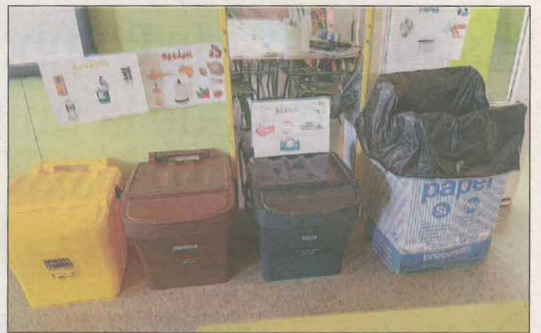
També es va lliurar cubells i contenidors de selectiva

de totes aquelles dinàmiques que, en el camp del reciclatge, treballen a les escoles", va afegir. Durant els mesos d'octubre i novembre, el Consell Comarcal també ha programat als centres educatius, tallers sobre menstruació lliure de residus, on s'han fet entrega de 200 compreses reutilitzables, i accions per conscienciar sobre l'economia circular en l'àmbit dels residus. L'ens comarcal també ha facilitat 31 papereres de cartró, 121 cubells i 27 contenidors per facilitar la recollida selectiva a les seves instal·lacions.