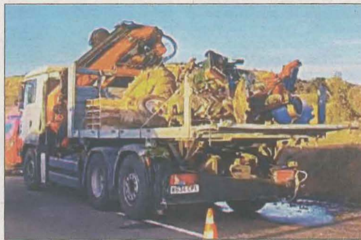
Moment en què retiraven el tractor accidentat

D'altra banda, el dilluns a les 23.11 hores els serveis d'emergències van ser alertats que un vehicle havia bolcat a Montferrer i Castellbò, però cal assenyalar