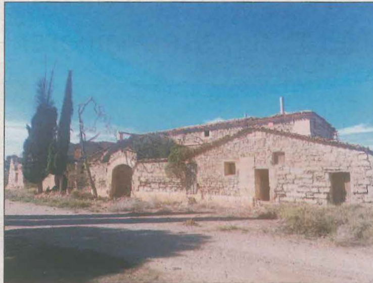
Imatge de l'estat en què es troba la casa

La mateixa iniciativa popular va lamentar que aquesta decisió ajorna la resolució del recurs d'alçada que van presentar a finals d'agost i del qual se'ls ha donat resposta una setmana abans que s'exhaureixi el termini. En aquest sentit, Cal Macià va de-