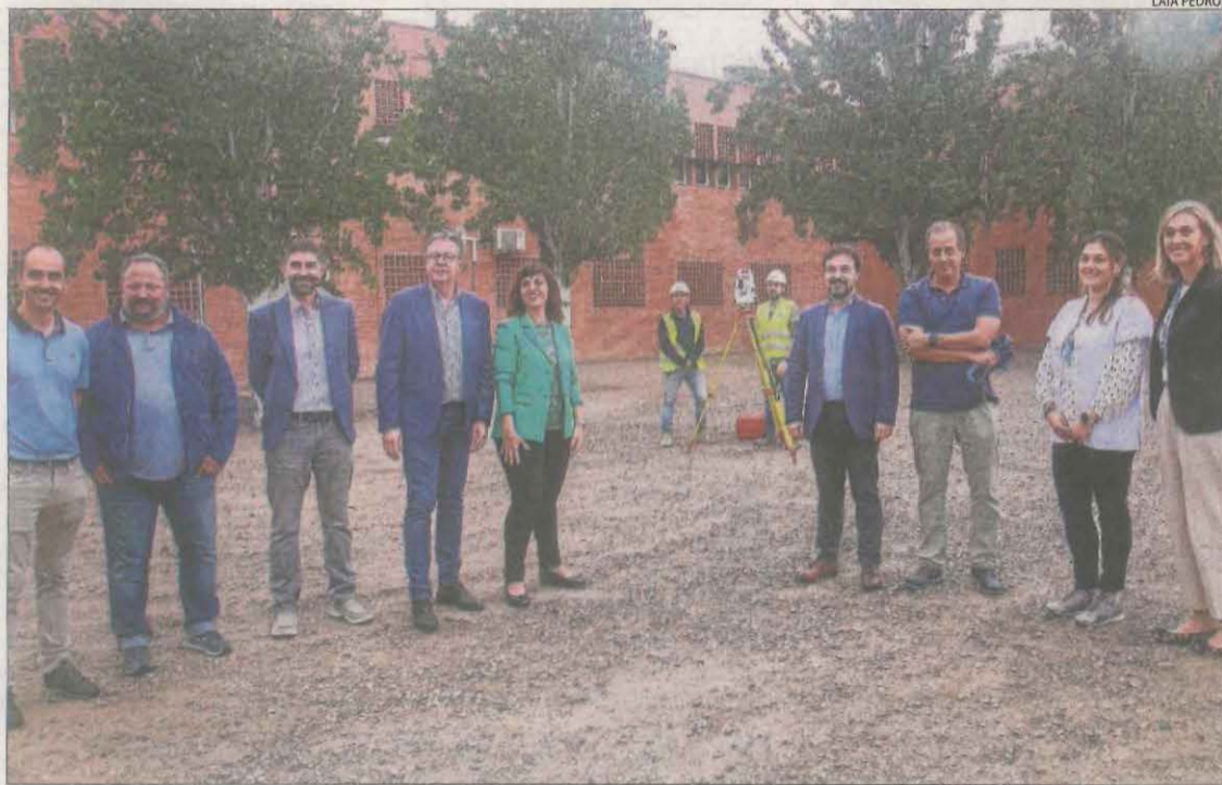
Visita institucional ahir a l'inici de les obres de remodelació i ampliació del CAP.

Ambdós equipaments sumen una inversió de més de 7,6 milions d'euros || La Diputació finança els 4 milions del Centre d'Atenció Primària de la capital de l'Urgell, que tindrà tretze consultes més