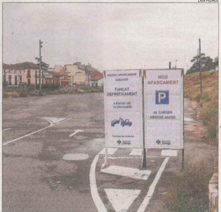
El pàrquing que hi havia al costat de l'estació de tren, sense servei.