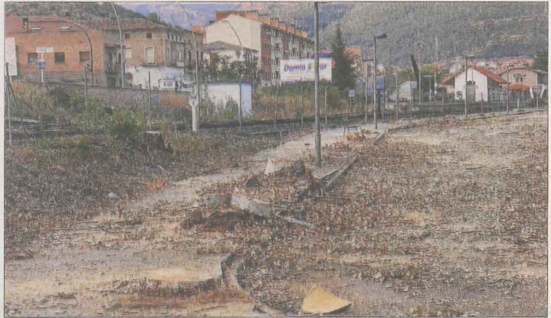
La zona on s'han talat els arbres a prop de l'estació de tren de la Pobla de Segur.

Actuació promoguda per FGC davant de possibles caigudes dels arbres als rails || L'ajuntament replantarà la zona