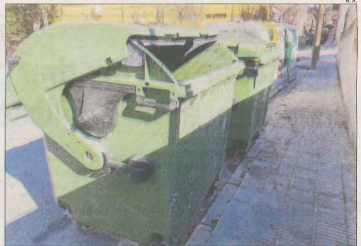
Imatge d'arxiu de contenidors de resta a Almacelles.