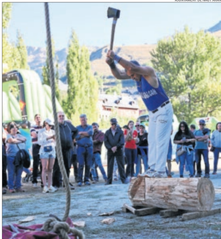
AJUNTAMENT DE NAUT ARAN