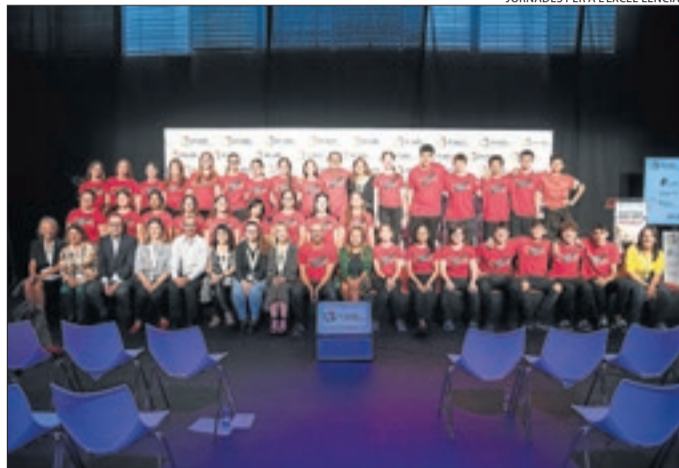
JORNADES PER A L'EXCEL·LÈNCIA

L'acte de clausura després del cicle de conferències i debats.