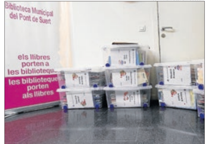
Els lots de llibres que es prestaran als diferents centres.