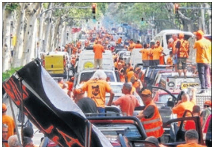
La marxa lenta de caçadors convocada ahir a Barcelona.