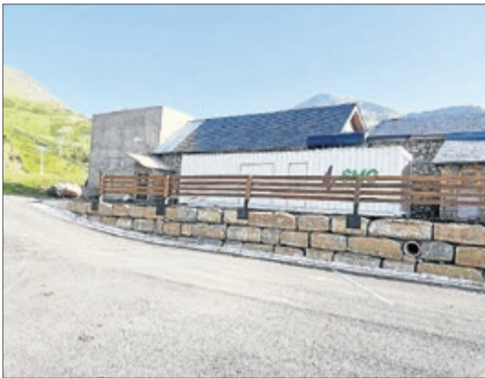
Un gran grup electrogen com a subministrament d'emergència.

FGC va indicar que AMSA "analitzarà la situació i durà a terme les accions necessàries en defensa dels seus drets" per poder "resoldre la situació administrativament". L'anul·lació