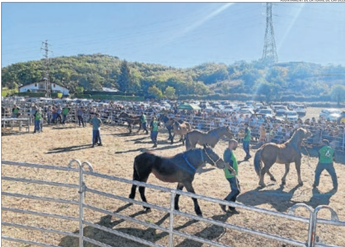
AJUNTAMENT DE LA TORRE DE CAPELLA