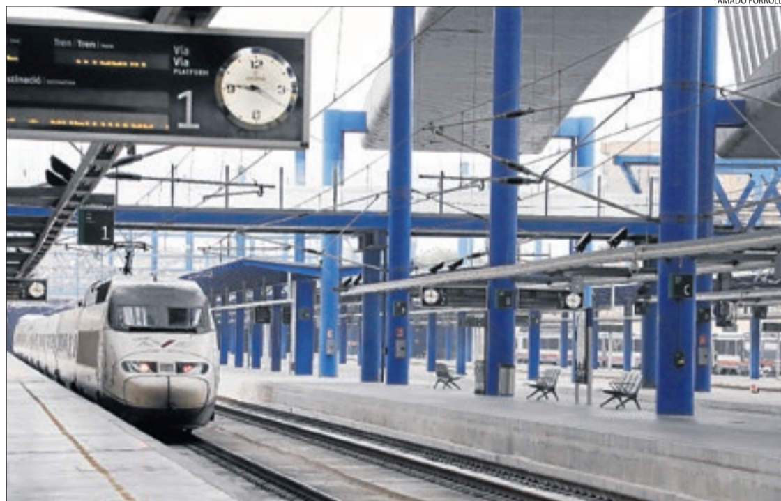
Un tren d'alta velocitat en primer terme i un regional al fons a l'estació de Lleida.