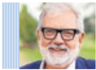
FÈLIX LARROSA PIQUÉ ALCALDE DE LLEIDA

LA TARDOR ens ofereix combinacions cromàtiques captivadores que són, al cap i a la fi, variacions i evolucions del verd que tant necessitem en temps de contaminació i de sequera. Els espais naturals són imprescindibles per guanyar en qualitat urbana i, paral·lelament, contribueixen a millorar la qualitat de l'aire, a reduir el soroll i a preservar la biodiversitat com també a generar noves oportunitats, a ser resilents contra el canvi climàtic i, en definitiva, a sentir-nos més a gust amb els nostres entorns.