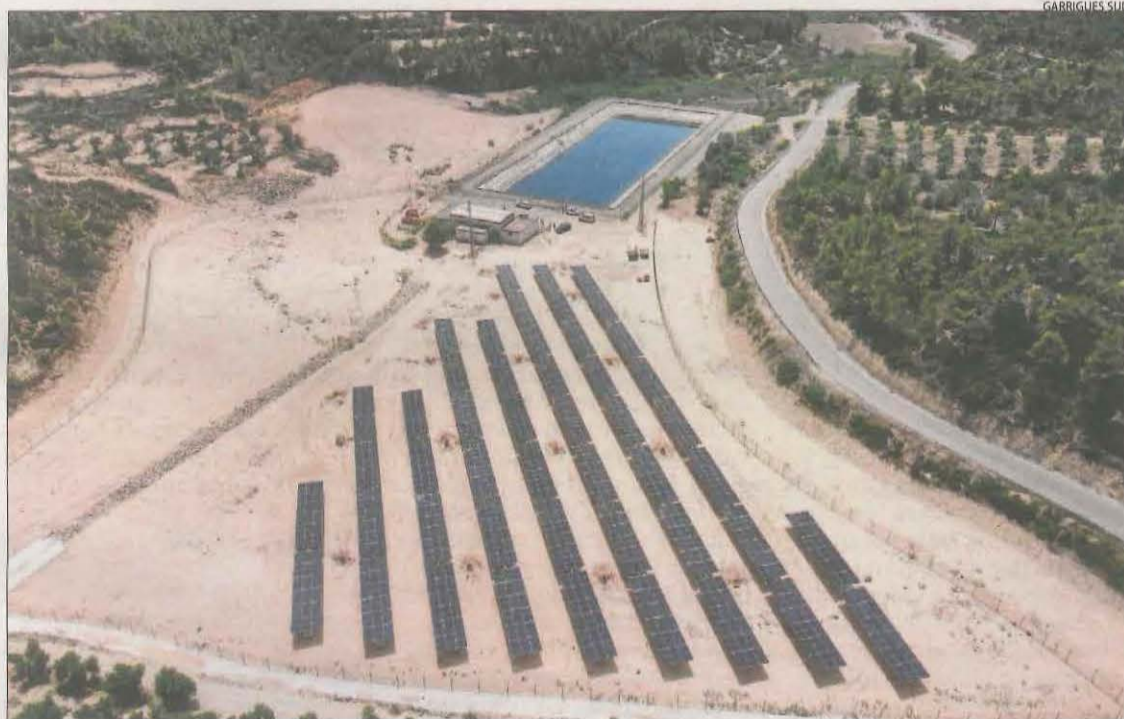
La central solar del Garrigues Sud a Bovera, una de les últimes posades en marxa a Lleida.