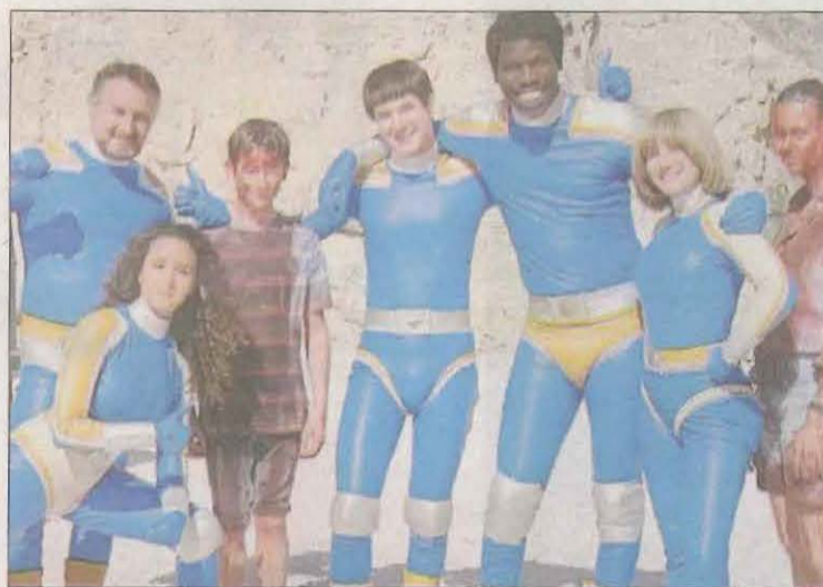
Alguns dels protagonistes de 'Fumar provoca tos'.

Fumar provoca tos se centra en un grup de superherois denominat Tabac Force que lluita tant contra tortugues o contra paneroles gegants, mutants que semblen sortides d'una pel·lícula japonesa de la dècada dels cinquanta utilitzant cada membre de l'equip un po-