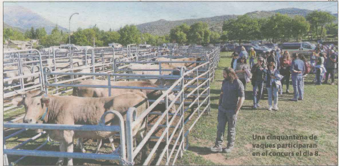
Una cinquantena de vaques participaran en el concurs el dia 8.

La gastronomia, un pilar del certamen, i incorpora com a novetat un sopar en què es podran tastar plats de la Vall i de la comarca