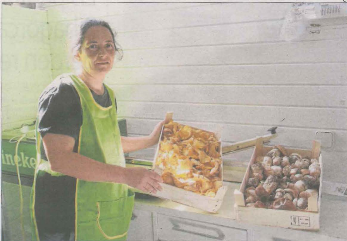
Bolets recollits per la firma Natura Bolets de Montferrer, a l'Alt Urgell.

Responsables de la firma Natura Bolets de Montferrer, a l'Alt Urgell, van indicar que la temporada de ceps està perduda a tota la comarca. Els pocs bolets que s'han posat a la venda venen d'Aran, el Ripollès, França i Navarra i són cars i de poca qualitat. Així, el cep arriba als 35 euros el quilo, a 20 el camagroc