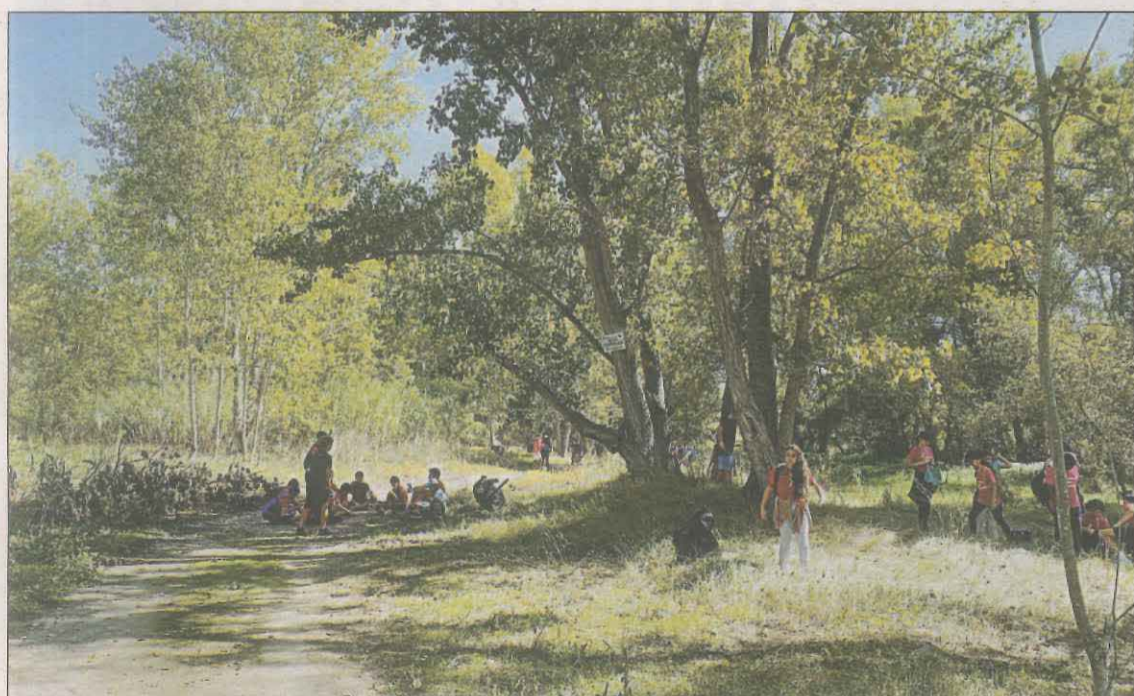
Els nois i noies de l'Institut Nou d'Alcarràs participen en l'activitat a la natura

mateix, el vicepresident del Consell Comarcal del Segrià, Manel Ezquerro, apunta que "a més de no atendre les demandes del Consell, Educació no ens permet posar línies noves o ampliar la capacitat dels autobusos per als alumnes post-obligatoris".