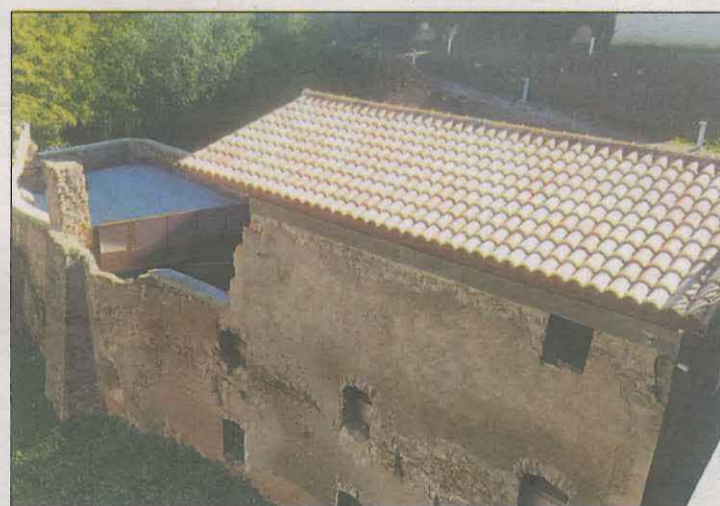
Imatge del recinte de les Adoberies de Tremp