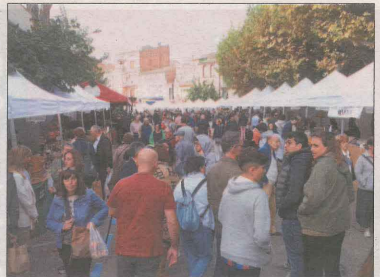
Edició anterior de la Fira del Codony

Des de l'any passat la Fira del Codony va de la mà amb la Fira d'Esports de Muntanya, una proposta de l'entitat Lo Podall que treballa per impulsar i recuperar senders per al ciclisme de muntanya al municipi.