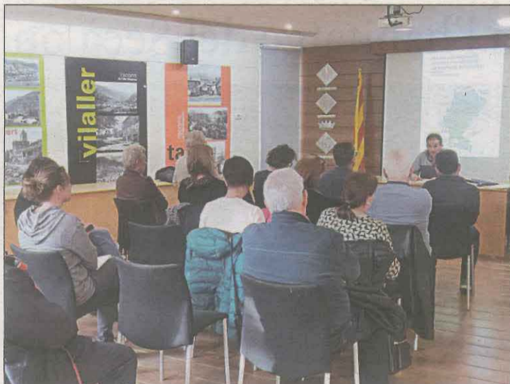
Presentació del pla d'habitatge de l'Alta Ribagorça

tre aquesta situació l'estudi proposa quatre fórmules alternatives de l'habitatge: potenciar la xarxa