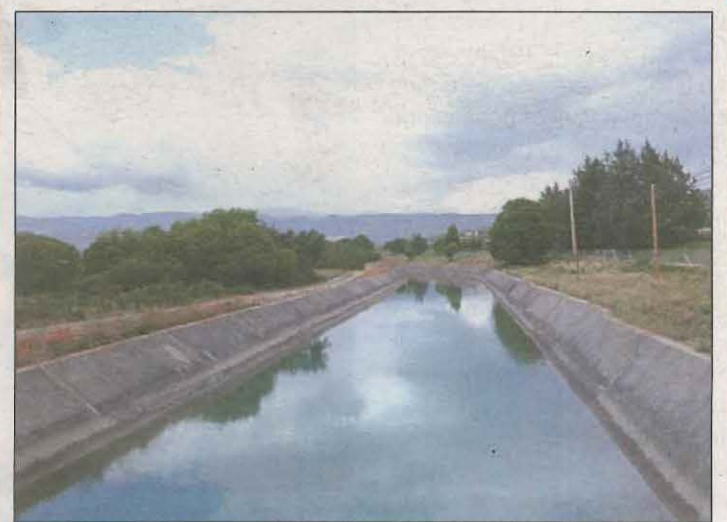
Imatge del canal hidroelèctric de Gavet, al Jussà

Ara, però, Endesa ha pactat amb el regulador que e-Distribución pugui validar una sola vegada la documentació necessària -l'acord de repartiment signat per tots els consumidors i el fitxer amb els diversos coeficients de repartiment- quan el rebí d'una de les parts. En el cas dels autoconsums individuals, Endesa ja té pactat des del juny amb el regulador que la modificació del contracte entre el distribuïdor i el client es faci als 10 dies de rebre la confirmació de la comunitat autònoma que s'ha registrat correctament la instal·lació.