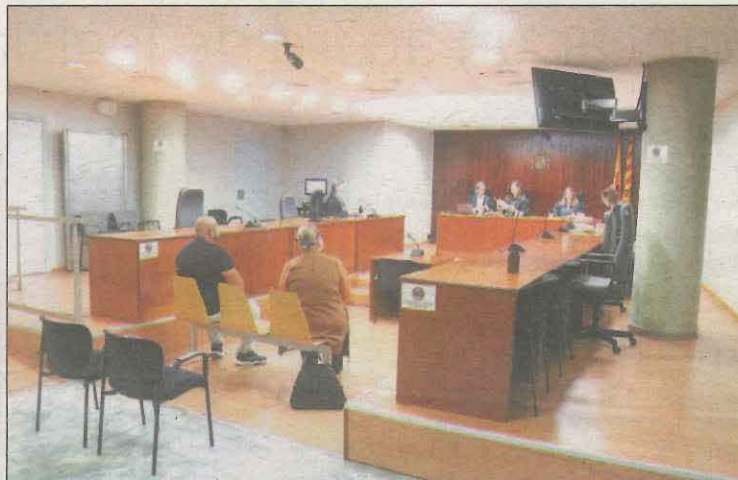
Moment del judici que es va fer el 13 de setembre

Durant el judici, celebrat el passat 13 de setembre a l'Audiència de Lleida, la Sala va visionar en vídeo els testimonis de les nenes, que van relatar els abusos soferts al domicili de l'acusat. De manera presencial, les psicòlogues del cas van declarar que veien creïbles els testimonis de les menors perquè tenen "competència suficient" per declarar i "cap motivació secundària, com de venjança o econòmica envers l'acusat, per inventar una cosa així". També va declarar una de les educadores del centre educatiu a qui les menors van explicar-li els abusos que sofrien per part de l'acusat.