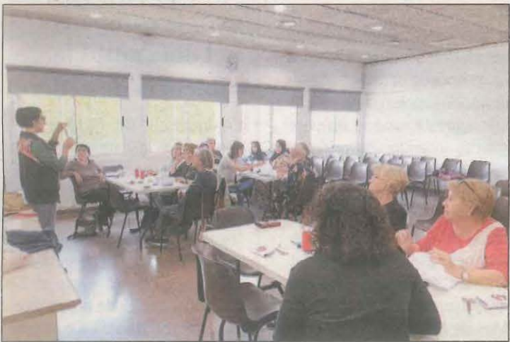
Els tallers s'imparteixen a Sant Guim de Freixenet