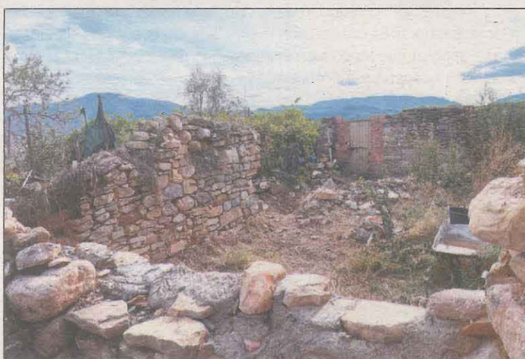
Zona de pati i horts on va ser localitzat el cos sense vida

Torallola REDACCIÓ Els Mossos d'Esquadra esperen els resultats de les proves d'ADN que s'han fet al cadàver de la dona localitzada en un hort al nucli de Torallola, pertanyent a Conca de Dalt. Si es confirmen les sospites dels investigadors, podria tractar-se d'una jove de 30 anys originària de l'àrea metropolitana de Barcelona, però que feia anys que residia al Pirineu. Els Mossos van detenir dijous passat un home de 46 anys, amb nombrosos antecedents policials, com a principal sospitós del cas. De fet, l'hort on va ser trobat el cos sense vida és de la seva propietat. A més, la dona estava enterrada entre dos blocs de formigó. Cal recordar que el dissabte, l'arrestat va passar a disposició judicial a Tremp i es va decretar presó provisional, comunicada i sense fiança per la mort violenta d'una dona.