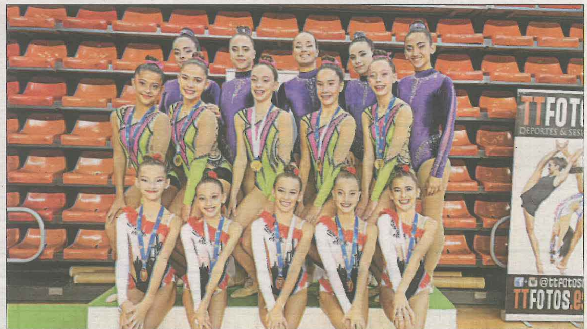
El equipo cadete e infantil disputarán el Nacional el 24 de noviembre en Pamplona