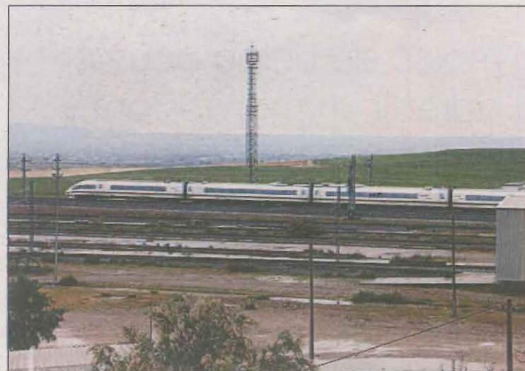
Imatge d'arxiu d'un tren d'alta velocitat

Finalment, Adif va resoldre la incidència que afectava a les instal·lacions ferroviàries de l'alta velocitat i es van poder reobrir les dues vies. La previsió am la que treballava Renfe que es poguessin recuperar els horaris de forma progressiva durant la jornada. Tot i això, durant el dia es van seguir registrant retards que van afectar tots els trens de les línies d'alta velocitat, tant els de l'AVE com els Avant i també els de altres companyies que operen en aquesta metixa línia com són el trens Ouigo i d'Iryo.