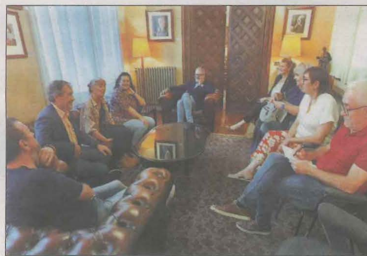
La trobada va tenir lloc al despatx noble de l'alcaldia

Un total de 4.129 aspirants que van aprovar el concurs d'oposició extraordinari del departament d'Educació s'han quedat sense una de les 14.238 places convocades. Es van presentar 27.338 persones, de les quals 17.588 van aprovar, 9.750 van suspendre, i només 13.459 han aconseguit una plaça. Tanmateix, el procés d'estabilització ha deixat 779 vacants.