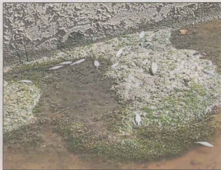
Peixos morts a la Sèquia Major a Joc de la Bola

Per tot això, Junts Lleida trasllada la problemàtica a l'Ajuntament de Lleida per tal que s'investiguin quan abans les causes i si aquesta problemàtica pot