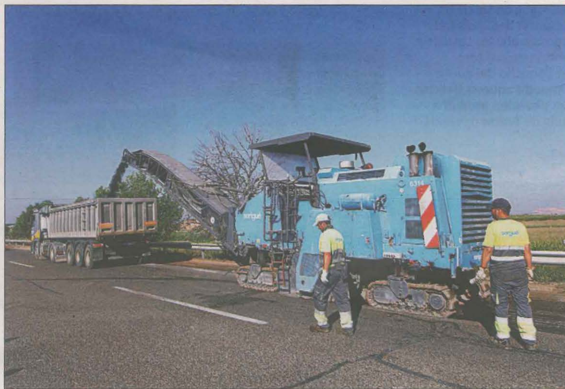
Treballs de millora del ferm de la autovia A-2 a l'alçada d'Alcarràs

La Comissió Europea va donar llum verda ahir a l'addenda del Pla de Recuperació, Transformació i Resiliència d'Espanya, desbloquejant així més de 93.000 milions d'euros en ajudes directes i préstecs dels programes comunitaris. En concret, Espanya disposarà de més de 10.000 milions d'euros en transferències addicionals i de fins a 83.000 milions d'euros en préstecs en condicions favorables procedents dels programes Next Generation EU i el REPowerEU. En el mateix document, Brussel·les accepta que no s'apliqui el pagament per ús en autopistes i autovies a canvi de fomentar el transport de mercaderies ferroviari. Això afecta a l'autopista lleidatana AP-2 que seguirà sent gratuïta i a la resta de vies de l'Estat a Catalunya com l'AP-7.