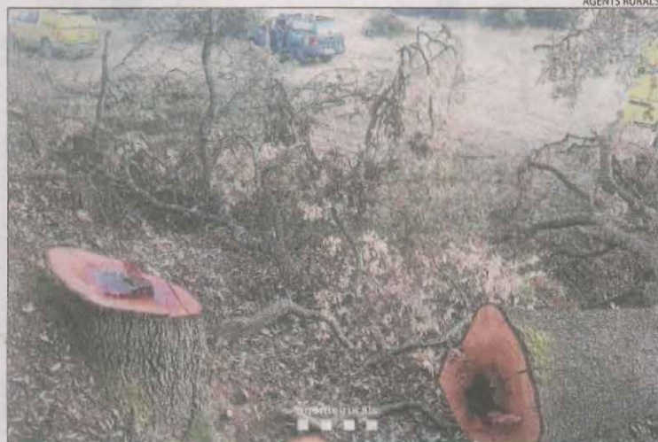
Restes d'un dels troncs talats il·legalment al Pallars.