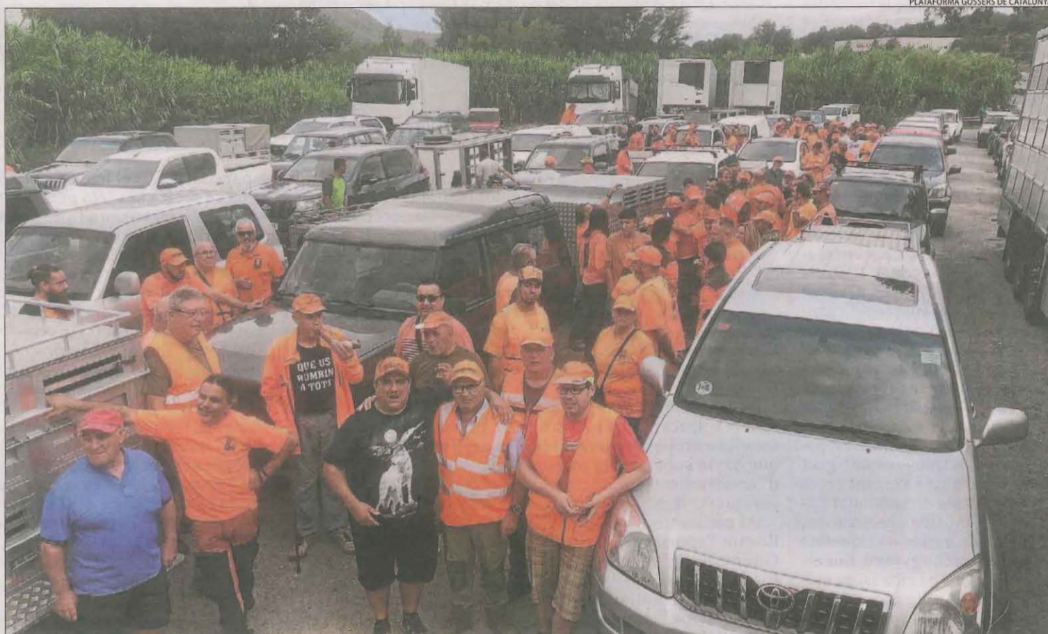
Caçadors de Lleida van participar en una marxa lenta que va sortir de Manresa a Terrassa com a protesta a les exigències de la Generalitat.

El col·lectiu de caçadors creu que els seus gossos han de quedar fora de la llei de benestar animal (que obliga a garantir uns determinats metres per gos i que surtin a passejar almenys una hora al dia). "Aquesta és una línia roja que no podem deixar passar. Si els gossos de caça entren en aquesta llei,