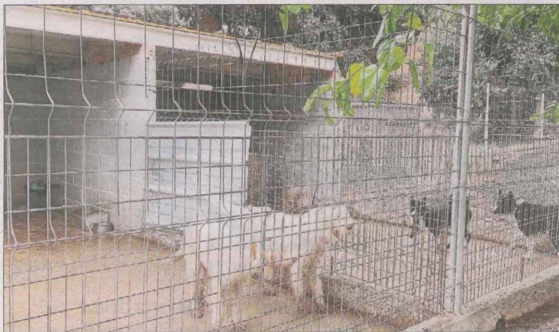
Gossos caçadors de Lleida que ahir no van sortir.

molts gossers plegaran al ser totalment incompatible", va dir Rodríguez. Va destacar també la imposició d'una distància entre les gosseres i les granges de porcs. Pràcticament el 60% de les gosseres de Lleida estarien afectades i n'haurien de construir de noves. Van indicar que l'aturada se suspendrà només