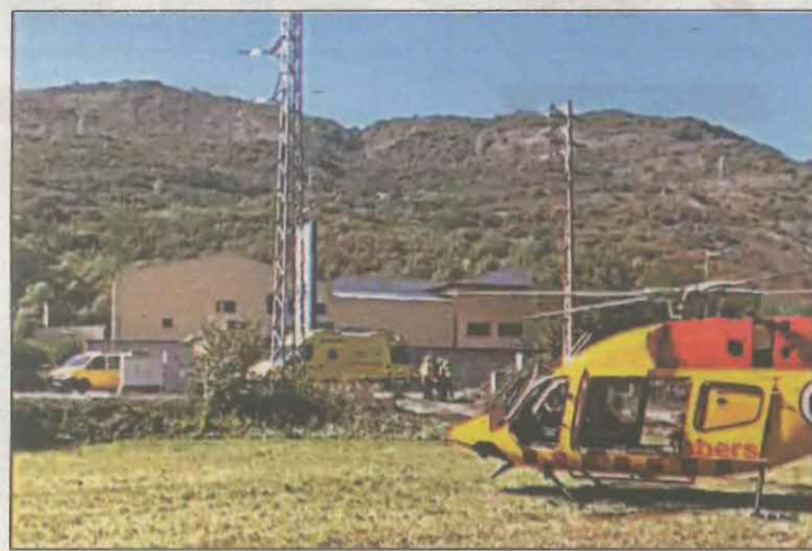
Un helicòpter va traslladar la víctima a l'ambulància

L'operació va culminar el 21 de setembre quan van ser arrestats els dos homes com a presumptes autors d'un delictes continuat de robatori amb força. El jutge va deixar els dos detinguts en llibertat amb càrrecs.