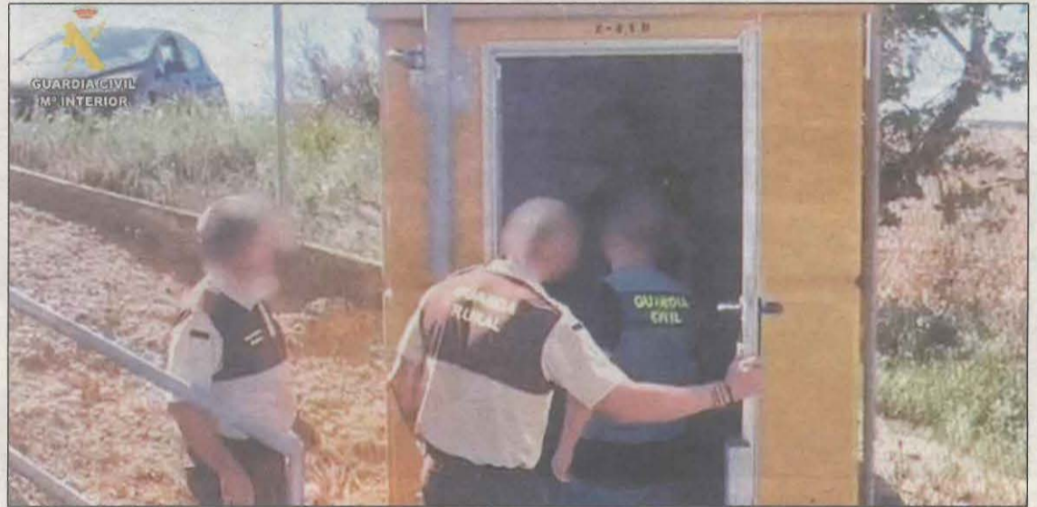
Captura d'imatge de l'operació policial, que va acabar amb dos detinguts

La Guàrdia Civil va iniciar una investigació després de rebre diverses denúncies per una sèrie