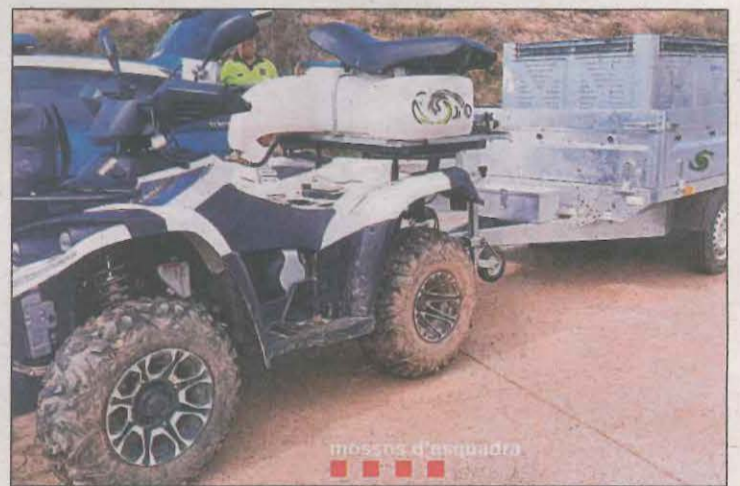
El quad que van aturar els Mossos a la via N-230

Els tècnics van contactar amb responsables de la presa de Sant Antoni per conèixer si s'havia produït alguna maniobra extraordinària que alterés el cabal del riu. Els responsables de la companyia Endesa van assegurar que no i que s'alliberava el cabal que indica el Pla Hidrològic.