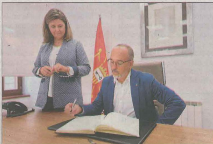
El conseller Campuzano va visitar ahir la Val d'Aran

ció integrada que el Govern vol desplegar arreu i a la vegada també va afegir la voluntat de l'executiu català per tal que en algunes matèries l'Aran pugui ser un "territori d'innovació social i es puguin desenvolupar projectes d'atenció integral per a persones amb discapacitat, persones grans o persones amb problemes de salut mental".