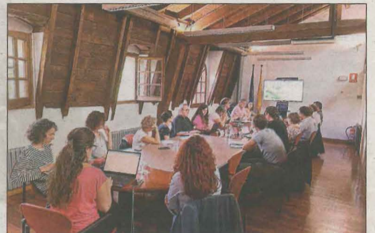
Ahir es va constituir la comissió executiva del programa

El programa Arrelament posa el focus en els 16 sistemes urbans catalans que han registrat una pèrdua sostinguda de població entre els anys 2001 i 2022. Agrupen 121 municipis i actualment sumen 83.636 habitants. La gran majoria són petits municipis, de