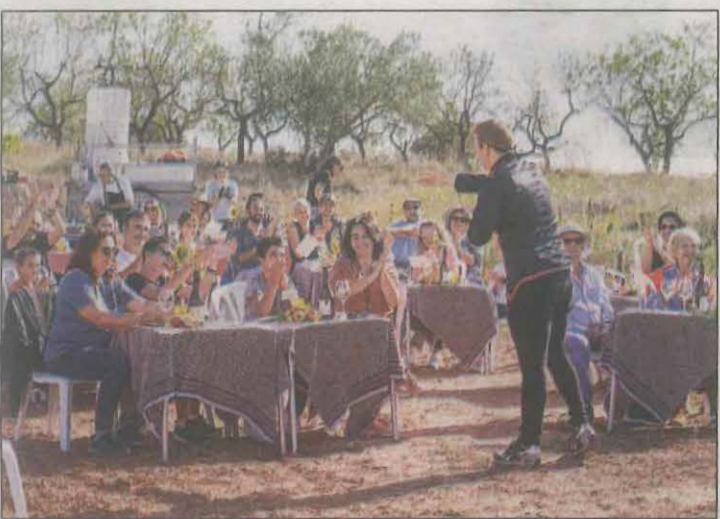
Un moment d'aquesta primera jornada tècnica

els km 7 i 8 (Nou de Gaià) i la T-211 entre km 6 i 7 (Pobla de Montornès). També hi ha tallada la circulació a la R13 en ambdós sentits entre Salomó i Roda de Berà. Els Bombers van donar establitzat a les 18.41 l'incendi i es van aixecar ja els confinaments que s'havien decretat a Vespella i a Castell de Montornès.