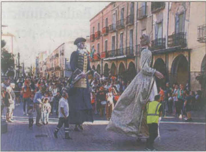
Els gegants van fer acte de presència