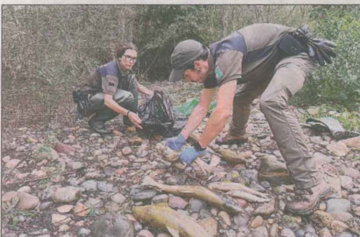
Agents rurals recollint alguns dels peixos morts a Talarn

Els Agents Rurals i l'Agència Catalana de l'Aigua (ACA) investiguen la mort de desenes de peixos a la Noguera Pallaresa, en el tram de Talarn a pocs metres de la sortida del pantà de Sant Antoni. L'avís es va donar dijous a la tarda i els Agents Rurals i tècnics de l'ACA es van desplaçar al riu on ja van trobar desenes de peixos morts. Entre les espècies destaquen algunes de protegides com bavoses de riu i llopets de riu i també moltes truites autòctones, barbs o carpes. Els peixos morts localitzats oscil·len entre els 200 i 300 exemplars però n'hi pot haver molts que l'aigua els hagi arrosse-