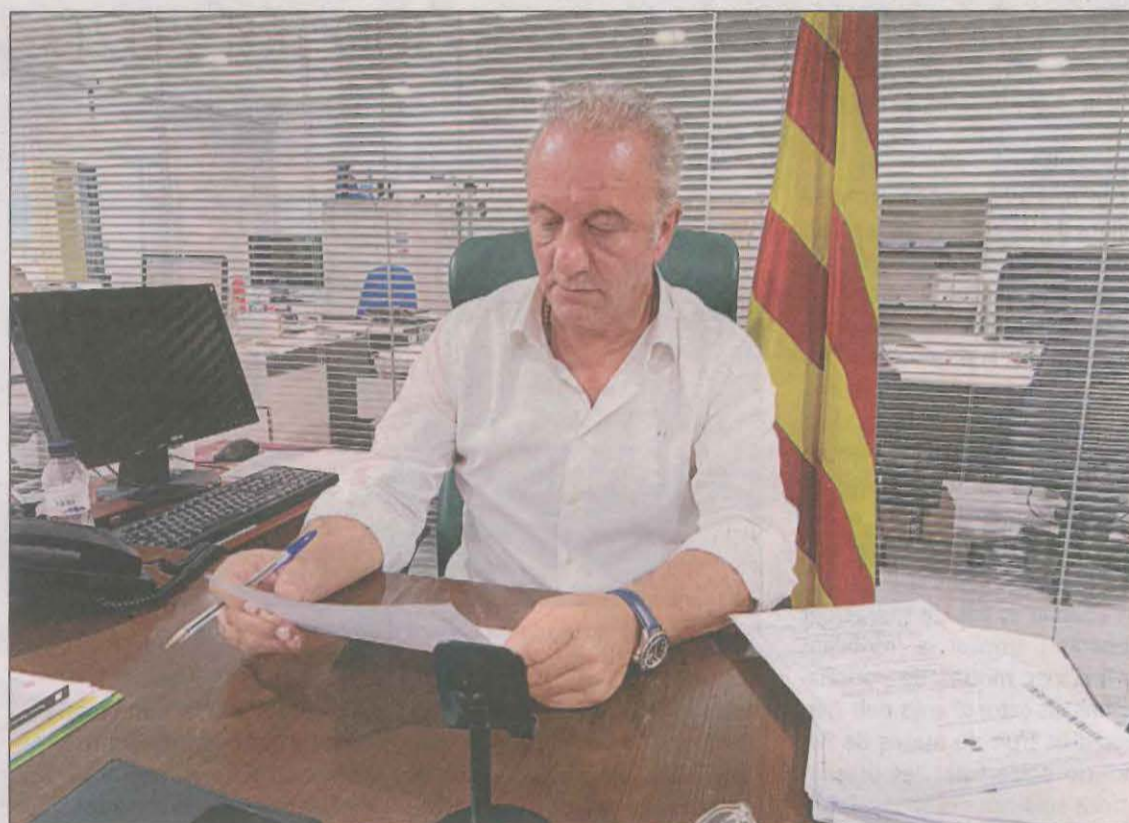
Imatge de Carlos Isus, president del Consell Comarcal del Pallars Sobirà

Durant el transcurs d'un ple del consell comarcal celebrat aquest dimarts el grup d'ERC-AM ha mostrat el seu suport al president en les decisions i les accions adoptades en relació amb el servei del SAT comarcal. El grup també ha recordat que és al consell comarcal a qui "correspon legítimament" resoldre la distribució