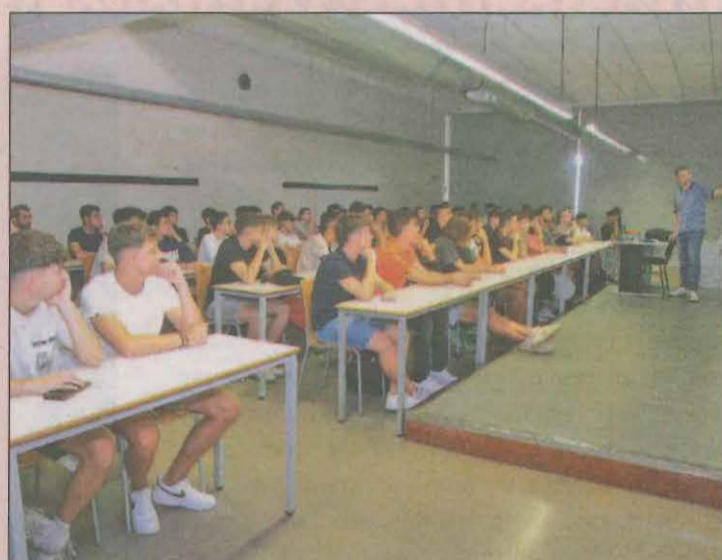
Jornada d'acollida a l'Escola Politècnica Superior

En aquestes sessions, els equips de direcció van presentar els diferents graus i serveis com ara el campus virtual, les biblioteques, l'Institut de Llengües, el servei d'Esports, la iniciativa UdL Acompanya-programa Nèstor o la unitat de Relacions Internacionals, encarregada de la mobilitat. Les Facultats de Medicina i d'Infermeria i Fisioteràpia van organitzar també visites guiades pel campus de Ciències de la Salut, a càrrec de membres del Consell de l'Estudiantat. L'Escola Politècnica Superior (EPS) va fer una gimcana i una festa de cloenda al campus de Cappont.