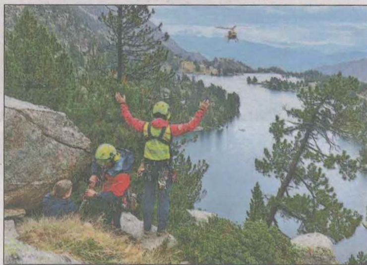
Efectius del GRAE rescaten la dona, a Espot

Els Bombers de la Generalitat, van rescatar ahir una excursionista accidentada a la zona del Pic de Peguera a Espot. L'avis va arribar a les 10.34 hores i es va activar l'helicòpter del GRAE, que va rescatar la dona, ferida al genoll. Així, la van dur a Tírvia, on una ambulància del SEM la va traslladar fins a l'hospital de Tremp.