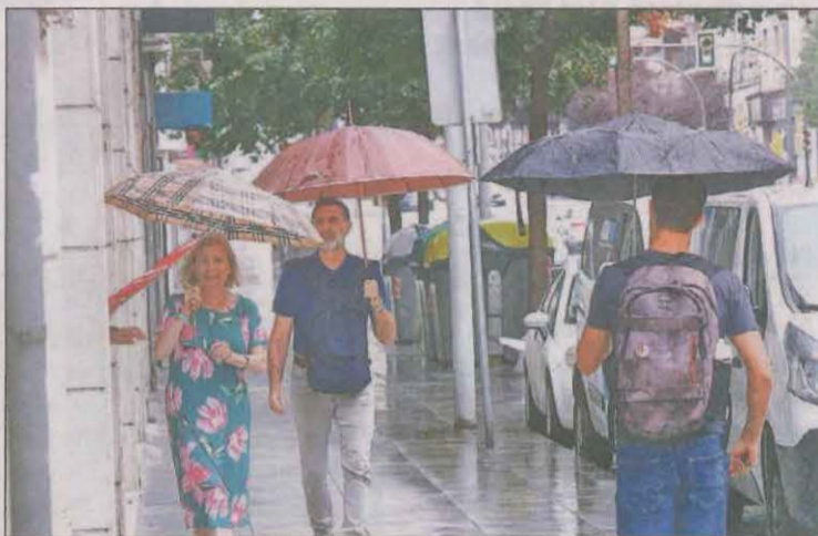
Els paraigües es van tornar a obrir ahir a Lleida

A banda del descens de les temperatures, els lleidatans van haver d'obrir els paraigües pel retorn de la pluja. No van ser ruixats molt intensos, però sí que van ser suficients per deixar endarrere la calor, que segons els pronòstics del Meteocat anirà a