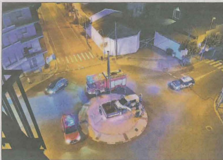
A l'esquerra, el vehicle encastat a la rotonda dels Països Catalans de Tremp; a la dreta, el cartell fet malbé a causa de la topada