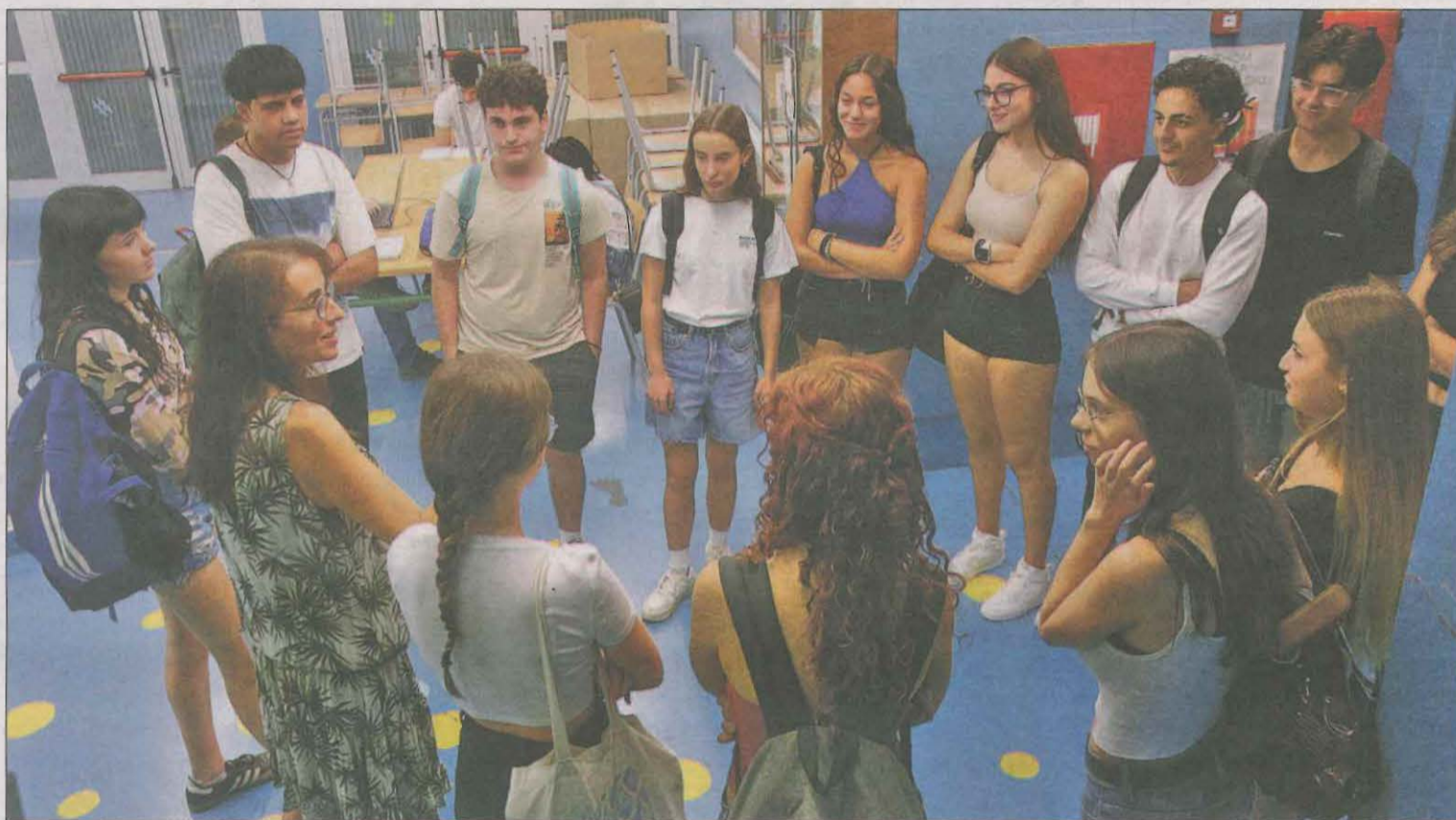
Rebuda a estudiants de Batxillerat a l'institut Samuel Gili i Gaya

Per altra banda, el Consell del Pla d'Urgell es va comprometre ahir a treballar perquè les línies de transport públic s'adaptin al estudiants de la comarca que tenen un problema similar, com els Sidamon o Gomés, ahir de desplaçar-se a cursar estudis postobligatoris a Mollerussa.