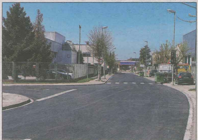
Un carrer del polígon industrial