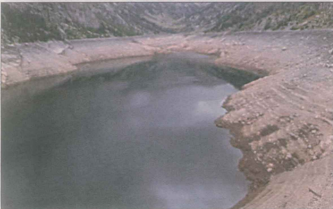
La cota de l'aigua de l'Estany ja es pot apreciar que ha baixat en aquests moments