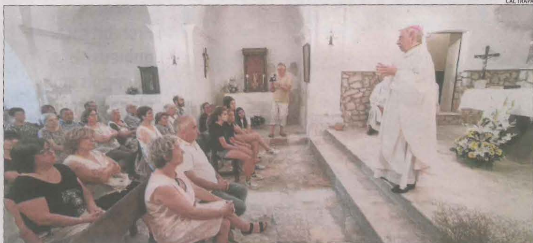
Imatge de la missa que es va celebrar a l'església de Corçà el passat dia 6.

Després de les obres per fer una nova teulada, que han costat uns 70.000 € || El temple es va tancar per la degradació que patia