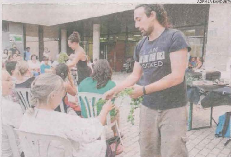
El col·lectiu Eixarcolant va oferir una xarrada pedagògica.