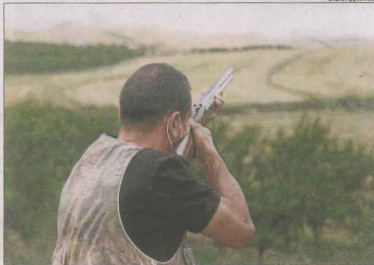
Imatge d'arxiu d'un caçador durant la mitja veda.

L'estornell vulgar, la garsa i el tudó completen la llista d'espècies que els caçadors poden abatre durant la mitja veda. Aquesta vegada arriba en un